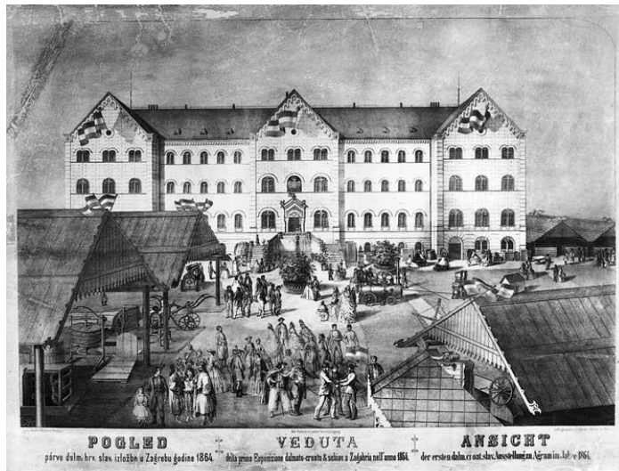
Slika 4. Prikaz Izložbe 1864. godine

listopada navodi da je jednoglasno odlučio brzojavom pozvati I. Mažuranića na otvorenje izložbe. 182 Zašto Mažuranić nije sudjelovao na otvorenju, nije poznato.