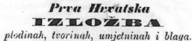
Slika 2. Naslov koji izvještava o Izložbi u Sidru 29.8.1864