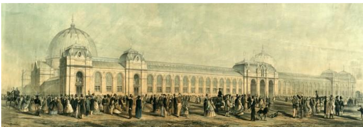
Slika 1. Međunarodna izložba u Londonu 1862., smještena u južnom Kensingtonu.

širenje, kako inovacija u sklopu tržišta, tako i ideološkog obrasca nacionalizma. Proizvodima izloženima pod specifičnom državnom zastavom postiglo se da ono izloženo postane specifičan trademark promocije jedne nacije pred drugim nacijama. 85 Zbog toga su internacionalne izložbe početkom druge polovine 19. stoljeća postale platforma za predstavljanje, ali ujedno i širenje nacionalnih identiteta. Internacionalne su izložbe prestale biti aktualne dolaskom novih medija za globalno širenje informacija, u drugoj polovini 20. stoljeća gdje je Belgijska svjetska izložba 1951. posljednja postigla uspjeh i posjećenost ekvivalentna ranijim izložbama. 86