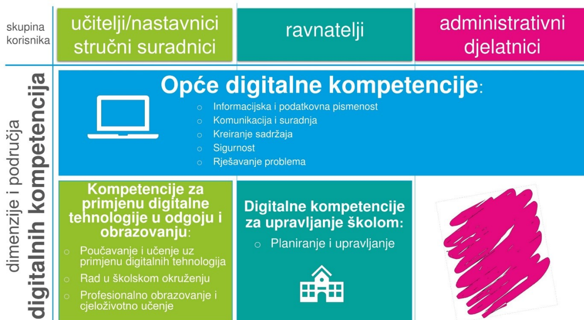
Slika 1. Shematski prikaz dimenzija i područja digitalnih kompetencija prema skupini korisnika

Koncept nastave na daljinu, prema Preporuci, utemeljen je na dvama ključnim principima: