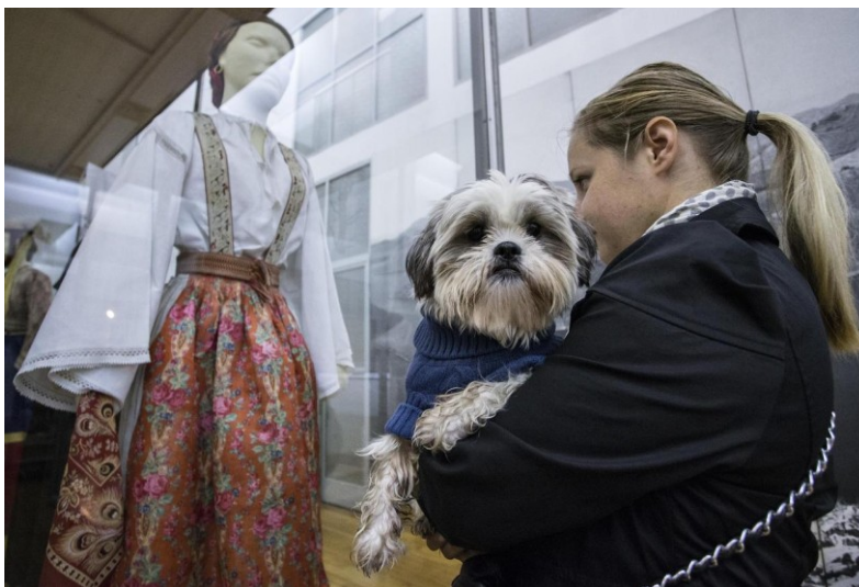
Slika 10. Posjetitelji Etnografskog muzeja

moćući, te u slučaju veće gužve ili izvanrednih okolnosti Muzej zadržava pravo ograničiti ulazak s ljubimcem. 146