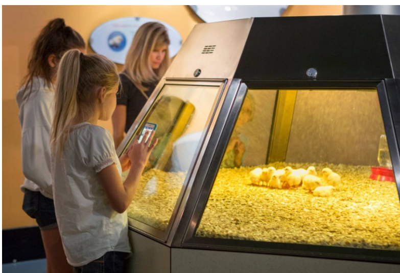
Slika 2. Pilići unutar izložbe „Genetika“ (engl. Genetics) Muzeja znanosti i industrije u Chicagu

ostala dio stalne izložbe Hrana za život (engl. Food for life) u odjeljku vezanom za prehranu. Valionice pilića su s vremenom uvedene i u drugim muzejima diljem zemlje, gdje su se odijeli za obrazovanje složili s upraviteljima muzeja da je izložba pedagoški vrijedna i dobra reklama za privlačenje posjetitelja. 33 Međutim na prelazu stoljeća prosvjedi organizacije Ujedinjene udruge za brigu o peradi (engl. United Poultry Concerns), koja je provodila kampanju protiv okrutnosti prema kokošima i peradi ispred jednog od znanstvenih centara, rezultirali su zatvaranjem izložbe nakon mjesec dana. 34