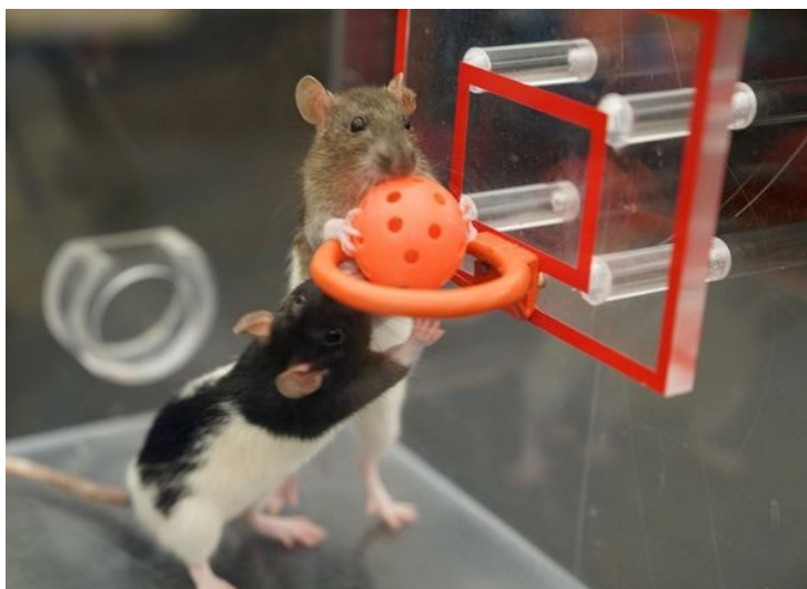
Slika 3. „Štakorska košarka“ (engl. Rat basketball)