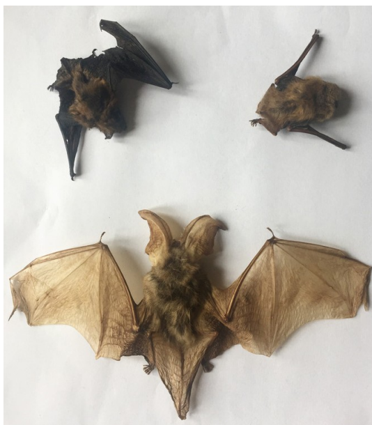
Slika 8. Preparirana tri bivša stanovnika knjižnice

O drugoj knjižnici, Knjižnici Joanina koja se nalazi u Portugalu u sklopu Sveučilišta u Coimbri je u sastavu diplomskog rada napravljeno istraživanje. Informacije o knjižnici, detalji istraživanja, metodologija i rezultati će biti navedeni u nastavku.