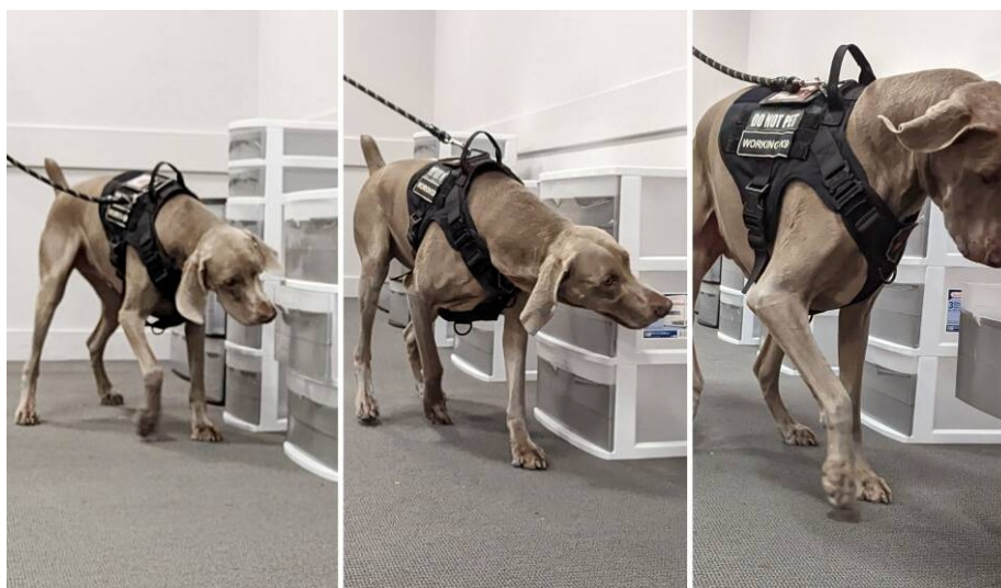
Slika 5. Riley njuši moljce prilikom obuke

u kojoj su namjeravali tepih iz depoa staviti u galeriju, ali prije toga pustili Rileyja da provjeri, nakon čega se pokazalo da je tepih bio zaražen. Kako je tepih bio smotan u rolu, isprva nisu bili sigurni je li Riley u pravu, no nakon što je odmotan, nametnik je bio uočen. 100 Svojim doprinosom Riley je postao dragocjen član muzejske obitelji Muzeja likovnih umjetnosti u Bostonu. Jest da ne obitava stalno i svoj posao većinom obavlja nakon radnog vremena muzeja, pri čemu ne dolazi u kontakt s posjetiteljima, tijekom COVID pandemije je ipak postao svojevrsan skrbnik MFA. Za vrijeme trajanja pandemije, kada je muzej bio zatvoren za javnost, Riley i njegova vlasnica živjeli su u muzeju kako bi osigurali prostore od katastrofe poput najezde kukaca, provala ili puknuća vodovodnih cijevi. Danas Rileyja njegovi kolege na treninzima tretiraju s poštovanjem i bodre poslasticama, ali im je također cilj pokazati da dobri vlasnici čine dobrog psa i radnika. Premda Riley svoj posao radi u pozadini, daleko od očiju posjetitelja, posjetitelji mogu biti sigurni kako su muzejski djelatnici i Riley razložili što su umjetnine očuvane i u dobrom stanju. 101