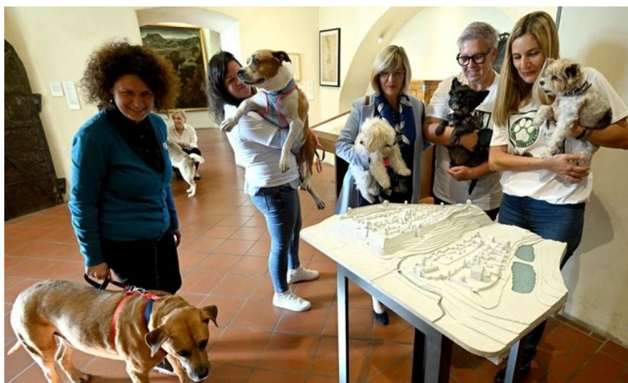
Slika 12. Muzej grada Zagreba otvorio vrata psima

povodcu, prije posjeta je poželjno nahraniti psa, dobro ga prošetati i s njime obaviti nuždu prije samog ulaska, te se moraju pridržavati svih ostalih već ranije spomenutih pravila. S time da zaposlenici muzeja ohrabruju posjetitelje kako nema straha ako se i dogodi situacija da pas obavi nuždu unutar prostora muzeja, jer razumiju da se takve situacije mogu dogoditi, bitno je samo odmah obavijestiti osoblje kako bi se pravovremeno reagiralo. Također napominju kako Muzej zadržava pravo zabraniti ulaz opasnim psima, odnosno životinjama koje pokazuju napadački stav prema ljudima, kao i psima koje vlasnik ne može obuzdati i držati poslušnima, te u slučaju otvorenja izložbi i posjeta većih grupa posjetitelja. Službeni psi su uvijek dobrodošli, bez obzira na okolnosti. 153 Zaposlenici muzeja su uvjereni kako će se ovom promjenom otvoriti nove buduće suradnje i projekti, te kako će obitavanje kućnih ljubimaca u prostorijama muzeja doprinijeti pozitivnoj sveopćoj atmosferi u muzeju. Tajniku Hrvatskog kinološkog saveza je iznimno drago što je Hrvatska prepoznala potrebu za mjestima prilagođenim psima (engl. dog friendly), jer smatra kako Hrvatska iako želi biti otvorena prema turistima, još uvijek nije u potpunosti, te još uvijek nedostaje fleksibilnosti oko dopuštanja ulaska psima u različite institucije, pa i muzeje. Ipak, nada se kako će se i ostali muzeji diljem Hrvatske uključiti u projekt i otvoriti svoja vrata životinjama. 154