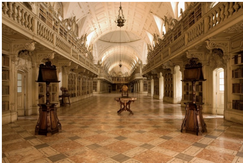
Slika 7. Knjižnica Nacionalne palače u Mafri, Portugal

subkulture dolaze i obitelji s djecom kako bi naučili, podržali, ali i možda ugledali pokojeg šišmiša, te se tako navečer kada padne mrak mogu naći nekolicina ljudi kako s lampama obilazi oko knjižnice u nadi da će ugledati šišmiše „kako rade svoj posao.“ 124 Također, znanstvenici pri svemu tome iskorištavaju priliku kako bi skupili podatke, jer kada nađu mrtvog šišmiša u knjižnici ili van nje, prikupit će ga i napraviti daljnja istraživanja. Međutim, kako bi odali počast šišmišima, u knjižnici je postavljena mala staklena vitrina, gdje su prikazana tri preparirana bivša stanovnika i to po jedan od svake vrste. 125 Knjižnica je u svakom pogledu jedinstvena, što zbog same arhitekture, što zbog posebnih „zaposlenika“, te kako navodi Robelo se uz miris starih knjiga, okoliša i šišmiša stvorila posebna povijesna priča. 126