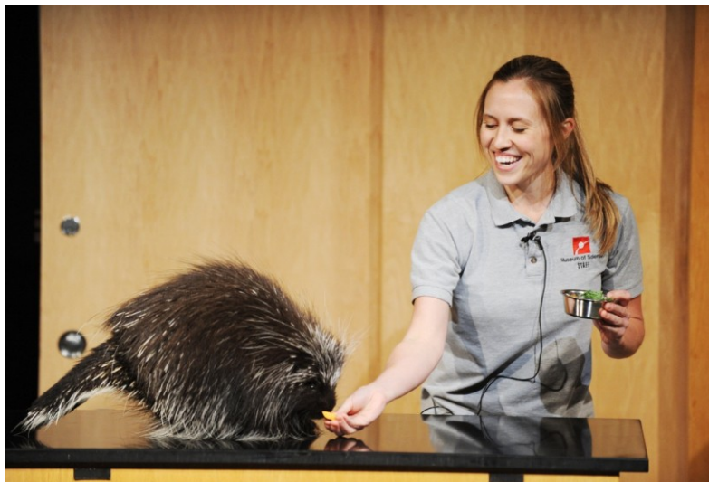
Slika 1. Prezentacija živuće životinje – dikobraz

Posjetitelji tada imaju mogućnost dodirnuti jednu od živućih životinja iz divljine, a koje su sada dio izložbe, naravno uz konstantan nadzor stručnjaka za životinje. Muzejski djelatnici pozivaju posjetitelje (najčešće djecu) da ostvare kontakt sa životinjama. Životine s kojima mogu doći u interakciju su dva dikobraza imena Herkemiah i Cuddles, čiji je mehanizam izbacivanja zaštitnih bodlji onemogućen, sova Spooky, koja je pronađena kao mladunče i uzeta na brigu i skrb u muzej i ostale živuće životinje, poput kornjača, guštera, vidre iz kolekcije od otprilike 120 jedinki. 28 Srednjoškolci koji su u početku dolazili brinuti o životinjama su predstavljali još jedan dio pedagogije izlaganja. Tadašnji ravnatelj je tu vrstu izlaganja nazvao „znanost u akciji“ (engl. science-in-action). 29 Do kasnih 1960. godina se razvio dodatan model izlaganja živih životinja, također zasnovan na angažiranom učenju. Tim modelom se posjetitelje kao i dizajnere izložbi postavilo u ulogu znanstvenika, koji bi se igrali i eksperimentirali sa živućim izlošcima.