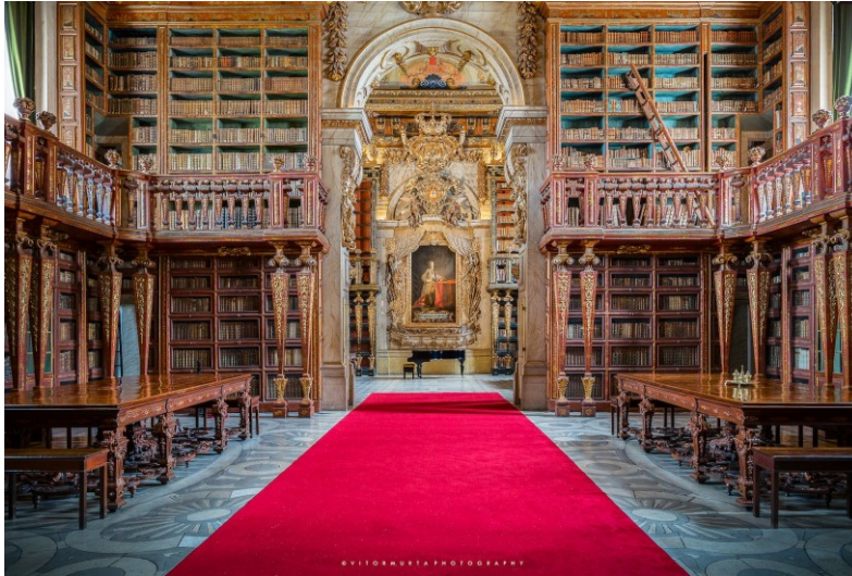
Slika 8. Knjižnica Joanina