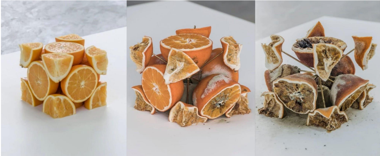
Slika 7: Étienne Chambaud, Cella , 2018.

Da bismo kao društvo lakše vizualizirali potencijalne budućnosti hrane, potrebna nam je pomoć umjetnika s dovoljno kreativnosti da iskonstruiraju nove narative u suradnji s muzejskim i baštinskim institucijama koje mogu iskoristiti svoje iskustvo u komunikaciji sa širokom publikom i zajednicama koje ih okružuju. Baštinska industrija ima moć ne samo štititi i čuvati tradicije pripreme hrane, već ponuditi nova rješenja suvremenom društvu. Prošlost i budućnost hrane ne moraju nužno biti u sukobu, ali vjerujem da se prakse koje pridonose sustavnom uništenju okoliša, uključujući i pretjeranu eksploataciju životinja koje su nažalost u gotovo svim kulturama izrazito zastupljene kao hrana, trebaju transformirati i korjenito promijeniti.