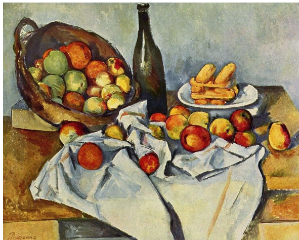
Slika 4: Paul Cézanne, Košara s jabukama , oko 1893., Institute of Chicago, Chicago, 65 × 80 cm