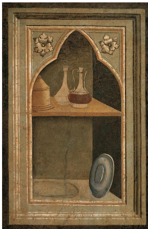
Slika 2: Taddeo Gaddi, Niša s pladnjem, ciborijem i vrčevima s vinom i vodom , kapela Baroncelli u Santa Croce, Firenca, 1337.-1338.

Upravo u Firenci, Giottovom gradu i gradu njegovih nasljednika, tijekom XIV., XV. i XVI. stoljeća dolazi do procvata umjetnosti, znanosti i društva. Najraniji period onoga što možemo okvirno nazvati protorenesansom ipak je u slikarstvu poznatiji kao internacionalna gotika, upravo zato što se utjecaj nasljednika Giotto i Duccia, već pomiješan s tradicijom francuskih minijaturista, ubrzano proširio i sjeverno od Alpa preko Lombardije. 21 U drugoj polovici XIV. stoljeća u umjetnosti sjeverne Italije vidljivo je jačanje interesa za prikaze svakodnevnih predmeta, interijera i hrane, što je posebice pogodovalo popularizaciji scena Navještenja , Posljednje večere , Herodove gozbe , Čuda u Kani te svetaca u njihovim studijama. 22 Ti pokušaji sve vjernijeg realizma u detaljima najčvršće uporište nalaze u Flandriji, gdje će u nadolazećem stoljeću doživjeti umjetničku inovaciju bez premca upravo u kompozicijama mrtve