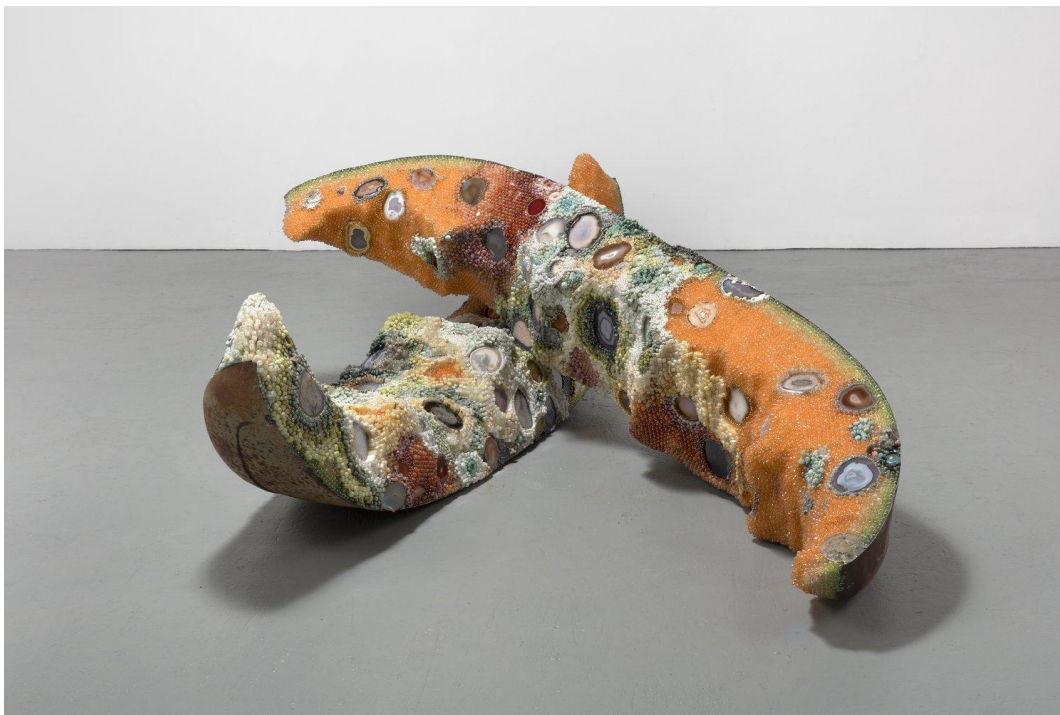
Slika 6: Kathleen Ryan, Bad Melon (Double Rainbow) , 2022, 33.5" H x 93" L x 93" W

Muzeji također postaju mjesto radikalnih promišljanja o hrani, što je pokazala i izložba Food: Bigger Than the Plate u britanskom Victoria & Albert muzeju koja je bila izložena od 18. svibnja 2019. do 20. listopada 2020. godine, 138 i pokazala višestruke perspektive alternativnih budućnosti hrane od urbanog vrtlarstva do reciklaže, kompostiranja, gastronomskih eksperimenata i mnogih srodnih ideja koje kolektivnim promjenama u društvu mogu donijeti do bolje kvalitete života za sve, a to su demonstrirali i na vlastitom primjeru iz svog kafića i restorana, gdje su prikupljali iskorištene ostatke mljevene kave i davali ih farmi gljiva koja je u njima uzgajala bukovače, kasnije posluživane u restoranu Muzeja Victoria & Albert, čime je muzej zatvorio petlju održivosti vlastitih resursa. 139