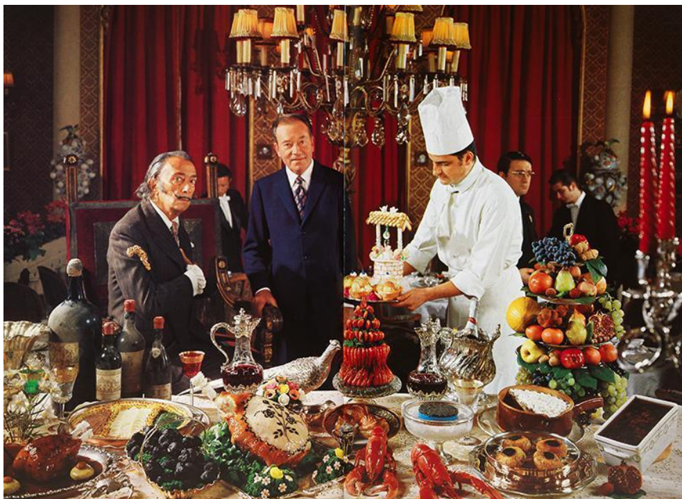
Slika 5: Salvador Dalí ispred banketa pripremljenog prema receptima iz njegove kuharice Les diners De Gala , 1973.

Campbellove juhe u konzervi, 78 koji će postati jedan od najprepoznatljivijih simbola pokreta ali i industrijski masovno proizvedene hrane koja se sve intenzivnije pojavljuje nakon Drugog svjetskog rata. Odnos društva prema hrani nakon ratne i poslijeratne krize zauvijek će se promijeniti pod kapitalističkom produkcijom, što je vidljivo i u umjetnosti tog vremena. Claes Oldenburg, još jedan predstavnik pop arta, najpoznatiji je po svojim “mekim skulpturama” od tekstila, pamuka, spužvi i sličnih mekih materijala kojima je replicirao predmete iz svakodnevnog života, a među njegovim najpoznatijim motivima je upravo hrana – komično predimenzionirana jaja, hamburgeri, prženi krumpirići, sendviči, kriške torte, sladoled u kornetu i ostali slični motivi svjedoče o njegovoj fascinaciji američkom kulturom zalognica i fast fooda koji postaje jedna od okosnica suvremenog načina života. 79