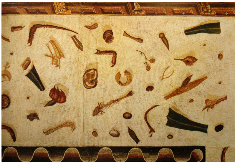
Slika 1: Nepometena soba (Asarotos oikos) , prema Sosusu iz Pergama, Muzej Gregoriano Profano, Vatikan. 4.05 x 0.41 m.

Samostalne scene mrtvih priroda tematike hrane u antičkoj Grčkoj doživjele su brz uzlet pod nazivom xenion (u značenju dara za goste) koji su odražavali tadašnji običaj i društvenu obavezu da bogati vlasnik kuće svakodnevno svojim dugoročnim gostima ili stanarima poklanja hranu koju bi si oni samostalno pripremali u obroke – tako su se na slikama mogle vidjeti naslikane štruce kruha, voće i povrće, meso, morski plodovi, mlijeko i jaja, vino, ulje i ocat, često u ukrasnim pliticama i vazama. 13 U svijetu antičkog Rima prisutan je isti fenomen (kojeg Vitruvije naziva xenia govoreći o grčkim slikama, iako je riječ xenia u Grčkoj označavala sam koncept gostoljubivosti i velikodušnosti prema neznancima, rimljanima poznat kao hospitium ), na što nam ukazuju freske sačuvane u nesretnim Pompejima i Herkulaneju. 14 Čuvena Kuća jelena ( Casa dei Cervi ) u Herkulaneju bila je gotovo u potpunosti oslikana freskama, a posebno je zanimljiv niz mrtvih priroda koje su prikazivale breskve, suho voće, gljive, transparente staklene čaše (izuzetan luksuz tog doba) te mrtve zečeve, kokoši, drozdove, jarebice i jegulje spremne za pripremu, prikazane na policama ili kukama za meso. Prema ovim primjerima možemo zaključiti kako su umjetnici stremili prikazati bogatstvo naručitelja kroz svakodnevne motive, simulirajući jednostavne životne užitke, raspoređujući hranu naizgled nasumično kako bi ostavili što