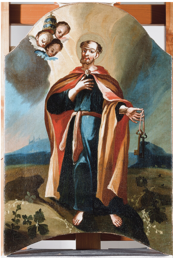
Slika 18. Sv. Petar (detalj fotografije)