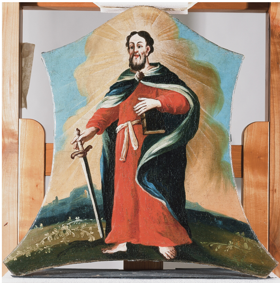
Slika 17. Sv. Pavao (detalj fotografije)

Manja slika koja je smještena na krunište oltara prikazuje svetog Pavla apostola koji zauzima gotovo čitav kadar. Format slike neobičnog je konkavno-konveksnog oblika koji je neupitno barokni, bez ijednog ravnog brida, a podsjeća na naopako okrenuti štit. Dimenzija je 54 × 54,5 centimetara. Svetac je prikazan kako stoji u pustom krajoliku bez istaknutih obilježja, a uz noge mu rastu vitice s bijelim cvijećem. U pozadini iskorištena je atmosferska perspektiva u modrim tonovima. Nosi dugačku crvenu tuniku povezanu bijelim pojaseom, a preko ramena prebačen mu je tamno modri plašt bijelih rubova koji seže sve do tla, pričvršćen ispod svečevog vrata velikom dekorativnom kopčom. Iza Pavla uzdiže se gusti oblak žućkastih tonova, a oko glave i torza iz njega isijava zrakasta svjetlost. Njegova glava je izdužena, ima kraću valovitu smeđu kosu i ponešto prorijeđenu bradu i brkove. Prikazan je bosonog, s mačem u desnoj ruci,