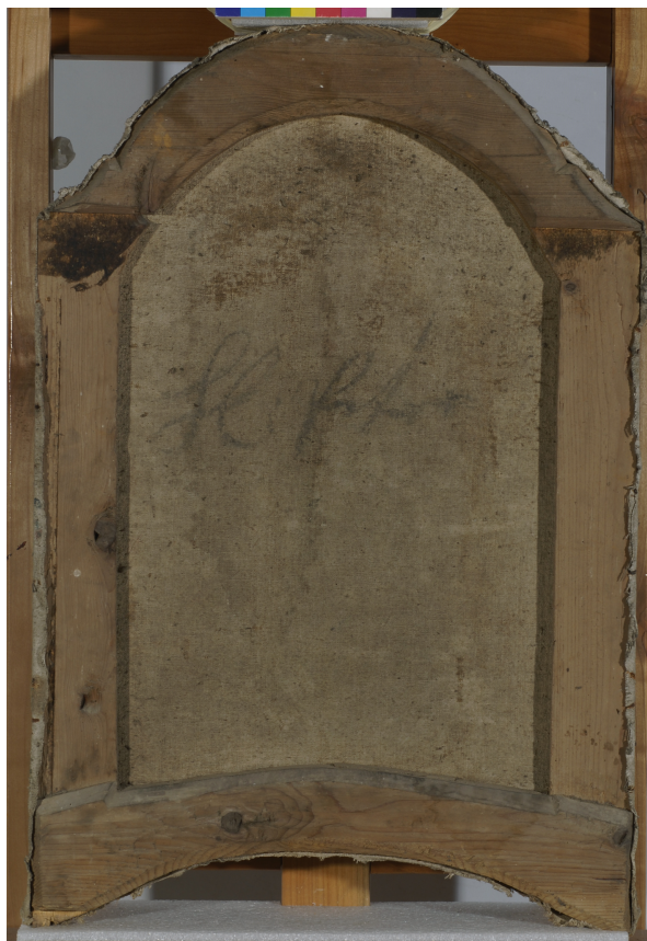
Slika 19. Poledina slike Sv. Petar s potpisom (detalj fotografije)

Ivana Sambolić iste godine izvela je i restauracijske radove na glavnoj oltarnoj pali dimenzija 84 × 75 centimetara koja prikazuje svetog Petra. 167 Ovo djelo centralni je likovni prikaz oltara u kapeli u Boku Palanječkom, flankirana skulpturama svetih kraljeva Ladislava i Stjepana. Bočni bridovi su ravni, donji je konkavan, a gornji konveksan. Sveti Petar uspravno stoji u samom središtu kadra, pogleda i tijela usmjerenog prema promatraču. Jednako kao i sveti Pavao, prikazan je u poprilično pustom krajoliku s nekoliko biljnih vitica i nešto raslinja u blizini nogu. Bosonog je i odjeven u dugu tamno modru tuniku sa žutim zavezanim pojaseom i plaštem s iza zabačenom kapuljačom. Plašt je, kako je uobičajeno u tradiciji, žute boje koja simbolizira