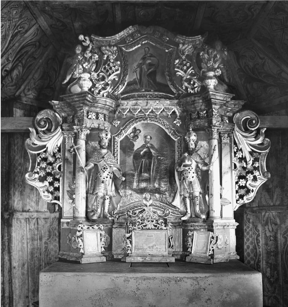
Slika 12. Oltar kapele sv. Petra i Pavla 1939. (detalj fotografije)

Oltar sv. Petra i Pavla kao cjelina dinamiziran je tipično baroknim konkavno-konveksnim oblikovanjem. Konstrukcija retabla izrađena je od dasaka debljine do 2 centimetra spojenih