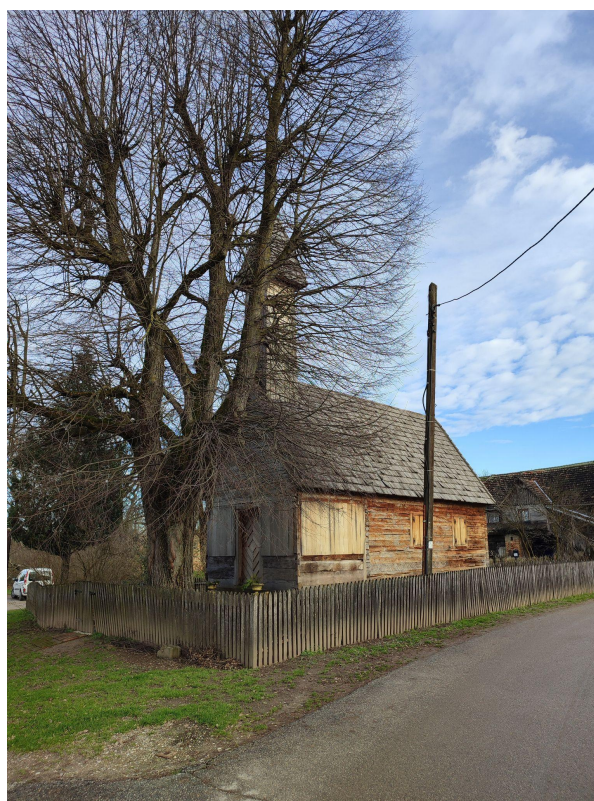
Slika 4. Kapela s jugozapadne strane 2023.

Poseban element koji stoji uz ovu kapelicu neobičan je kameni pilon koji se nalazi s istočne strane iza svetišta, najvjerojatnije sastavljen od preklesanih kamenih spolija, visine otprilike 3,5 metra. On je nepravilnog oblika i sastoji se od četiri kamena segmenta naslagana