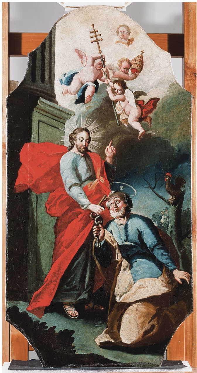
Slika 8. Predaja ključeva sv. Petru (detalj fotografije)