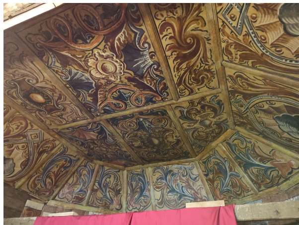
Slika 10. Restaurirani oslik svoda nad svetištem