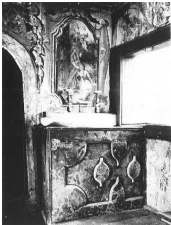
Slika 16. Mali oltar u predvorju, vjerojatno u vizitacijama spomenut kao stari oltar sv. Petra, preuzeto od Đurđice Cvitanović