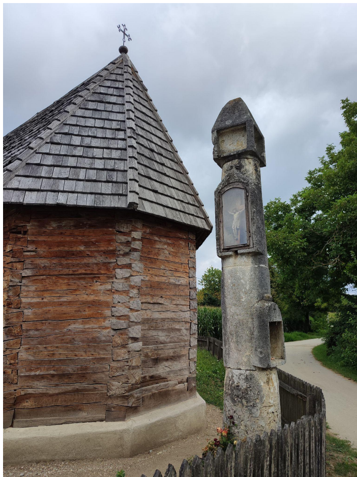
Slika 5. Kameni pil iza svetišta

Do obnove 2015. godine kapela je bila ožbukana i njeno krovništvo na dvije vode bilo je pokriveno crijepom, osim zvonika izložene drvene konstrukcije s limenom kapom. Davor Salopek karakteristike kapele identificira kao povijesno-vremenski relevantne, a nju samu kao jedan od vrhunskih primjera arhitektonskog i konstruktivnog oblikovanja prostora i detalja, u kategoriji crkvi s narteksom (lojpom), kojoj je hitno potrebna sanacija (u radu objavljenom 2011. godine). 131 On ističe da su kapele na području Sisačke biskupije građene najvećim dijelom od drva, što je i očekivano (uz izuzetak kapele Svetog Antuna u Dvorišću, Svetog Petra u Taborištu