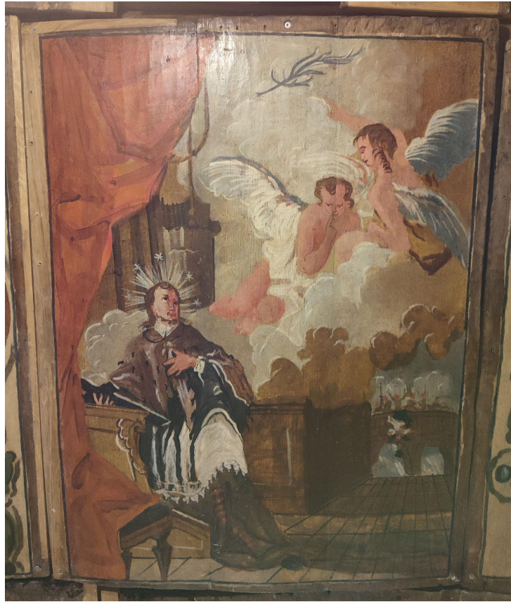
Slika 11. Prikaz sv. Ivana Nepomuka na tabulatu broda kapele nakon restauracije

Prikaz svetog Ivana Nepomuka oslikan je na drvenom tabulatu u lađi kapele te nije centriran, već izmaknut u stranu poslanica. Formata je uspravno postavljenog pravokutnika, dimenzija otprilike 100 × 86 centimetara, usmjeren je prema ulazu u kapelu a suprotno oltaru. Doima se kao quadro riportato , ali je zapravo dio tabulata. Svetac je prikazan u crkvenom interijeru, u prvom planu na lijevoj strani slike koju zaključuje bogata crvena draperija koja u naborima pada iz gornjeg lijevog kuta preko niskog taburea u donjem lijevom kutu slike. Čini se da je svetac odjeven u tamnu reverendu preko koje nosi bijelu roketu, porubljenju čipkom, a zagnut je kratkim smeđim krznenim plaštom. U desnoj ruci drži križ, a lijevu prinosi prsima kada ga u molitvi pri klecalu prekidaju dva lebdeća anđela, obavijena kovitlacem oblaka koji opskuriraju ostatak interijera. Lice svetog Ivana Nepomuka djeluje mladenački premda ima