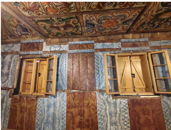
Slika 9. Restaurirani oslik stijenke sa strane poslanica