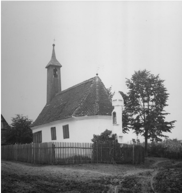
Slika 6. Kapela s jugoistočne strane 1957.

i Svetog Jurja u Letovancima, čiji zidovi su izvedeni u opeci), i to uglavnom od hrastovine prema pučkoj tradicijskoj gradnji i po mjeri čovjeka. 132