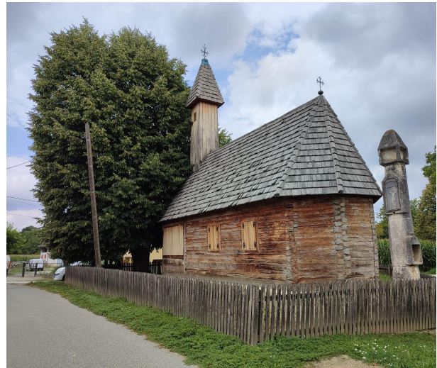
Slika 7. Kapela s jugoistočne strane 2023.