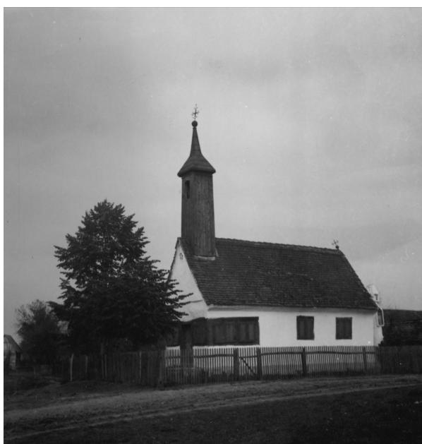
Slika 3. Kapela s jugozapadne strane 1957.

3,9 × 11 metara, s poligonalnim svetištem od tri stranice s vanjske i unutarnje strane. Predvorje dimenzija 2,5 × 3,6 metara odvojeno je od lađe drvenim zidom u kojeg su upisana nepravilno polukružno zaključena dvokrilna rezbarena vrata, čime se svrstava među tipične barokne drvene kapelice pravokutne osnove. Iznad predvorja otvorenog krovišta izdiže se jednostavan toranj zvonika s jednim zvonom. Jedina dva prozora u današnjoj kapeli nalaze se sa strane poslanica, pravokutni su i dvokrilni, što se ponavlja i na vanjskim drvenim kopcima koji ih štite. Iz arhivskih fotografija vidljivo je da su u prošlosti dva dvokrilna prozora flankirala portal kapele, a na južnom pročelju postojala su četiri prozora, no ti otvori su zatvoreni daskama sve od obnove 1901. godine. Imena graditelja kapele nisu nam poznata.