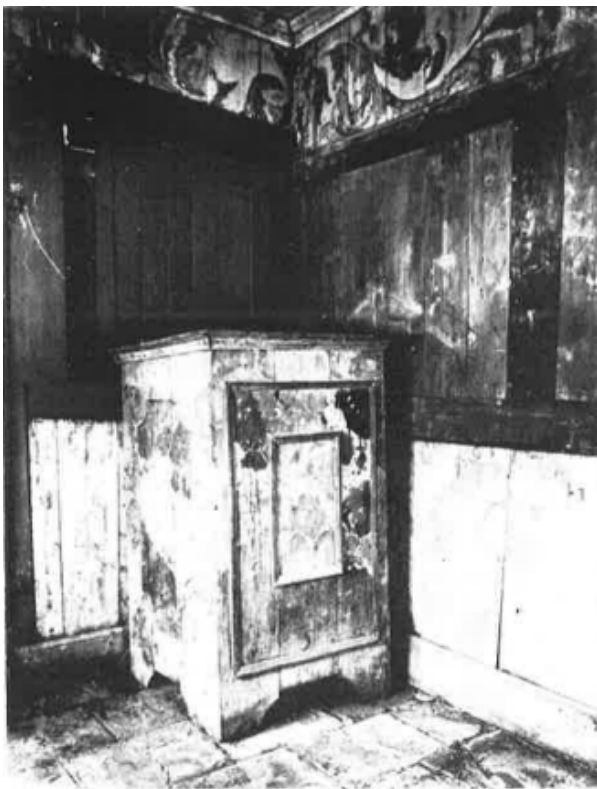
Slika 15. Prijenosna propovjedaonica, preuzeto od Đurđice Cvitanović