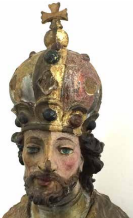
Slika 13. Skidanje preslika sa skulpture sv. Ladislava