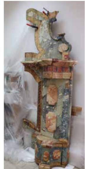
Slika 14. Izvorna polikromija na oltaru nakon čišćenja

Dva elementa izgubljena u velikoj obnovi kapele 1901. godine su mali drveni oltar (stipes i mensa) u predvorju koji je stajao ispod slike Predaja ključeva sv. Petru i prijenosna propovjedaonica, za koju Cvitanović tvrdi da je bila jedinstvena uz onu u Sv. Barbari u Brestu i Svetom Duhu u Poljani Lekeničkoj. 161 Propovjedaonica bila je jednostavnog oblika uspravljenog kvadra s minimalnim pravokutnim profilacijama s prednje strane i postavljen na nogice, a oltarić bio je oblika položenog kvadra s asimetrično apliciranim jednostavnim drvenim dekoracijama.