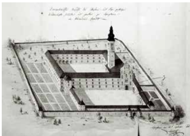
Slika 2 Perspektivni pogled na lepoglavski samostan, 1851.

Lepoglavski sklop samostana i crkve dočekaio je kraj Drugog svjetskog rata iznimno oštećen. Požar 1943. godine je uništio većinu krova zgrade što je ugrozilo oslik u refektoriju samostana. (Slika 3) Najveću štetu učinilo je ipak detoniranje municije deponirane u dvorištu kaznionice ispred zapadnih pročelja crkve i samostana od strane njemačkih trupa 1945. godine. Od posljedica usisnog djelovanja eksplozije zapadno pročelje crkve se otklonilo od tijela građevine. (Slika 4) To je uzrokovalo prijelom zbog kojeg se zabat pročelja srušio, a zidovi su popucali na čitavom zapadnom dijelu crkve. Svodovlje crkve je također popucalo, a oslik u svetištu je djelomično otpao. 52