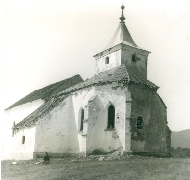
Slika 12 Očura, kapela sv. Jakova, pogled na oštećeno svetište, 1945.