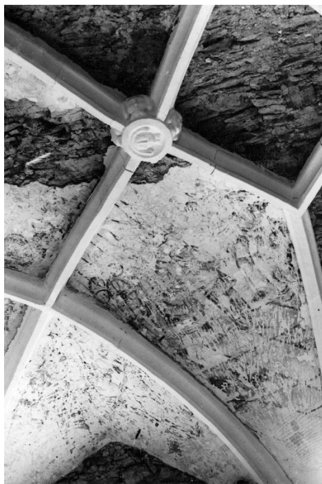
Slika 22 Belec, crkva sv. Jurja, oslik svoda broda, Tihomil Stahuljak, 1947.

osloboditi od žbuke te ponovno položiti žbuku gdje oslik nije sačuvan. (Slika 22) Isto tako je u unutrašnjosti tornja bilo potrebno skinuti svu žbuku da bi se nova nanijela samo na dijelove za koje se konstatira da su izvorno bili ožbukani. Objekt je iziskivao niz hitnih zahtjeva od kojih je restauracijski samo onaj na gotičkim prozorima svetišta, preostali su konzervatorski (popravak krovništa, uspostava funkcionalnog sistema odvodnjavanja oborina, nova žbuka, drenaža). Planiralo se i konzerviranje iskopanih temelja kapele sv. Katarine. 277