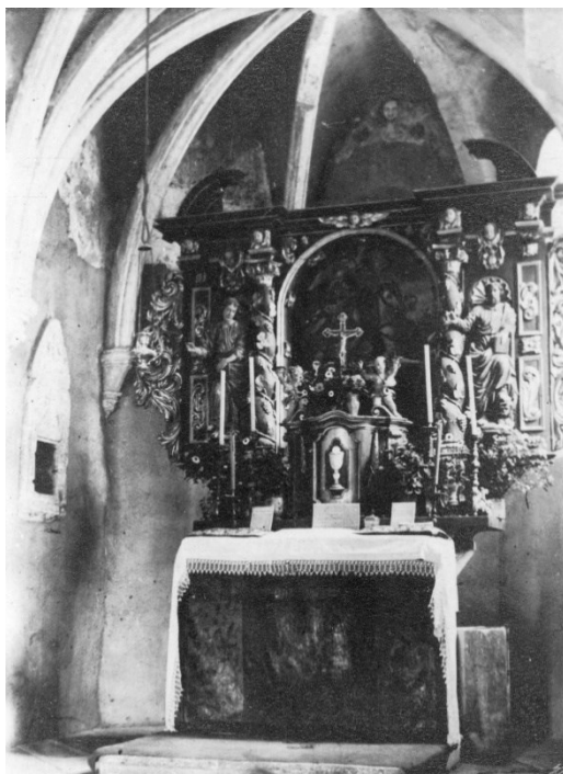
Slika 23 Belcu, crkva sv. Jurja, glavni oltar nakon popravka, Zdenka Munk, 1948.

Prilikom radova postalo je jasno da je izgled oltarne menze kombinacija intervencija iz 15. i 17. stoljeća, ali je utvrđen njen izvorni izgled iz prve polovice 14. stoljeća. Adaptacije i izvorni oblik utvrđeni su i za retabl iz 18. stoljeća. Iznad prozora u svetištu pronađeno je još ostataka zidnih slikarija koje se stilski slažu s onima iz broda. Otkrivene su izvorna polikromacija i ornamentiranje na kamenim dijelovima trijumfalnog luka i rebara u svetištu te nekoliko likova kasnobaroknog oslika na luku između broda i tornja. 282 Ana Deanović je 6. prosinca u Belcu kolaudirala ugovor s Hohnjecom. Završen je dogovoren posao na „otkrivanju i konzerviranju zidnih i svodnih slikarija, čišćenju zidova u tornju i svih kamenih klesanih dijelova u unutrašnjosti, adaptaciji oltarne menze i konzerviranju retabla“. 283 (Slika 23) Hohnjec je u izvještaju o radu upozorio na vlagu koja je i dalje ugrožavala zidni oslik. 284