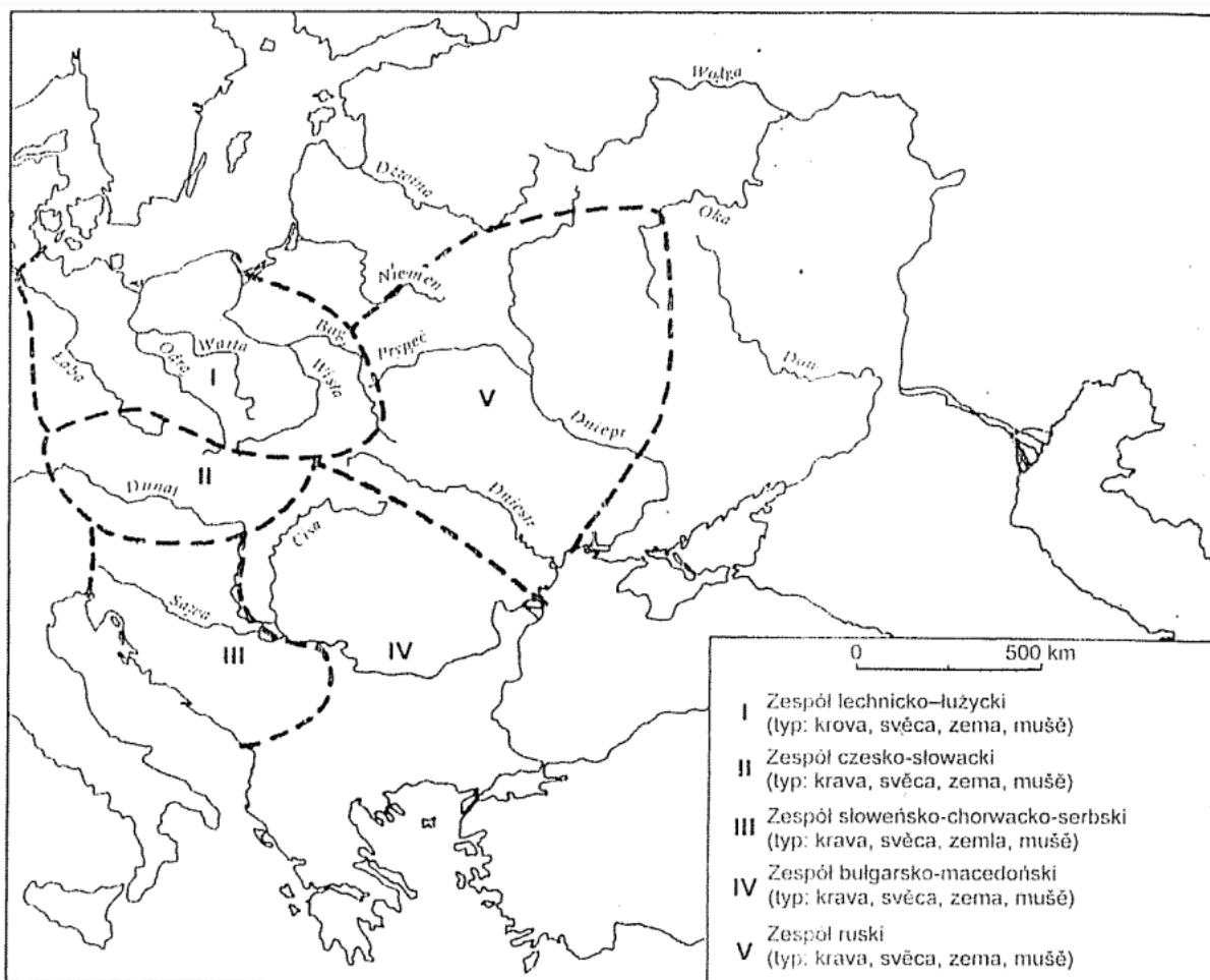
Mapa 10. Zasięgi słowiańskich zespołów językowych w IX–X w.

Slika 3. karta slavenskih dijalekata u 9-10. stoljeću. (preuzeto iz Moszynski, L. (1984), Wstęp do filologii słowiańskiej, Vašrava, PWN)