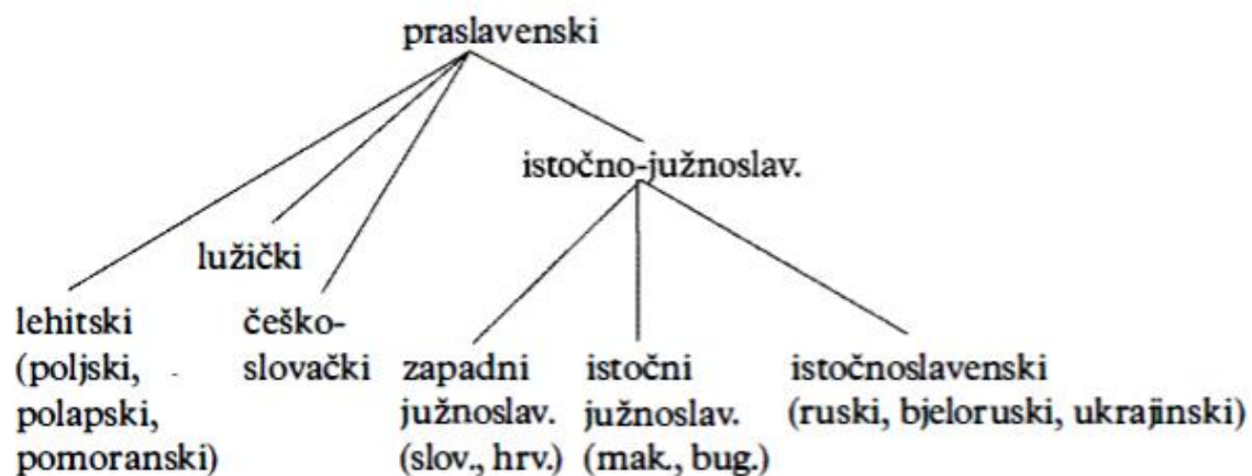
Slika 2. podjela slavenskih jezika. (preuzeto iz Matasović, Ranko (2008), Poredbenopovijesna gramatika hrvatskoga jezika , Zagreb, Matica hrvatska)

Danas se slavenski jezici tradicionalno dijele na tri velike skupine: zapadnoslavenske, istočnoslavenske i južnoslavenske. Pisani tragovi staroslavenskoga ostavljaju nedvojbene tragove o postojanju zajedničkoga prajezika tih triju skupina, a to je, naravno, praslavenski jezik. Posebice je zanimljivo da su brojne jezične izoglose i tzv. jezične inovacije poprilično strogo odvojile zapadnoslavenske jezike od istočnoslavenskih i južnoslavenskih, koji su se u tome trenutku još neko vrijeme držali zajedno prije konačnog raspada. Međutim, ovdje nema govora o zajedničkom prajeziku tih dviju većih skupina. No, brojna se pitanja otvaraju kada je riječ o južnoslavenskim jezicima. Sasvim bi bilo logično i očekivano za zaključiti da je na prostoru južnoslavenskih jezika postojalo određeno zajedništvo u jezičnom pogledu, no takve se podudarne izoglose ne nalaze, stoga se nikako ne može govoriti o zajedničkom prajeziku. Rasprostranjenost je i utjecaj štokavskog, čakavskog i kajkavskog narječja ipak objedinila spomenute dijalekte u zajednički zapadanojužnoslavenski prajezik, a makedonske je i bugarske dijalekte objedinio istočnojužnoslavenski prajezik od kojih je nastala današnja konačna podjela na hrvatski, slovenski, srpski, crnogorski i bošnjački jezik na zapadu te makedonski i bugarski jezik na istoku cjelokupne južnoslavenske zajednice.