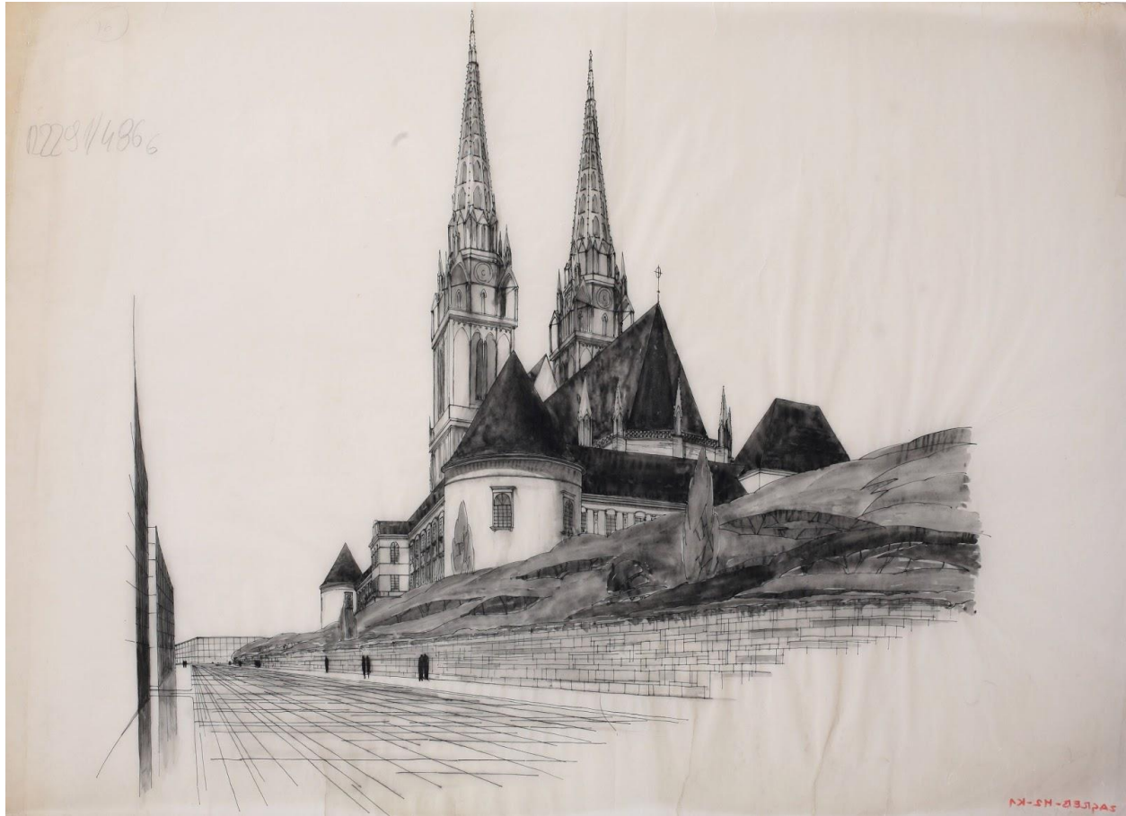
Slika 8. Regulacija Kaptola Ede Schöna i Milovana Kovačevića, pogled na katedralu iz Vlaške ulice