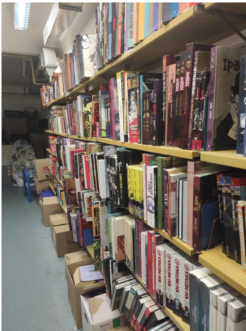
Slika 4. Zbirka stripova i grafičkih romana na Odjelu za odrasle Knjižnice i čitaonice „Fran Galović“ Koprivnica (građa u spremištu)

Sa spomenutim načinom slaganja na police slaže se i Hartman (2010) koja kaže da organiziranje stripova i grafičkih romana isključivo prema imenu autora može zbuniti korisnike jer mnogi serijali imaju različite autore, a poneki i nakladnike koji mogu drastično izmijeniti izgled naslovnice i formata. No, tvrdi da slaganje na police isključivo po nazivu također nije dobro rješenje jer se kod nekih serijala događa da naslov serijala nije jasno istaknut na naslovnici. Zaključuje da je najbolje, kada je to moguće, slagati stripove i grafičke romane najprije abecedno prema naslovu serijala, a zatim po naslovu svake epizode.