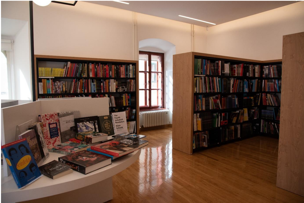
Slika 2. Zbirka stripova i grafičkih romana na Odjelu strane literature i multimedije Gradske knjižnice i čitaonice „Metel Ožegović“ Varaždin

Zbirka stripa Knjižnice i čitaonice „Fran Galović“ Koprivnica dio je Odjela za odrasle koji se nalazi u prizemlju zgrade. Zgrada knjižnice ima ograničene prostorne kapacitete pa se dio građe ne nalazi u otvorenom pristupu dostupnom korisnicima, nego u spremištu ispod Odjela. Iako nije vidljiva korisnicima na uobičajeni način, korisnici mogu pretražiti katalog te naručiti kod knjižničara željene naslove. Dio zbirke koji se nalazi u otvorenom pristupu najčitanija su izdanja te nova izdanja. Zbog rasporeda i redoslijeda UDK skupina, zbirka stripa smještena je na ulazu u knjižnicu. Za strip su osigurane dvije police koje se nalaze na najfrekventnijem mjestu u knjižnici te mu je time osigurana odlična vidljivost. Jednako kao i u varaždinskoj knjižnici, stripovi i grafički romani posloženi su abecednim redom prema crtaču, a teorija i povijest stripa nalaze se na zasebnoj polici.