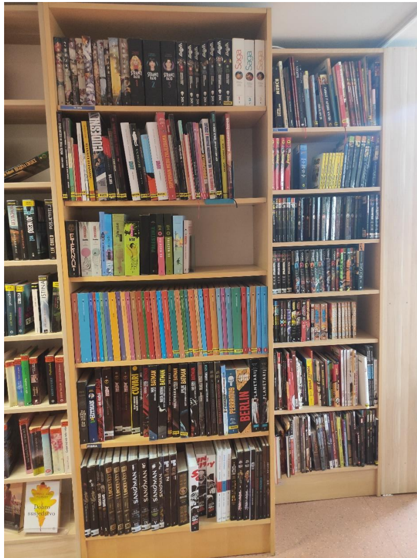
Slika 3. Zbirka stripova i grafičkih romana na Odjelu za odrasle Knjižnice i čitaonice „Fran Galović“ Koprivnica (građa u otvorenom pristupu)