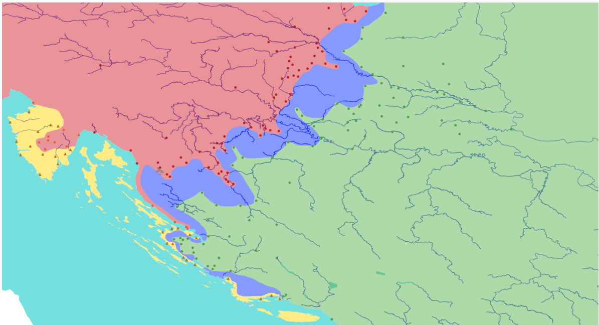
Slika 1. Prikaz pograničja („ničije zemlje“ ili terra nullius , plava boja) između Habsburške Monarhije, Mletačke Republike i Osmanskog Carstva 1577/8. godine. Zamišljene granične linije država povučene su principom spajanja najbližih susjednih pograničnih utvrda (crveno – Habsburška Monarhija; zeleno – Osmansko Carstvo; žuto – Mletačka Republika). Karta, dakako, nije potpuno točan prikaz zona utjecaja, već služi kao ilustracija iznesenih tvrdnji kako ne možemo govoriti o jasno povučenim graničnim linijama (linija razgraničenja u Istri prati konvencionalni način prikazivanja granice u atlasima budući da navedeno područje nije bilo u fokusu istraživanja). Udaljenost između linija utvrda bila je najveća u međuriječju Save i Drave gdje je prosječno iznosila oko 35/40 km (uz iznimku osmanskog „klina“ do utvrde Moslavina koja je od Križa bila udaljena oko 14 km). Na prostoru Hrvatske krajine ta je udaljenost u prosjeku bila nešto manja, no i dalje uglavnom svugdje veća od 20 km, uz najmanji razmak u Pounju (izradio: Filip Šimunjak). 8