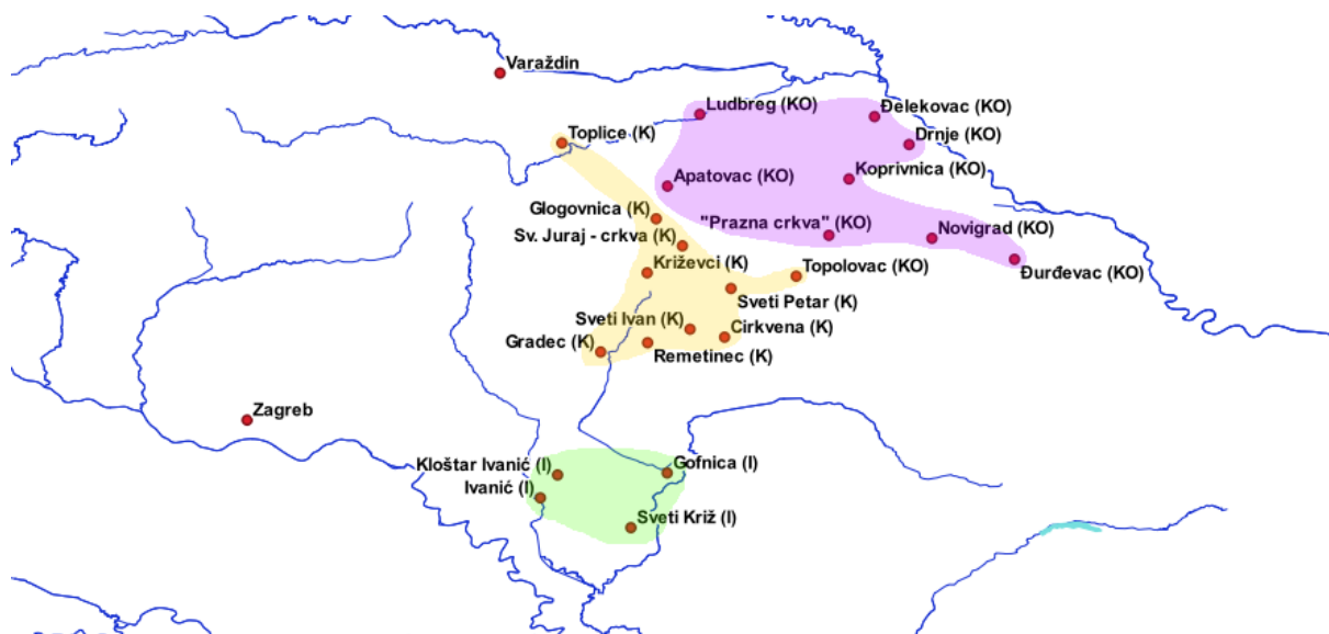
Slika 2. Kapetanije na Slavonskoj krajini 1578. godine (zeleno – Ivanička; žuto – Križevačka; ljubičasto – Koprivnička; Zagreb i Varaždin – izvan kapetanija) (prema: Štefanec 2011, 491-492; izradio: Filip Šimunjak).

kapetanije razvile ranije, najprije u Koprivnici 147 , no uvid u krajiške izvore ipak pokazuje da do 1578. godine na prostoru Slavonije nema jasnog kapetanijskog ustroja. Izostanak organizacije prije svega je posljedica malog broja utvrda do 1578. godine (oko deset, najčešće devet) te malog broja vojnika u utvrdama (1577. godine čak 75.2 % vojnika ne boravi u utvrdama). 148 Jasna podjela uvedena je tek nakon Sabora u Brucku – broj utvrda tada je povećan s devet na 25, a i broj vojnika izvan utvrda je drastično pao (1578. godine svega 17.1 % vojnika ne boravi u utvrdama) te je stoga definiranje nadležnosti postalo nužno.