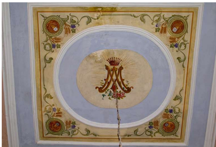
Slika 16: Treći oslik, najbliži oltaru.

Pravokutnik u trećem segmentu stropa, najbližem oltaru, također nosi ovakav floralni okvir, samo što medaljoni sadrže simbolički prikaz Euharistije. U ovalnom, centralnom prikazu ovaj je put Marijin monogram, koji je prikazan sa zrakama svjetlosti, i nadvišen krunom s devet vrhova.