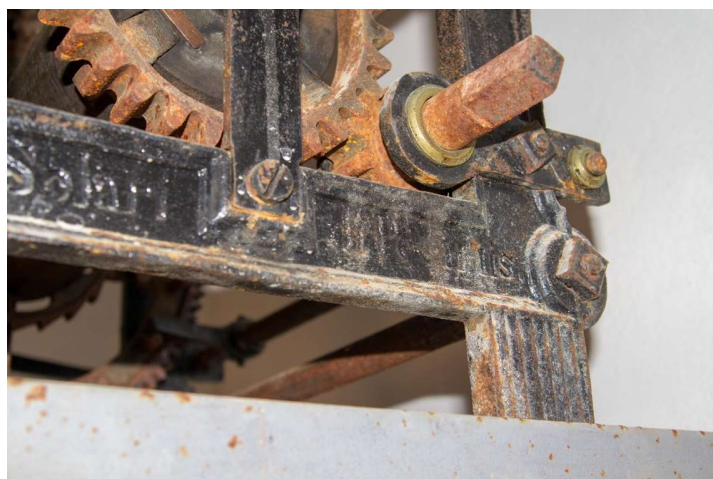
Slika 18: Natpis na satnom mehanizmu. »...Solari di Pesariis«