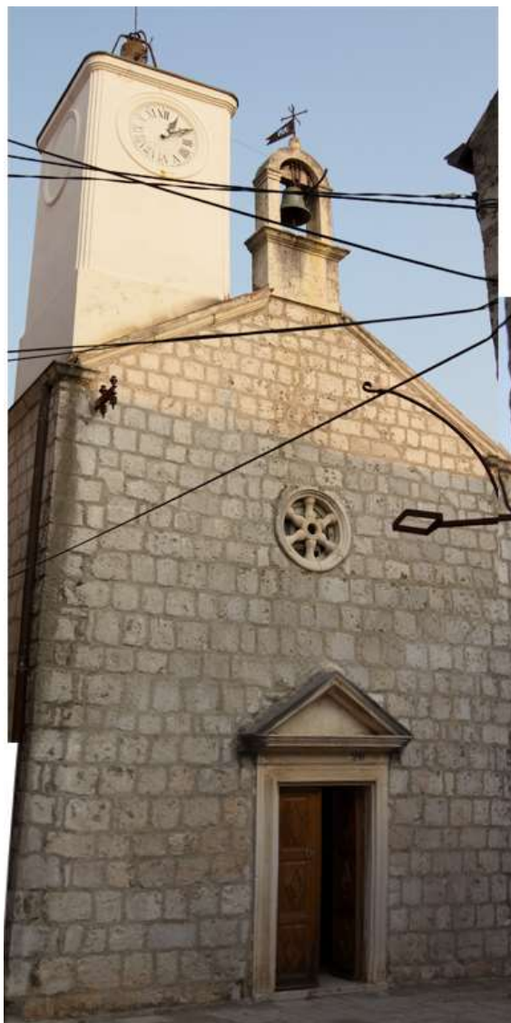
Slika 1: Crkva Gospe od Karmela, Trpanj, pročelje. Crkvu je nemoguće pravilno fotografirati zbog njene pozicije u gustom urbanom tkivu pa je reproducirana kompozitna fotografija Gospe od Karmela, sastavljena od dvije fotografije i stoga samo ilustrativnog karaktera.