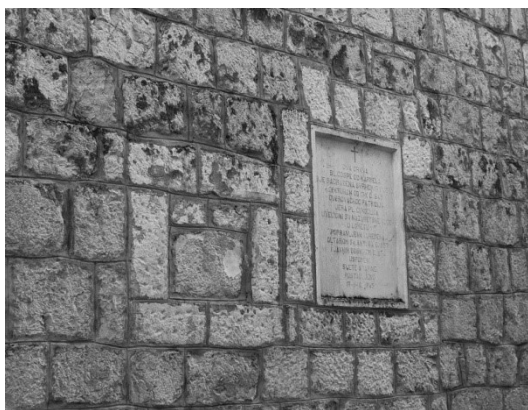
Slika 7: Sjever - zazidani prozor i spomen-ploča.

Lijevo od spomen-ploče, u kamenju zida, nazire se zapečaćeni prozor (slika 7). Identičan zazidani oblik nalazi se na skoro istom mjestu s druge strane crkve, na južnom zidu. Nadalje, desno od spomen-ploče na sjevernom zidu nazire se obrazac u kamenju, koji otkriva da su na tom mjestu nekoć bila vrata, poslije zazidana (slika 8). Na gornjem dijelu zida, jasno je vidljiv isti prekid u ritmu polaganja kamena, kakav je bio spomenut u opisu pročelja (slika 6). To se slaže s informacijom da je u XIX. stoljeću crkva povišena. Polukružni termalni prozori nalaze se iznad te razdjelnice, što znači da su dodani u procesu te nadgradnje. To bi, onda, objasnilo i zazidane prozore, jer više nisu bili potrebni za rasvjetu nutrine liturgijskog prostora. Osim toga, oni su slijedili propisani obrazac otvora na Loretskoj kućici – obrazac koji možda gubi na svojoj važnosti prolaskom mnogih stoljeća, i postaje sekundaran.