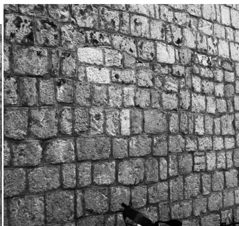
Slika 8: Sjever - zazidana vrata.

Južna strana crkve je slična sjevernoj, ali bez spomen-ploče. Također sadrži dva termalna prozora iznad crte pregradnje, jedan zazidani prozor niže, i nejasnu grupu kamenja koja može upućivati na zazidana vrata. No, na južnoj strani postoji i jedan prozor koji nije zazidan – polukružno zaključen uspravni pravokutnik, koji nosi hrđavu željeznu rešetku, a iznutra stakleni dvokrilni prozor bez dekoracija. Nalazi se u razini očiju, a sudeći po izgledu kamenja oko njega, naknadno je probijen.