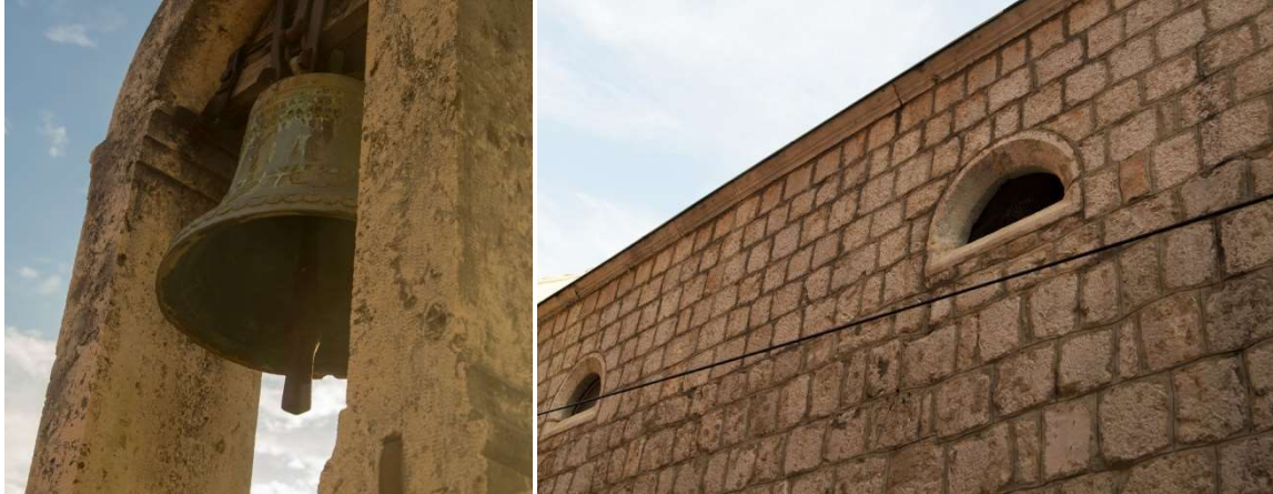
Slika 5: Pročelje - preslica i zvono.