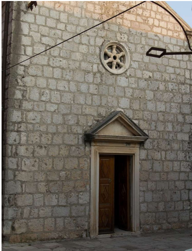
Slika 2: Pročelje Gospe od Karmela u Trpnju.

Crkva Gospe od Karmela nalazi se u staroj jezgri Trpnja. Proporcije su joj određene Svetom kućom u Loretu, no Gospa od Karmela ipak je nešto veća (Loreto: 450 x 940 cm, Trpanj: 630 x 1130 cm). Longitudinalnog je tlocrta, i jednobrodne strukture. Usmjerena je prema istoku. Na tjemenu pročeljnog zabata nosi omanji zvonik (»na preslicu«), a nad krovštem toranj sa satnim mehanizmom.