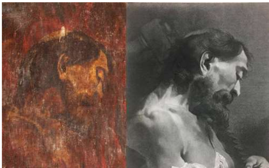
Slika 11: Poredba slike u Gospi od Karmela s Pitterijevim prikazom apostola Šimuna Kananeja (1742.)

za studije glava i polu-figura. 52 Te je glave u grafički medij prenio Marko Alvise Pitteri (Venecija 1702. - Venecija 1786.), a njihov utjecaj zabilježen je u hrvatskoj baštini, pa se ovaj trpanjski prinos uklapa u pregled recepcije Piazzettinih i Pitterijevih modela. Ovaj oltar također trenutno nosi četiri beznačajna svijećnjaka, te lijepo samostojeće drveno raspelo.