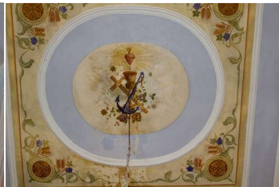
Slika 15: Drugi, središnji oslik. N.P.

Središnji oslik sadrži simboličku sliku zlatnog kaleža, nad kojim krvari srce Isusovo. Preko kaleža, križaju se dva simbola – drveno raspelo, i brodsko sidro. Nad prikazom križa