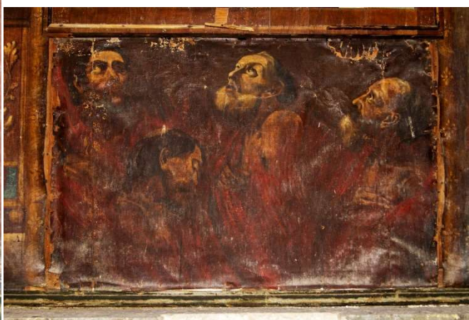
Slika 10: Duše u čistilištu.

Na predeli su prikazane duše u Čistilištu, i to znatno vrsnije slikane. Na ovoj slici moguće je utvrditi predloške za pojedina poprsja čistilišnih stanovnika, jer se radi o često prenošenim obrascima mletačkog slikara Giovannija Battiste Piazzette (Venecija 1683. - Venecija 1754.). Piazzetta, inače cijenjeni venecijanski tenebroso majstor, i prvi ravnatelj tamošnje Likovne akademije, razvio je u dvadesetim godinama XVIII. stoljeća velik interes