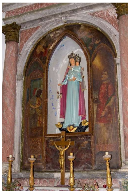
Slika 9: Glavni oltar.

niša s vanjske strane istočnog zida možda je povezana s ovim promjenama, odnosno sa stvaranjem niše u liturgijskom prostoru. Bogorodica i Dijete odjeveni su, i okrunjeni. Slike lijevo i desno od niše oslikao je Franjo Kaer, 49 s namjerom da oslika sv. Šimuna Stocka kako prima škapular od Gospe od Karmela. Ikonografskom zabunom, na slici lijevo slučajno je izveden sv. Ivan od Mathe, 50 sudeći po njegovoj odjeći. 51 Objavljenu pretpostavku o ikonografskoj zabuni treba uzeti s oprezom, jer desna slika ikonografski točno opisuje sv. Stjepana Prvomučenika.