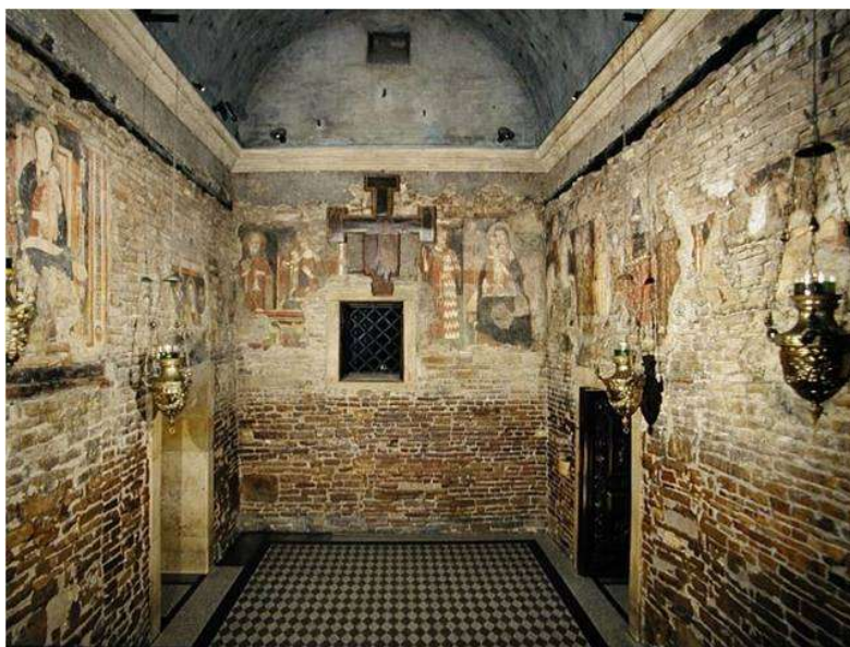
Slika 19: Zapadni dio unutrašnjosti Loretske kućice. 65

Na priloženom tlocrtu Svete kućice, mogu se uočiti i jedna sporedna vrata na južnom zidu. Ta vrata mogla bi se povezati s prozorom, koji se nalazi na istom mjestu na Gospi od Karmela. Time, to bi bila zadnja preostala poveznica Gospe od Karmela s Loretskom kućicom, osim »svetih dimenzija«. Zapadni zid Svete kućice nosi pravokutni prozor, no na zapadnom zidu Gospe od Karmela danas je portal. Doduše, nije nemoguće zamisliti da je ondje nekoć bio sličan prozor, te da se u crkvu ulazilo s bočne strane.