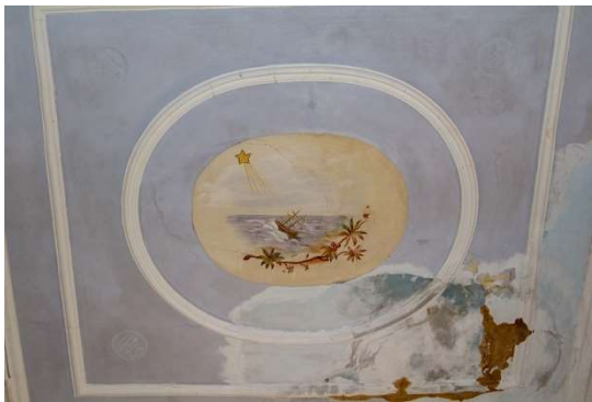
Slika 14: Prvi oslik, najbliži ulazu. N.P.

Prvi oslik, najbliži ulazu, prikazuje brod na pučini, ponad kojeg se nalazi žuta peterokraka zvijezda iz koje izlazi snop svjetlosti prema brodu. Oslik je dodatno ukrašen floralnim motivom u donjem desnom kutu. Ovaj prikaz zasigurno prenosi poruku zaštite moreplovaca, vjerojatno sugerirajući na Marijinu zaštitu kao Zvijezde mora (lat. Stella maris ). Ostatak pravokutnika je prazan, obojen blagom modrom bojom, a u kutovima se jedva nazire zaokruženi Kristov monogram. Ovaj segment stropa u najlošijem je konzervatorskom stanju, s vidljivim propadanjem radi vlage. Razlog tome je pozicija ovog dijela stropa ispod zvonika, čime je vjerojatno više izložen atmosferijama.