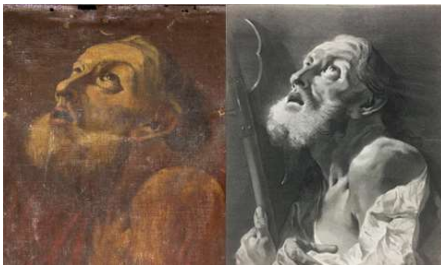
Slika 12: Poredba slike u Gospi od Karmela s Pitterijevim prikazom apostola Bartolomeja (1742.)