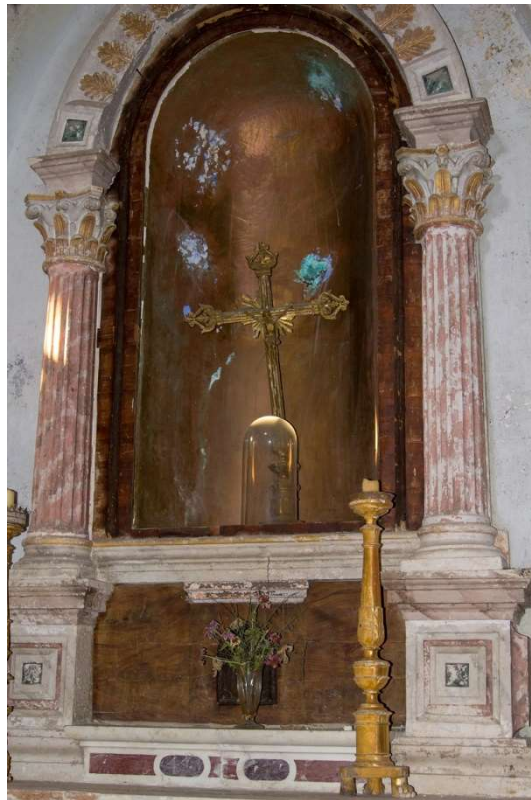
Slika 13: Bočni oltar sv. Antuna.

Bočni oltar sv. Antuna 53 , smješten je uz sjeverni zid. Također nosi jasne značajke arhitektonski zasnovanog oltara, premda je manje monumentalan. Opet je bojama postignut dojam strukturalne polikromije, te je na središtu stipesa urezan ukrasni medaljon (ovaj put s prikazom floralnih motiva, i grčkog križa izvedenog od cvijeća). Nad stipesom, uzdižu se kanelirani korintski stupovi zaključeni polukružnim lukom, čime je omeđena prazna niša. Njena je izvorna namjena nepoznata, no vrlo je vjerojatno držala nekakvu skulpturu, možda sv. Antuna Padovanskog. Trenutno je ondje odloženo jedno obojeno drveno raspelo. Ovaj je oltar bio prenesen iz stare crkve sv. Petra 1857. godine, nakon što je dovršena restauracija Gospe od Karmela. 54