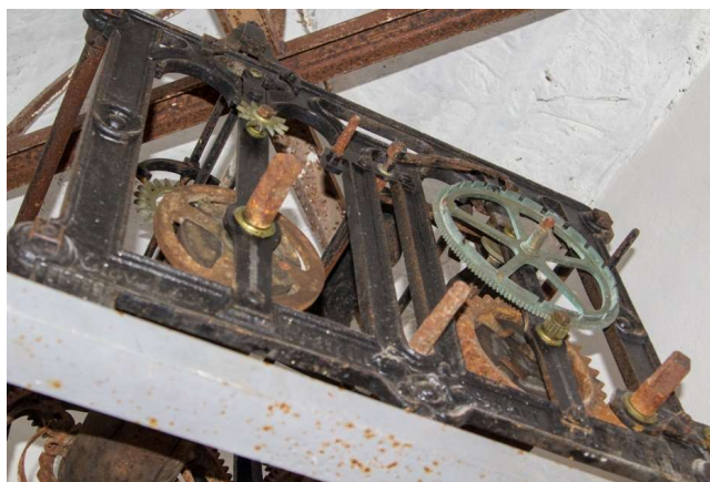
Slika 17: Satni mehanizam u zvoniku Gospe od Karmela.

Satni mehanizam trenutno nije u funkciji, ali doima se očuvanim, premda podliježe hrđi. Natpis na kućištu svjedoči o podrijetlu izrade, te usprkos jednoj nečitljivoj riječi, jasno predstavlja sat kao proizvod braće Solari. Naime, piše na kućištu ovako: »Giov(...) Fratelli Solari di Pesariis«