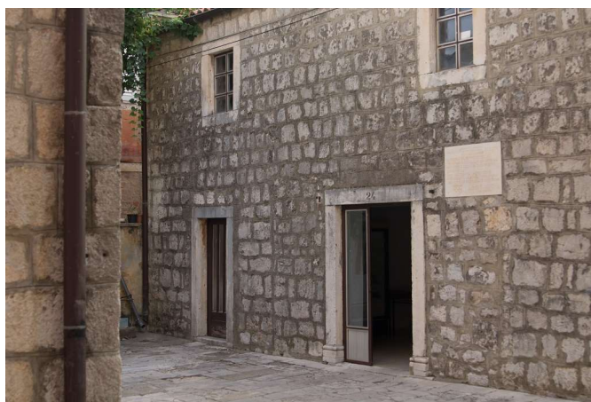
Slika 4: Bivša zgrada kapelanije, sada izložbeni prostor umjetničke galerije.

Kako smo napomenuli u opisu urbanističke situacije, nasuprot crkve Gospe od Karmela u Trpnju, nalazi se zgrada bivše kapelanije. Sagrađena je svega nekoliko godina nakon što je dovršena crkva, kako bi poslužila kao stan za kapelana, a podigle su ju (donosi F. Glavina) obitelji Barbica, Vlahović i Senko, koje su živjele u blizini. Prvi put se spominje u svibnju 1687. godine, tako da je tada očito već bila dovršena. Zadnji kapelan koji je živio u njoj, bio je don Ivan Klarić, koji se iz nje iseljava 1813. godine s dolaskom Francuza u Trpanj. Spominje se u zemljišniku 1841. godine, gdje je upisana na Antu Kunića. 45