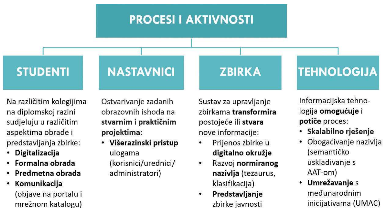
Slika 5. Model uključivanja studenata u obradu sveučilišne zbirke dijapozitiva Ive Maroevića primjenom rada mnoštva u obrazovnom okružju

tenzivnu primjenu računalnih alata i tehnologija: informacijski sustav za upravljanje zbirka, semantičke tehnologije, javni portal i mrežni katalog zbirke):