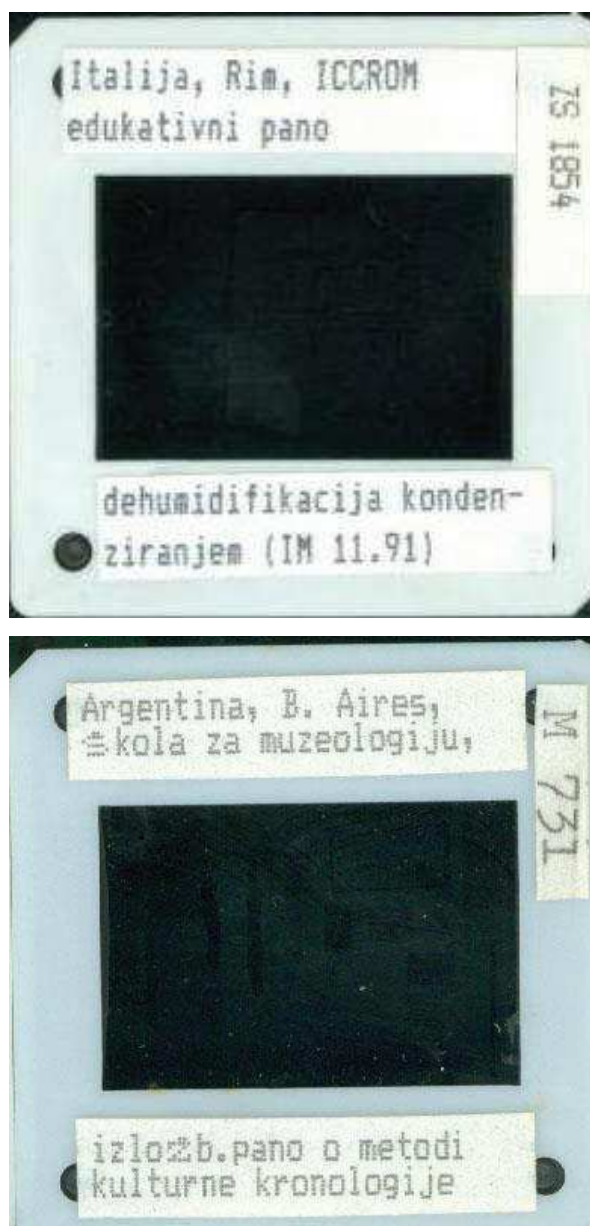
Slika 3. Primjer dijapozitiva opremljenih naljepnicama s inventarnim oznakama i ključnim podacima

Važna je posebnost Zbirke Maroević ta što je njezin stvaratelj ostavio opsežnu i