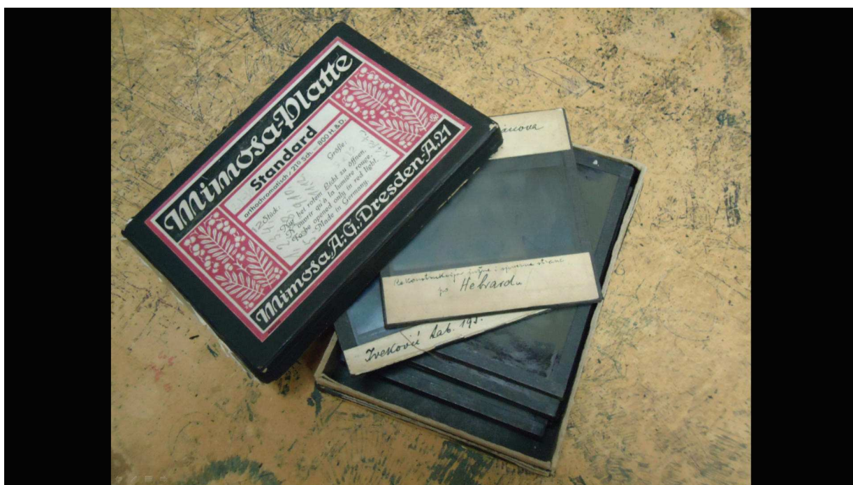
Slika 2. Kutijica s najstarijim dijapozitivima Zbirke na staklenim pločama

ner Berlin (Wissenschaftlichen Projektion und Stereoskop) . Istoimeni berlinski povjesničar umjetnosti bio je pionir dokumentacijske fotografije i u Berlinu je 1895. godine osnovao Institut za znanstveno projiciranje, prvo poduzeće za proizvodnju projekcijskih nastavnih pomagala. Njegov je profesor bio Herman Grimms koji je prvi uveo upotrebu dijapozitiva u nastavi na berlinskom sveučilištu. Znajući kako je I. Kršnjavi predavao kolegij Povijest umjetnosti i kulture sve do umirovljenja 1918. godine, moguće je da su ovi dijapozitivi nabavljeni njegovim naporom. Naime, Olga Maruševski u Radovima Odsjeka za povijest umjetnosti br. 7, posvećenim stotoj godini osnutka, donosi prijepis dokumenta u kojemu Kršnjavi za osnutak Seminara za povijest umjetnosti moli Odjel za bogoštovlje i nastavu, među ostalim, i 450 kruna za nabavu petsto dijapozitiva (talijanska renesansa). Tri navedene ploče mogle bi, dakle, biti dio planirane nabave.