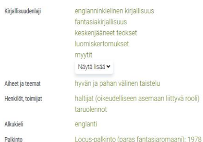
Slika 2 Kirjasampo- interaktivna web usluga za ficiju 1. dio 35

Tilaa Kirjasammon ja Kirjastokaistan kirjallisuuskirje