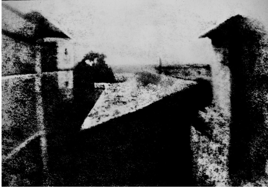
Slika 2. Nicéphore Niépce: „Pogled s prozora u Le Gras“, prva fotografija

obrnuto na premazanu površinu lima. Odstranjivanje topljivog asfalta, jetkanje tih mjesta do glatkog metala te slijevanje tiskarske boje na kraju dovode do cjelovitog postupka nazvanog „heliogravuram“ i ujedno nastanka prve fotografije. (Mušnjak, 1988, str. 328)