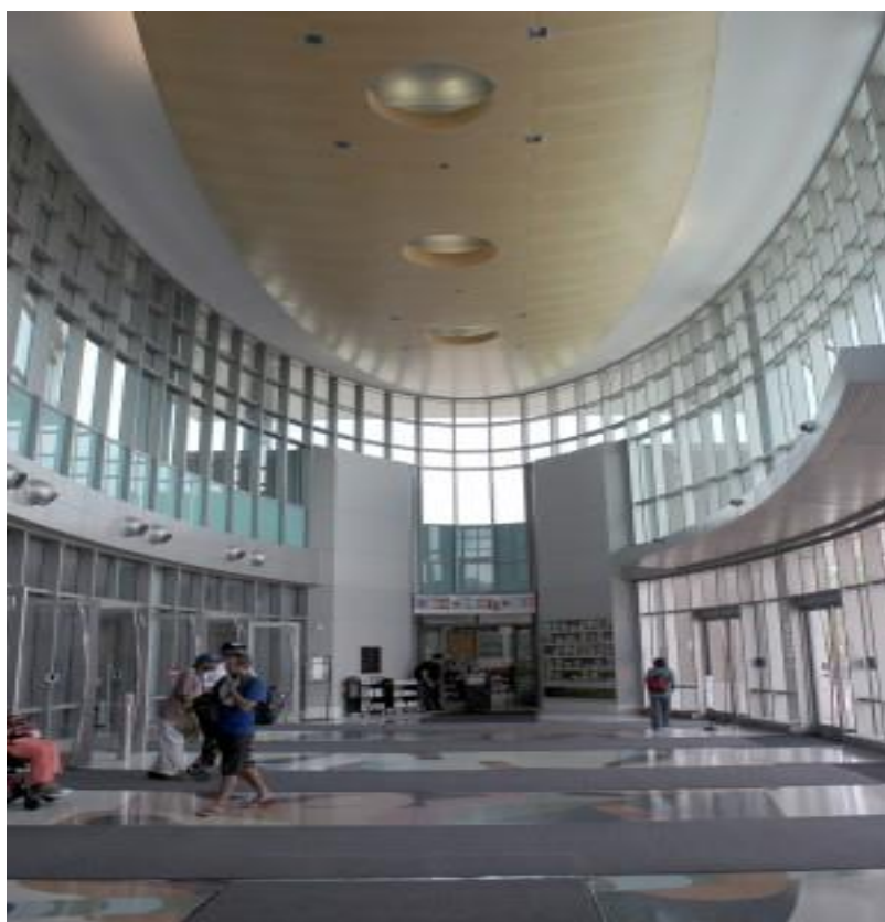
Slika 8: Narodna knjižnica i informacijski centar Memphis, Tennessee