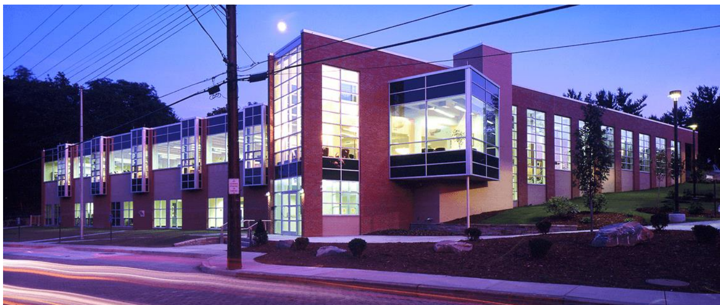
Slika 7: Narodna knjižnica Mt. Lebanon, Pennsylvania