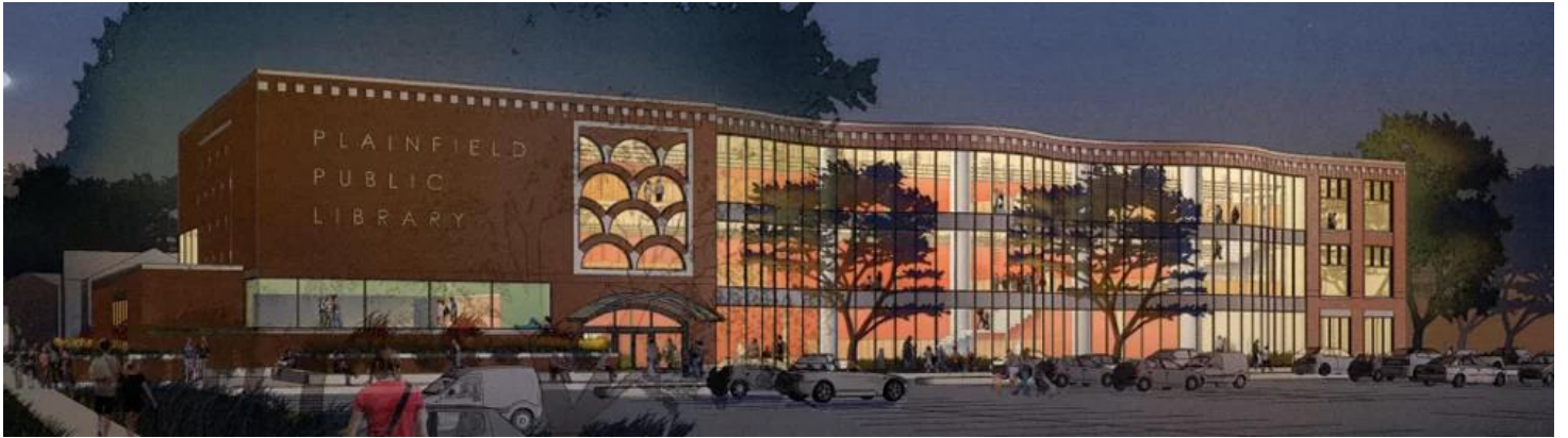
Slika 9: Narodna knjižnica Plainfield, Illinois