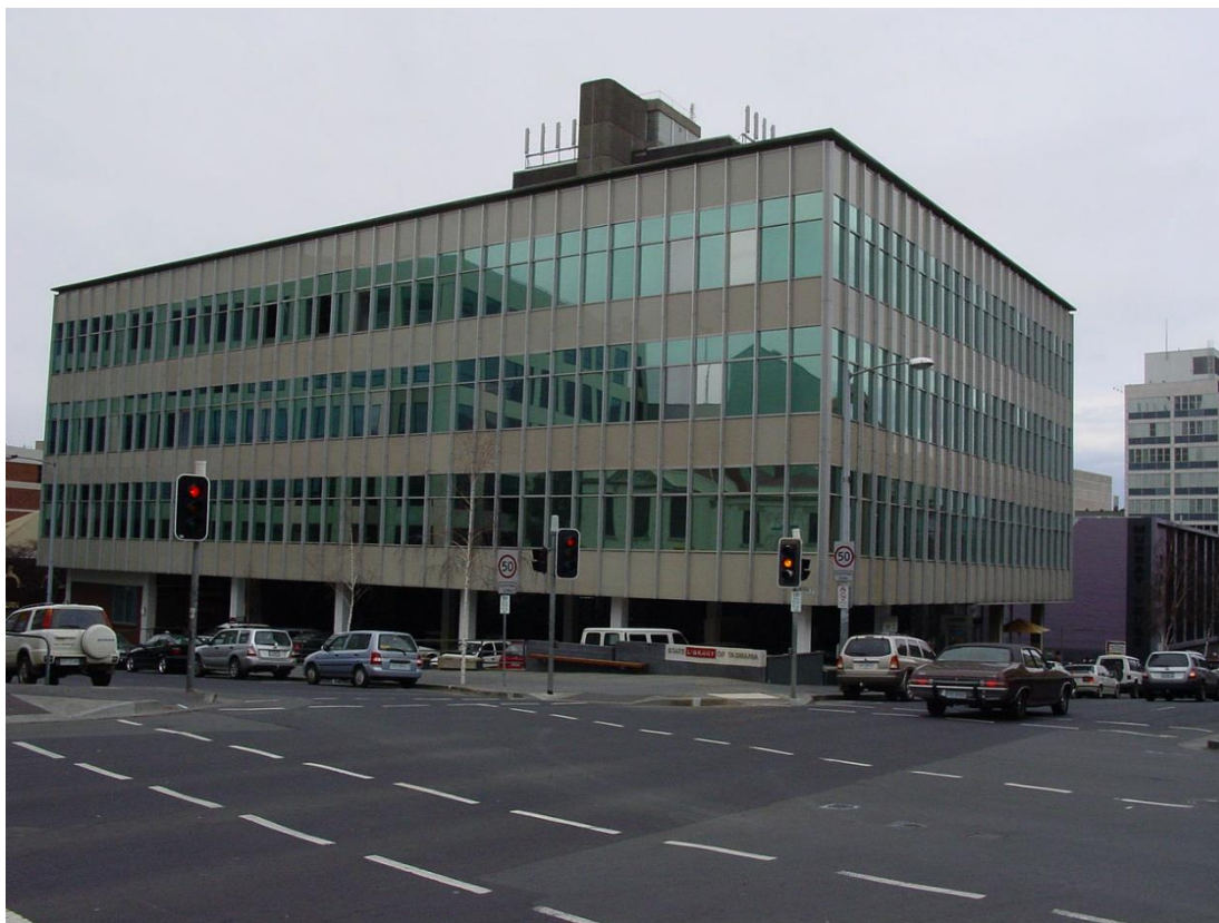
Slika 1: Državna knjižnice Tasmanije (State Library of Tasmania)

Volonterske poslove slične Knjižnici u Tasmaniji na svojim internet stranicama nude i Narodne knjižnice Brooklyn (Brooklyn Public Library) i Narodne knjižnice u Los Angelesu (Los Angeles Public Library). Prva spomenuta knjižnica u svojoj ponudi nudi „program učenja računalnih vještina Danas mladi, sutra učitelji, namijenjen mladima od 14 do 18 godina u trajanju od dva tjedna, nakon čega se polaznici tečaja uključuju u pomoć korisnicima knjižnice. U drugoj spomenutoj knjižnici, volonteri, između ostaloga, sudjeluju i vode kulturne i obrazovne programe kao što su dječji festivali, čitanje poezije, rasprave s autorima knjiga i razna predavanja.“ 131