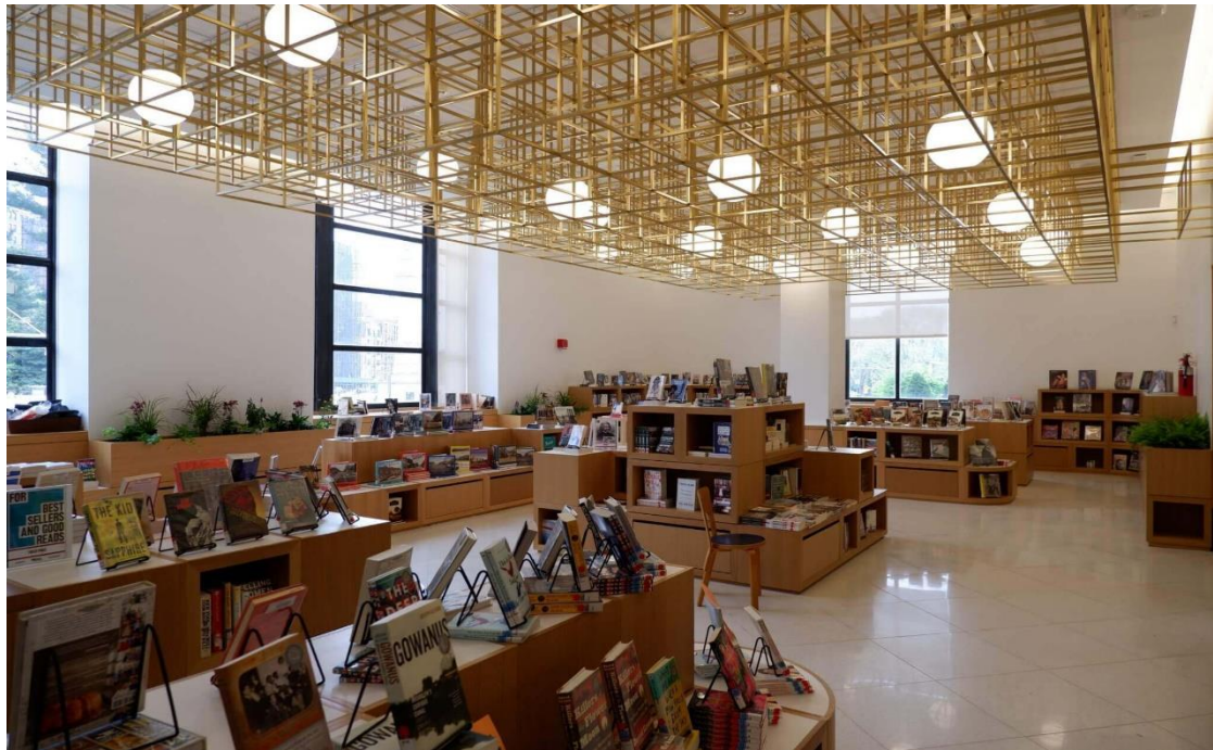
Slika 2: Narodna knjižnica Brooklyn (Brooklyn Public Library)