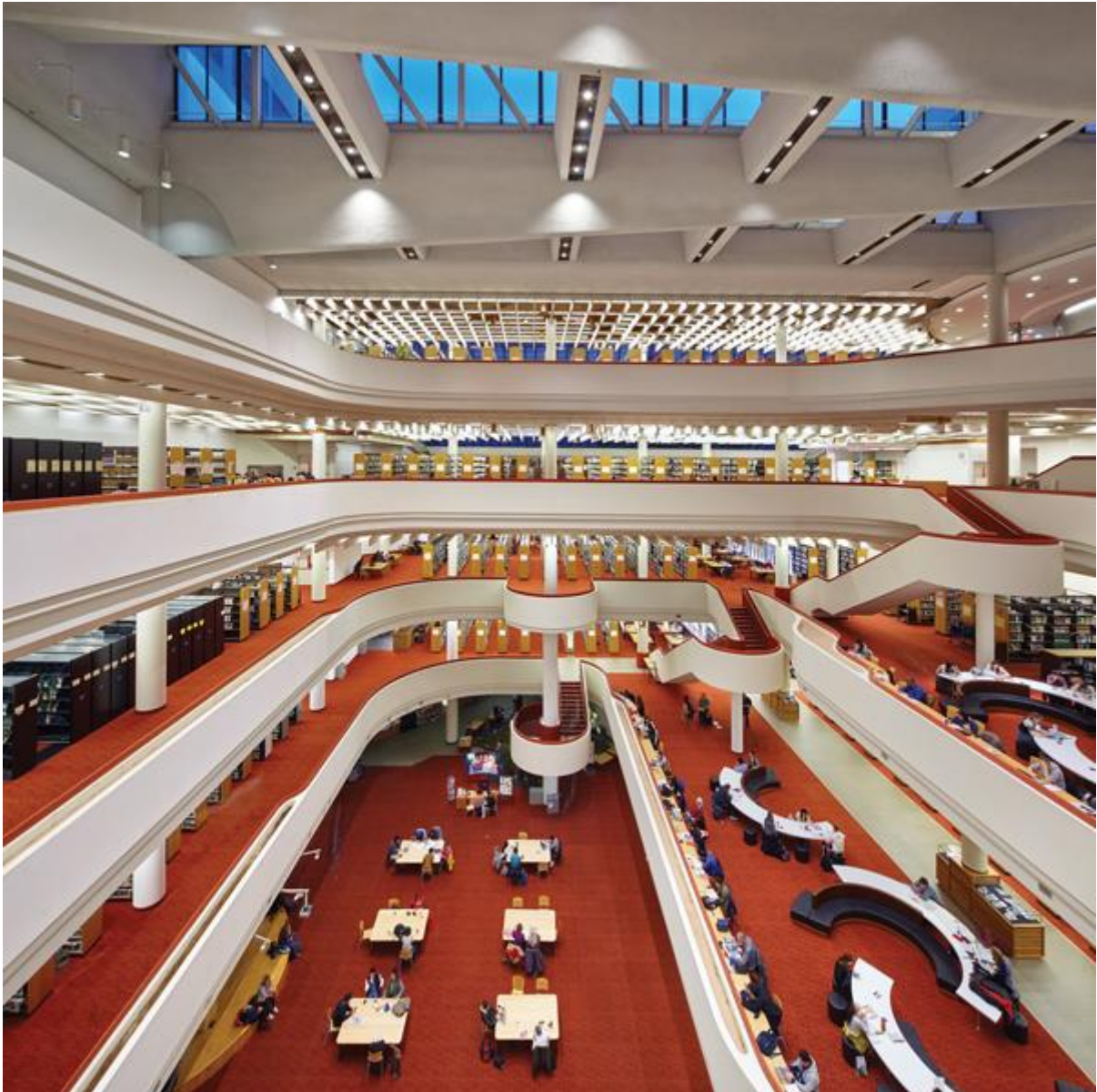
Slika 5: Narodna knjižnica Toronto (Toronto Public Library)