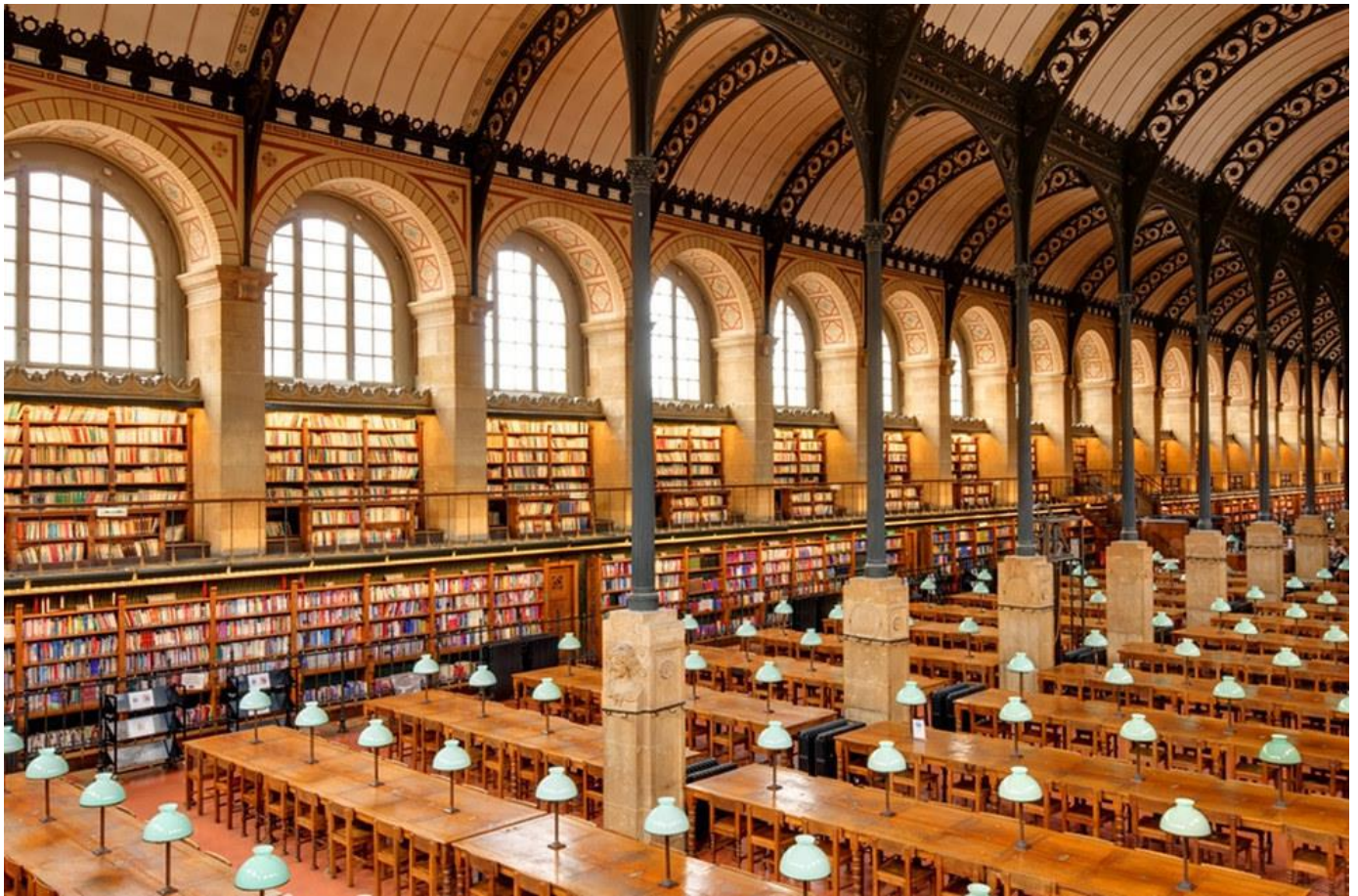
Slika 4: Knjižnica Sainte-Geneviève, Pariz, Francuska