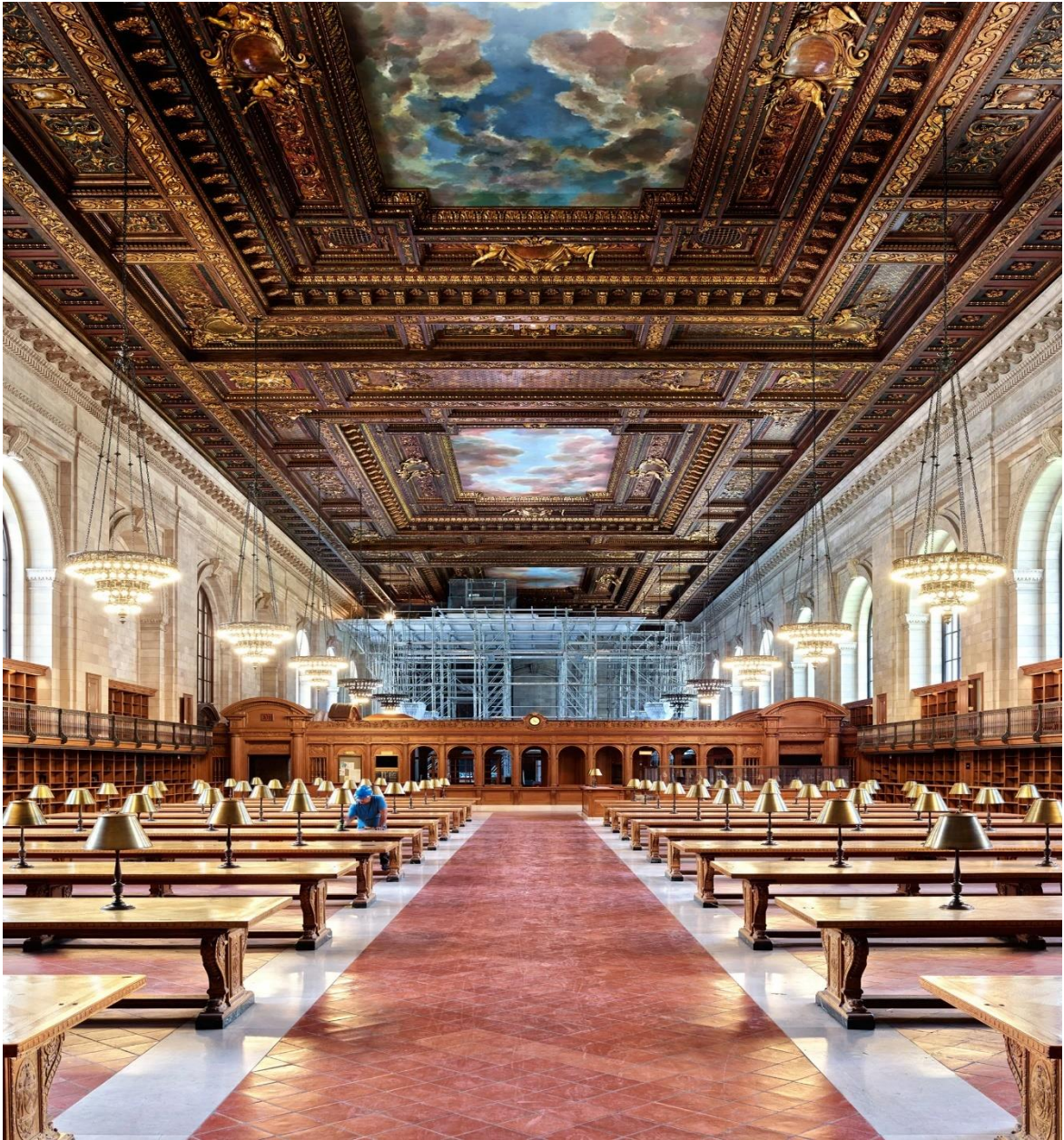
Slika 6: Narodna knjižnica New York (New York Public Library)