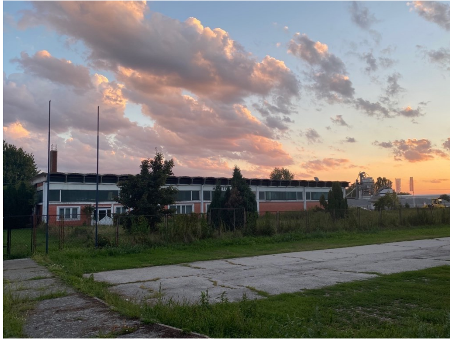
Slika 21. Bertolan d.o.o. u nekadašnjem skladištu Kristala , 2022.