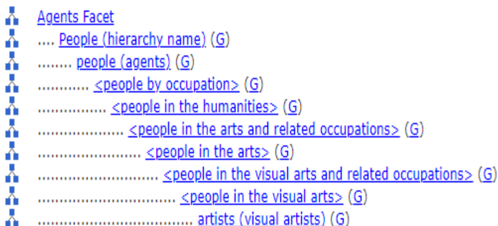
Slika 3. Primjer fasete s hijerarhijom za pojam “ artists (visual artists) ”. www.getty.edu . (n.d.). Art & Architecture Thesaurus Full Record Display (Getty Research). Dostupno na: http://vocab.getty.edu/page/aat/300025103 (Pristupljeno 15.08.2022.)