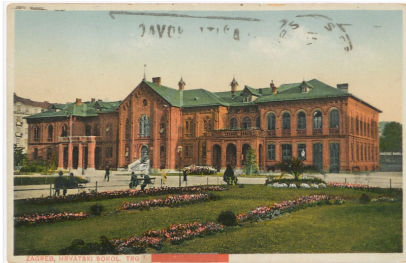
Slika 2: Zagreb: Hrvatski sokol.

Wikipediji. Kada bi ulazni tekst glasio Zagreb: ZTD Hrvatski sokol, jedina razlika u izlaznim podacima bi bila zamjena Hrvatski sokol (organizacija) za ZTD Hrvatski sokol (gimnastičarski klub).