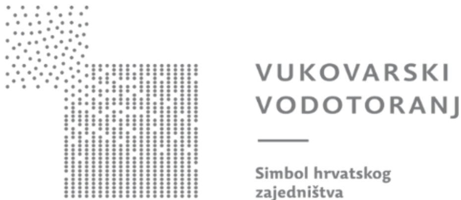
Slika 1: Vukovarski vodotoranj – simbol hrvatskog zajedništva

Što se tiče same konstrukcijske obnove vodotoranja, ideja je bila obnoviti samo ono nužno za ostvarivanje mogućnosti sigurnog kretanja unutar vodotoranja, a u isto vrijeme promatrajući svaku rupu i oštećenje koju su projektili uzrokovali. Zagrebačka Radionica arhitekture već je i prije sudjelovala u projektiranju Muzeja vučedolske kulture i obnovi Dvorca Eltz te joj je povjeren i ovaj zadatak na Vukovarskom vodotoranju. (Pintarić, 2020.)