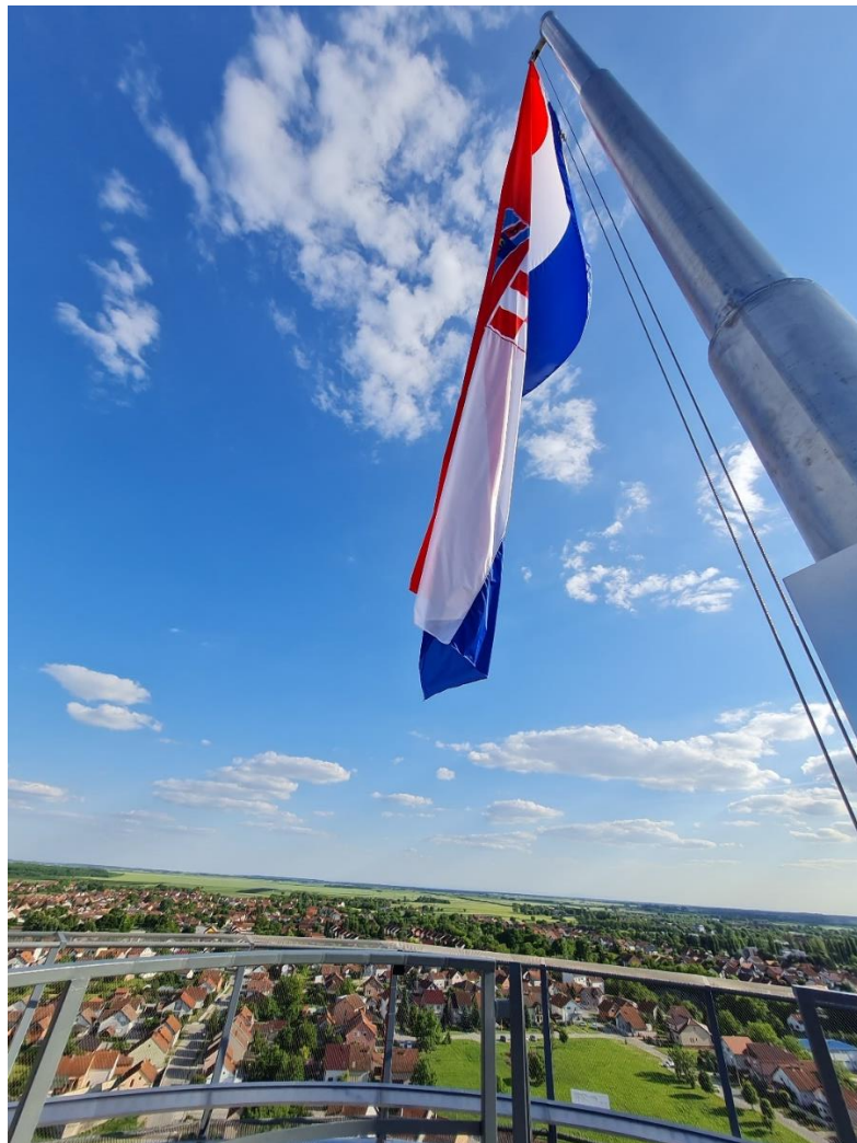
Slika 10: Zastava na vrhu vidikovca

Nakon napuštanja memorijalne sobe i izlaženja na vidikovac posjetitelji se možda neće susresti s elementima s kojima će nužno ostvariti intimni susret, ali emocionalnog doživljaja neće nedostajati. Osim samog pogleda koji nema kraja, put prema vrhu vodotornja do zastave te stajanje ispod nje kraj otiska čizama kreira osjećaj određenog dodira s prošlošću. Stoga, iako se u tom trenu možda ne osjeti poistovjećivanje ili empatija, zasigurno se osjeća zahvalnost i pripadnost unutar zajedništva. (Slika 10)