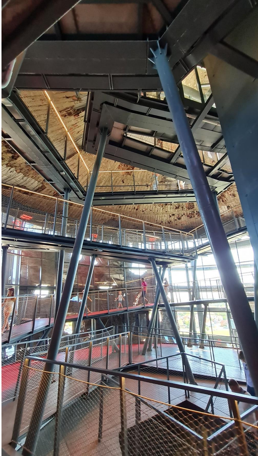
Slika 8: Memorijalna staza