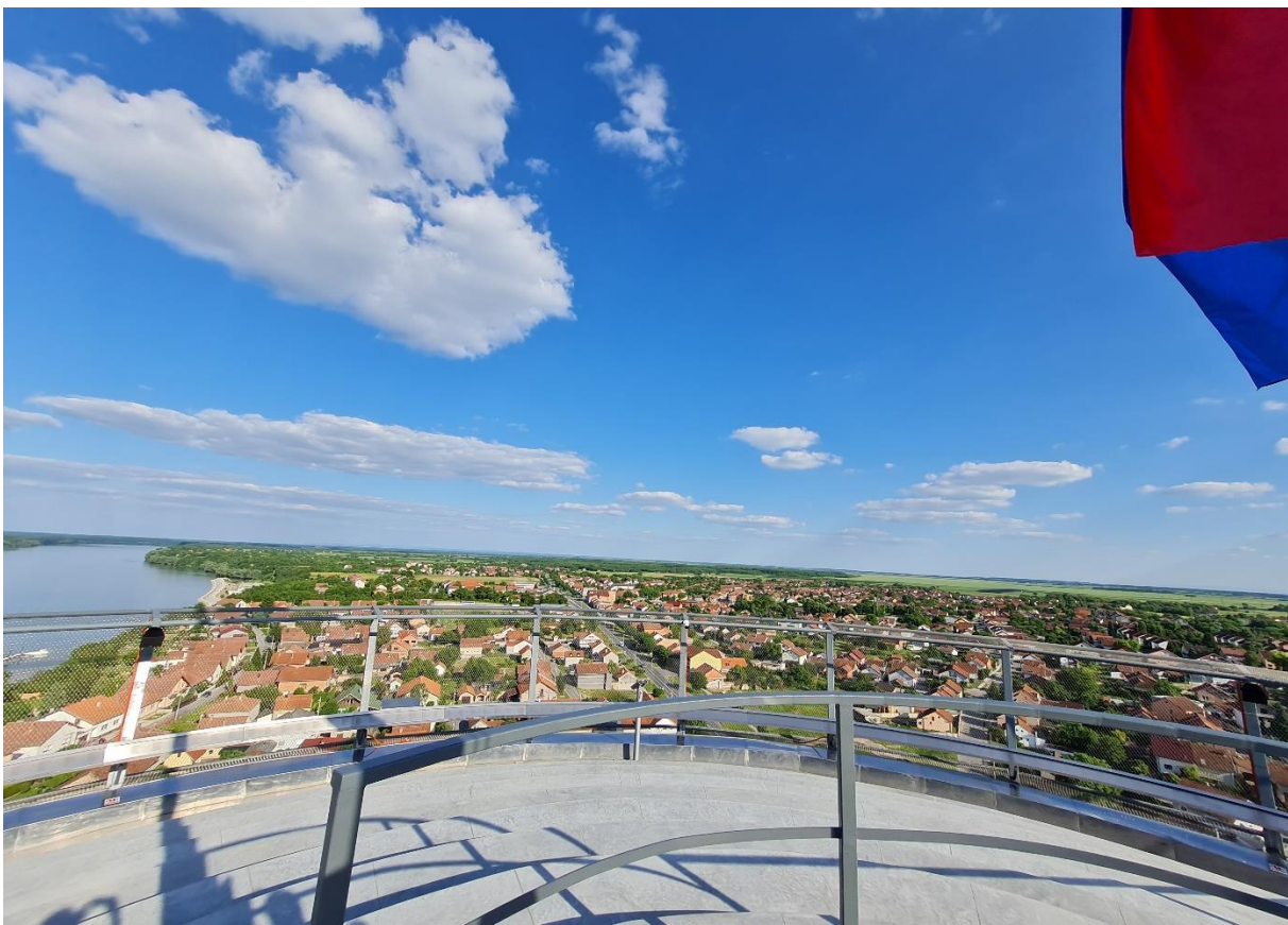
Slika 9: Pogled s vidikovca