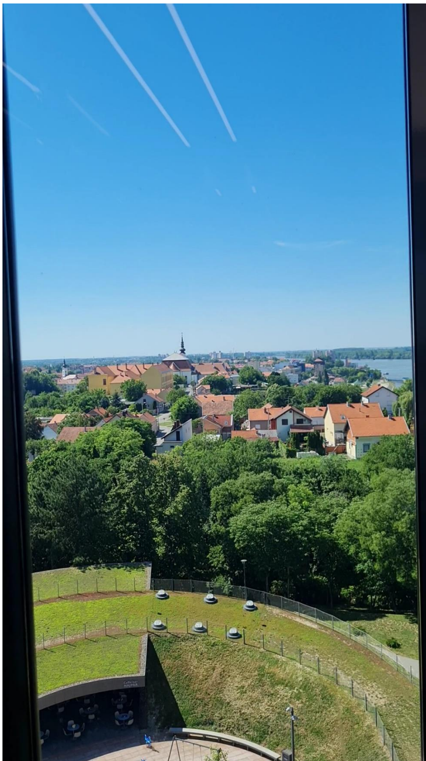
Slika 2: Panoramski pogled na grad iz dizala