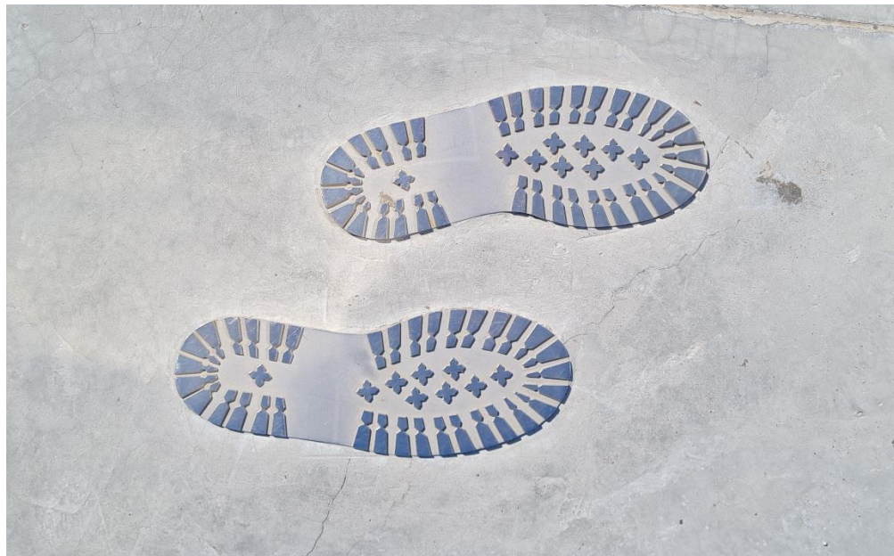
Slika 3: Otisak vojnih čizmi