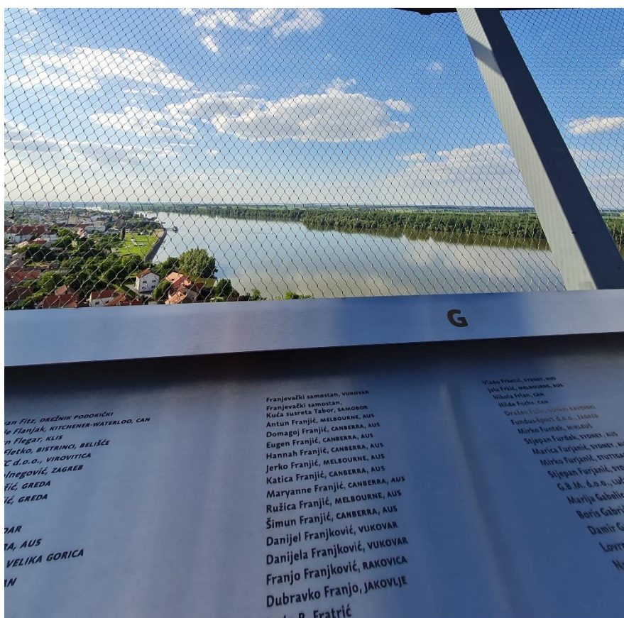
Slika 6: Popis donatora

Još jedan primjer ovakve strukture nalazi se također između unutarnjeg i vanjskog elementa. Četvrti ekran predstavlja videozapis pod nazivom „Homage braniteljima“ tijekom kojeg se prikazuje slideshow fotografija branitelja, kako individualnih tako i u zajednici te se na kraju navode neka od njihovih imena. Ovdje se može povući linija sa 6989 imena donatora ispisanih na metalnim pločama na vidikovcu. (Slika 6) Time se ne povlači samo paralela između prošle i sadašnje stvarnosti već i između samih ljudi koji se unutar svog vremena i svojih mogućnosti trude pomoći vodotornju i baštini općenito.