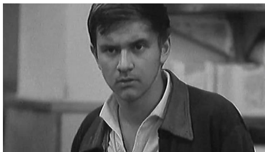
slika br.3 Crni Petar