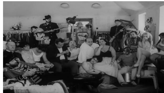
Slika br. 8 Svećenikov kraj