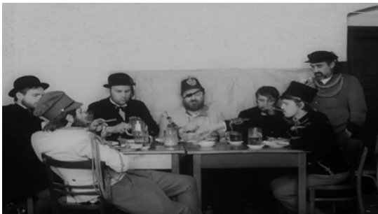
Slika br. 7 Svećenikov kraj

Prvi Paskaljevićev film, Čuvar plaže u zimskom periodu , u mnogočemu je sličan Varljivom letu , ali i filmovima čeških autora. Također se bavi seksualnim sazrijevanjem glavnog lika, ali ono što je zanimljivije i što ga spaja s češkim novim valom je upotreba tabloa . Naravno, tablo nije svojstven isključivo češkoj novovalnoj kinematografiji, ali s obzirom na način kojim su kadrovi konstruirani i na njihovu kompoziciju, možemo Paskaljevićev film povezati s češkim autorima Schormom i Menzelom.