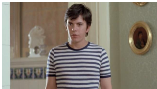
slika br. 4 Varljivo leto '68.