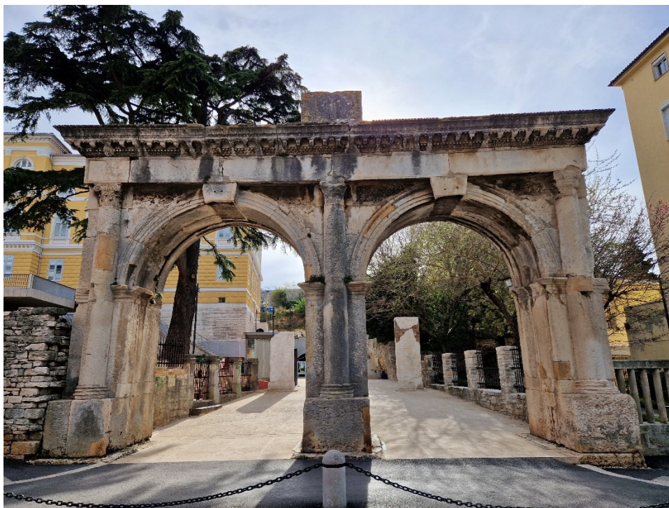
Slika 5: Dvojna vrata