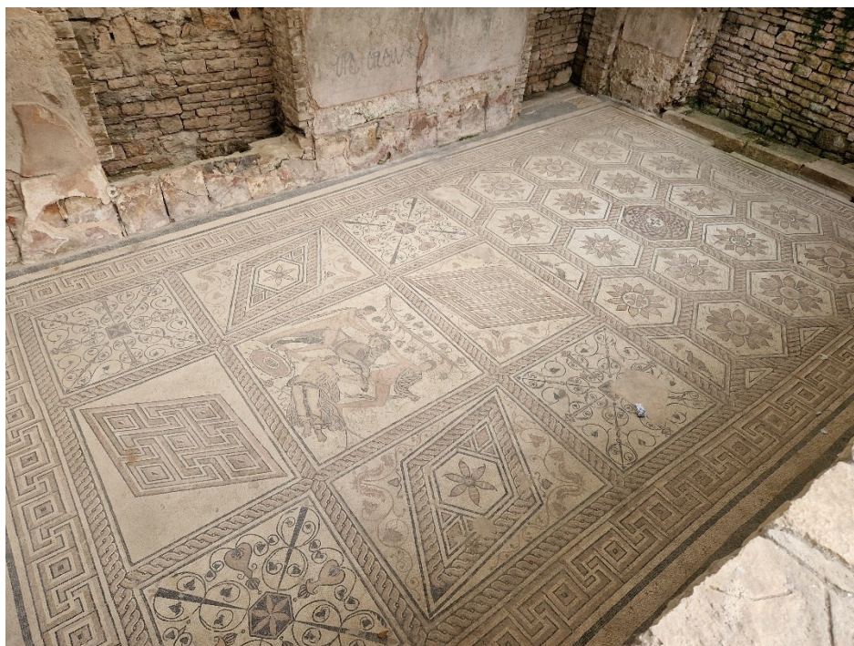
Slika 7: Mozaik kažnjavanja Dirke

Mozaik kažnjavanja Dirke otkriven je prilikom građevinskih radova 1958. godine (Gobić-Bravar, 2013: 48). Pronađeni su ostaci antičke građevine unutar koje se nalazio mozaik i freske (Slika 7). Mozaik zauzima površinu od oko 65 m 2 i nekada se prostirao duž čitave prostorije. Centralni dio mozaika prikazuje dva muškarca koji drže bika za rogove, a pored njih je žena. Scena predstavlja popularnu antičku mitološku priču o Amfionu i Zetu koji vezuju Dirku za rogove bika (Girardi Jurkić, 2011: 85). Priča o Dirki često je uprizoravana u amfiteatrima što bi moglo objasniti zašto je upravo ovdje, nedaleko amfiteatra, napravljen mozaik s tim prikazom (Klarić, 2021: 78). Kako je to najupečatljiviji prizor po toj je sceni mozaik i dobio ime. Oblici koji prevladavaju su trokuti, trapezi i šesterokuti, a osim motiva kažnjavanja Dirke prisutni su biljni i životinjski motivi. U trokutastim poljima su prikazane ribe, ptice i dupini, a šesterokutna polja krasi rozete koje su obrubljene motivom pletera (Gobić-Bravar, 2013: 49). Nalazi se u nekadašnjoj Ulici 1. maja, a današnjoj Ulici Sergijevaca, no njegova prezentacija je prilično oskudna pa se tako događa da posjetitelji teško pronađu lokaciju mozaika, iako se nalazi u jednoj od glavnih i najposjećenijih turističkih ulica u Puli. Osim kroz Ulicu Sergijevaca, do mozaika se može doći i sa stražnje strane koja se nalazi pokraj kapele sv. Marije Formoze.