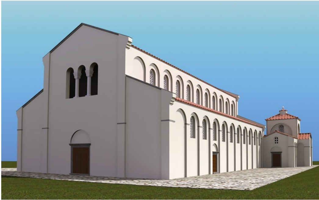
Slika 16: 3D vizualizacija bazilike Sv. Marije Formoze nakon provedbe idejnog projekta