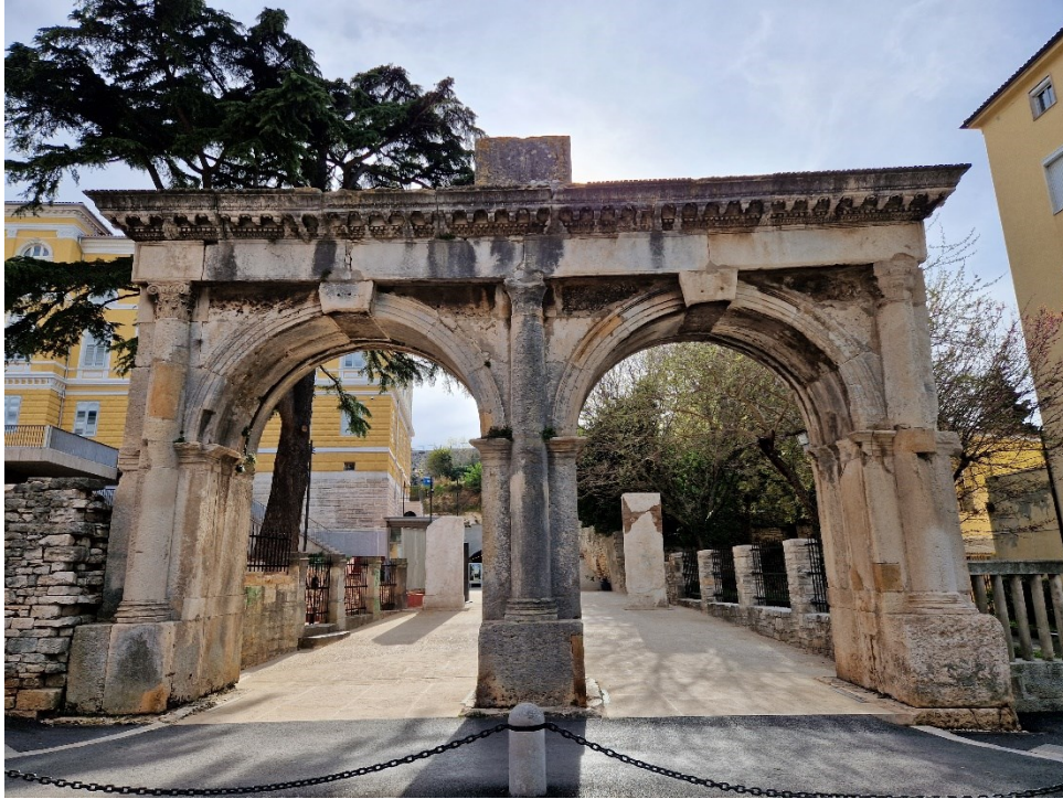
Slika 5: Dvojna vrata