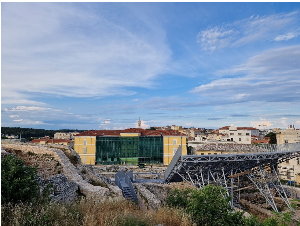
Slika 12: Stražnja strana Arheološkog muzeja Istre nakon renovacije