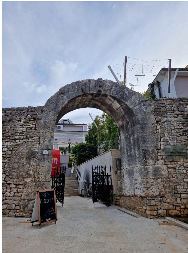
Slika 4: Herkulova vrata

stoljeću koji je glasio Colonia Iulia Pola Pollentia Herculanea . Nekada su vrata vodila iz grada prema plodnim poljima, a moguće da su vodila i prema cesti za Nezakcij (Matijašić, 2005: 7). Danas vode u prostore Zajednice Talijana u Puli.