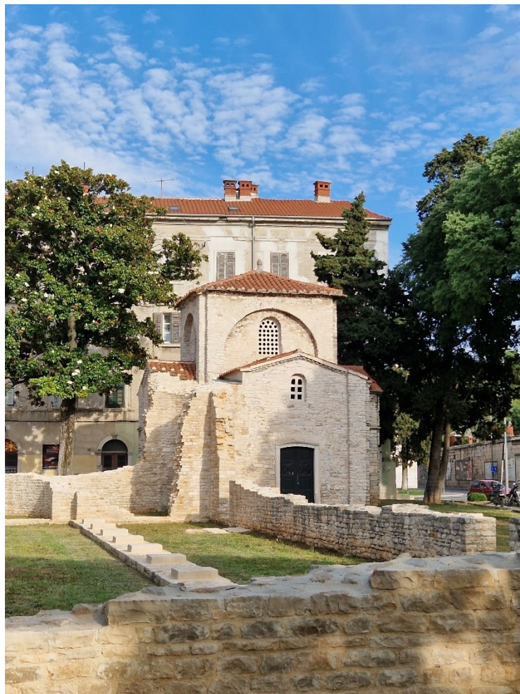
Slika 10: Kapela sv. Marije Formoze

Predstavljen je idejni projekt čiji je cilj stvaranje arheološkog parka i predstavljanje arhitektonskog kompleksa bazilike in situ. Plan je rekonstrukcija čitave bazilike čime bi se predstavilo nekadašnju monumentalnost zdanja i otvaranje parka za posjetitelje ( http://www.ami-pula.hr/projekti/bazilika/ ).