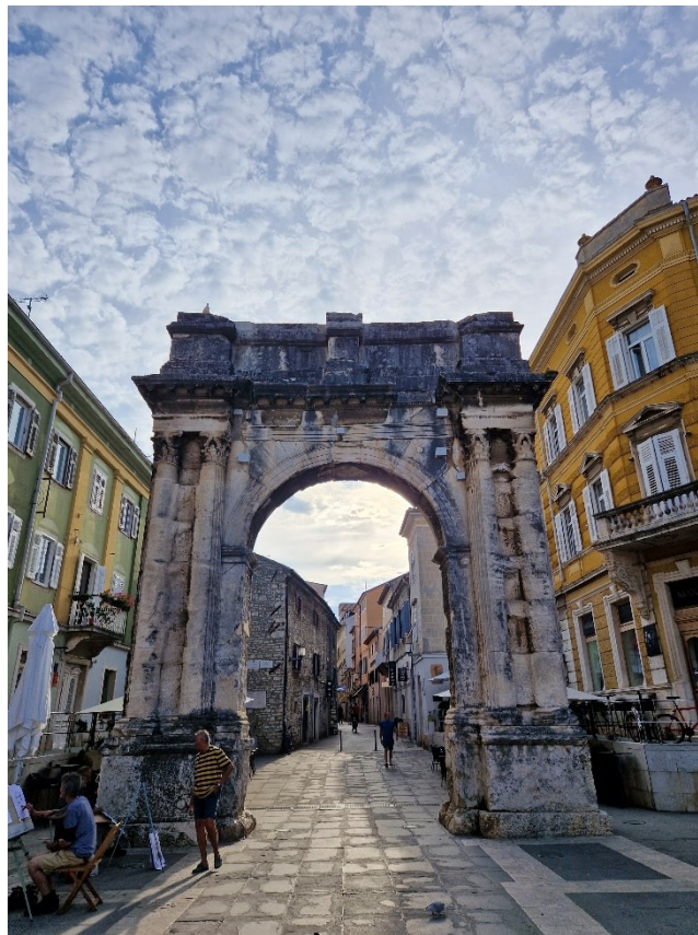
Slika 3: Slavoluk Sergijevaca

luka prikazana je vinova loza s grožđem i motivi rozete. Osim vegetabilnih motiva prisutni su i zoomorfni pa je tako na luku istaknut orao u borbi sa zmijom, grifoni, sfinge i dupini (Mlakar, 1958: 32). Jedan od istaknutijih prizora koji se nalaze odmah iznad luka su dva prikaza krilate božice Viktorije koje nose lovorov vijenac u rukama i simetrično su smještene na lijevu i desnu stranu luka (Matijašić, 1996: 113). Na frizu iznad prikaza božica nalazi se natpis koji spominje Salviu Postumu, a sa strana su prikazani ratnički motivi (Matijašić, 1996: 113). Prostor oko Slavoluka redovito je mjesto održavanja koncerata, nastupa i ostalih događaja.