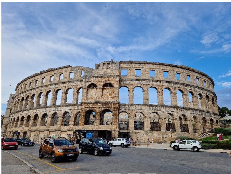
Slika 1: Pulski amfiteatar

Danas amfiteatar služi za održavanje raznih manifestacija od kojih je svakako najpoznatiji Filmski festival koji se održava od 1954. godine ( https://pulafilmfestival.hr/kratka-povijest/ ). Osim festivala, omiljena je pozornica na kojoj su nastupale neke od najvećih svjetskih glazbenih zvijezda kao što su Elton John, Andrea Bocelli, Eros Ramazzotti, Luciano Pavarotti, Foo Fighters i mnogi drugi ( https://www.pulainfo.hr/hr/information-categories/poznati-u-puli ). Podzemni prostori amfiteatra, nekad namijenjeni gladijatorima, danas služe kao kulisa za izložbu “Vinogradarstvo i maslinarstvo Istre u antici” koja prikazuje postupak dobivanja ulja i vina u antičkom svijetu ( http://www.ami-pula.hr/dislocirane-zbirke/amfiteatar/izlozba-u-podzemlju-amfiteatra/ ).