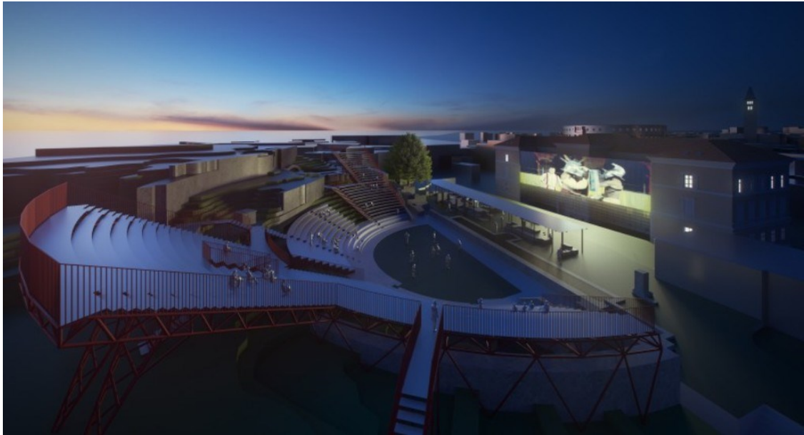
Slika 15: Planirani izgled Malog rimskog kazališta nakon provedbe projekta