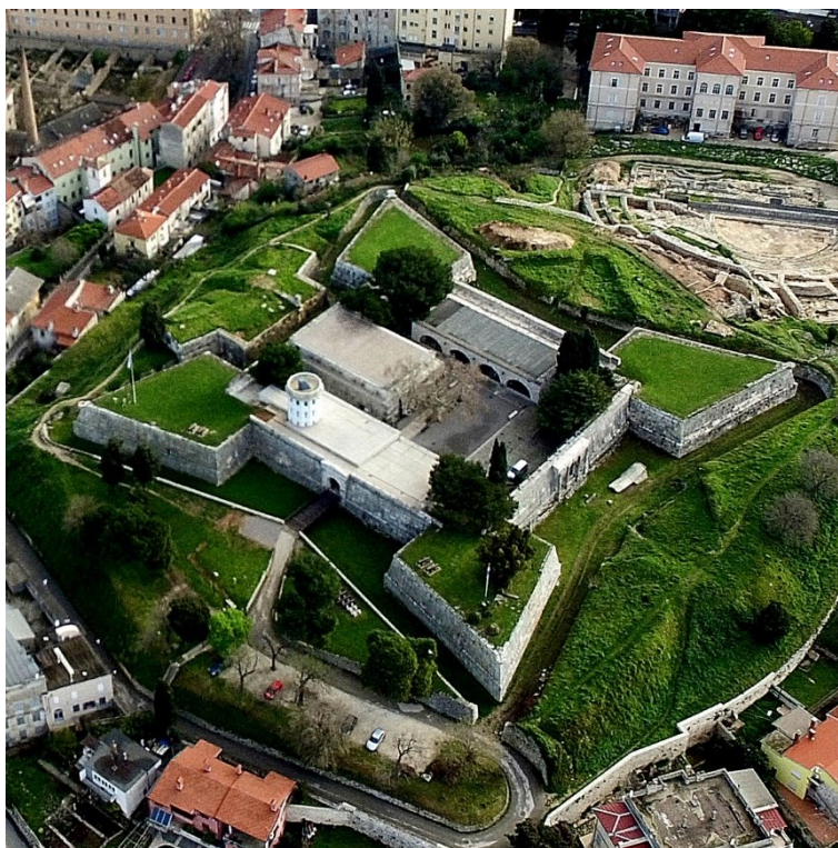
Slika 9: Kaštel

Povijesni i pomorski muzej Istre i mjesto je na kojem se redovito organiziraju koncerti i manifestacije ( http://www.ppmi.hr/hr/lokacije/kastel/izgled-kastela/ ).