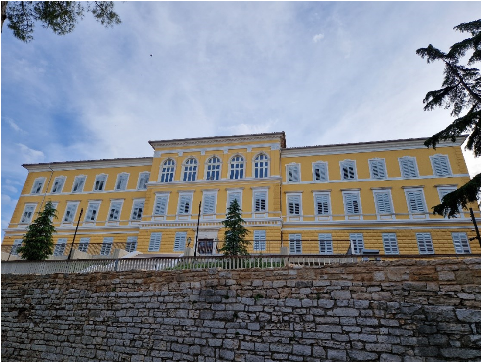
Slika 11: Arheološki muzej Istre