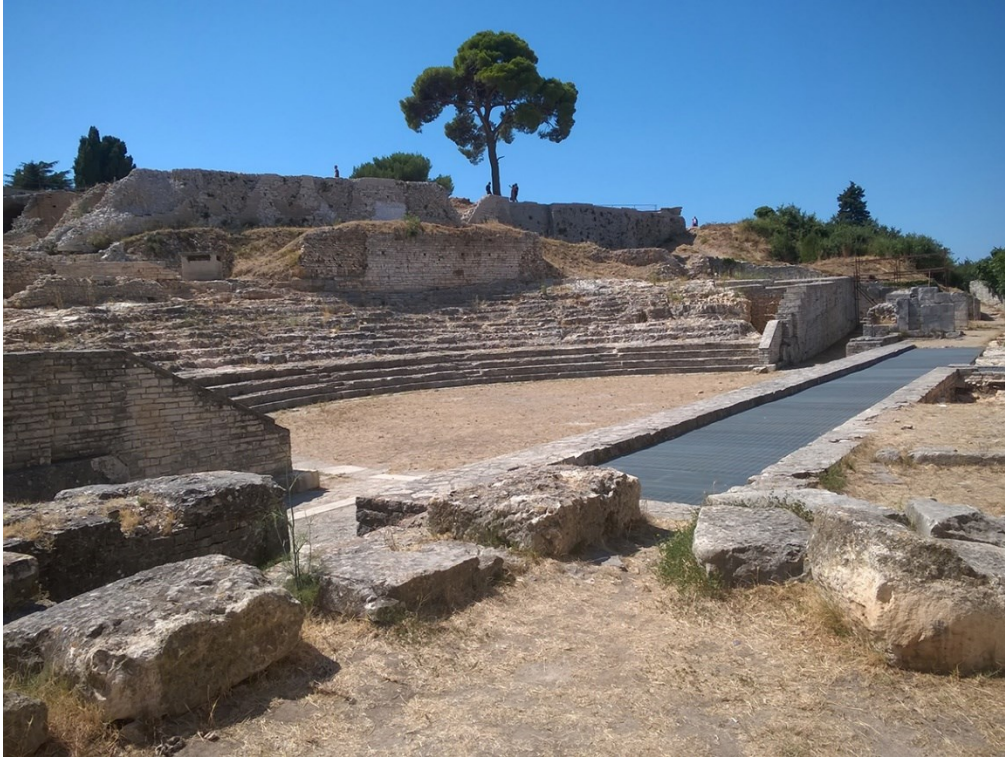
Slika 8: Malo rimsko kazalište prije rekonstrukcije