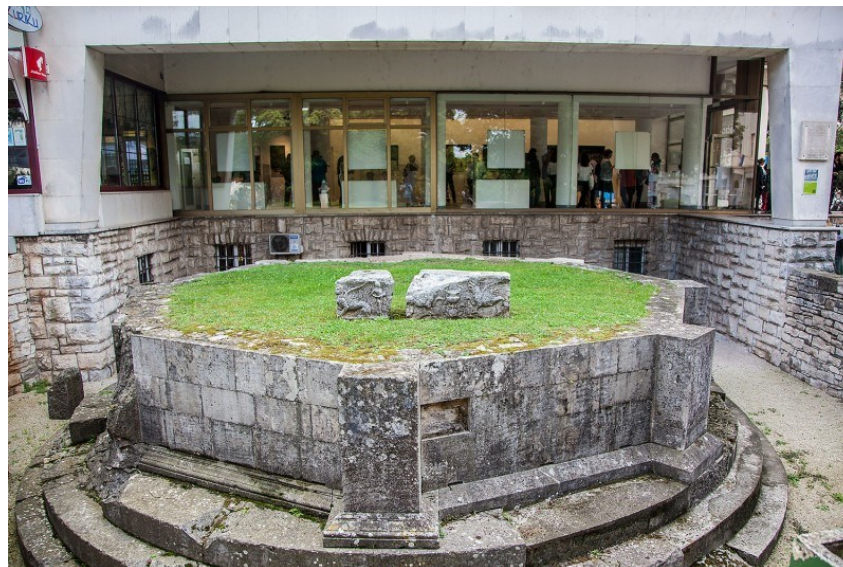
Slika 6: Oktogonalni mauzolej

Oktogonalni mauzolej (Slika 6) nalazi se preko puta Dvojnih vrata i u blizini Arheološkog muzeja Istre i jedini je očuvani spomenik koji se nekada nalazio u središtu antičke nekropole koja je stajala ispred gradskih zidina i pružala se od amfiteatra do velikog rimskog kazališta. Očuvana je baza mauzoleja i vidljivi su ostaci u obliku osmerokuta ispod kojih se nalazi podnožje s tri stepenice. Uz bazu se uzdižu pilastri na rubovima koji su ojačavali konstrukciju (Mlakar, 1958: 36). Pretpostavlja se kako se iznad toga uzdizala grobnica koja je imala osam stupova na čijem vrhu se nalazila krovna greda s bogato ukrašenim reljefnim dekoracijama, a u grobnicu je bio položen sarkofag. Iznad svega se nalazio krov koji je također bio osmerokutnog oblika (Mlakar, 1958: 37).