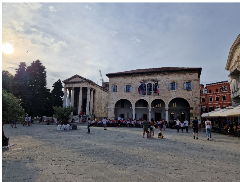
Slika 2: Augustov hram i Gradska Vijećnica na pulskom Forumu

vijenac kruništa koji su gotovo pa identični navedenim elementima na Augustovom hramu (Mlakar, 1958: 35).