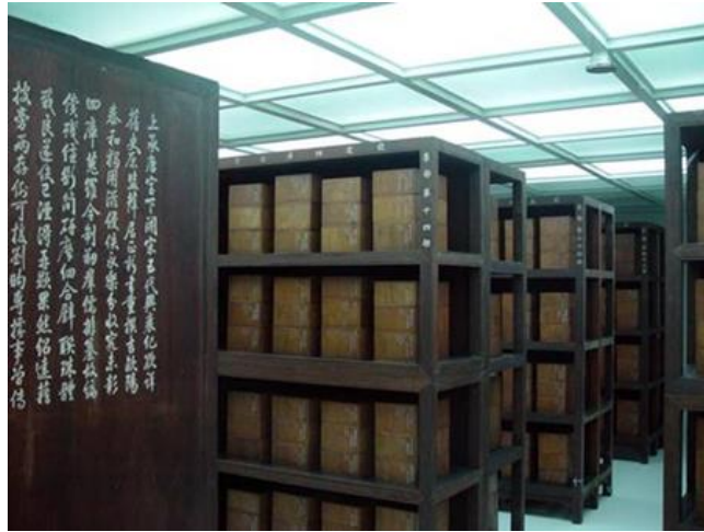
Slika 7. Spremište jedinstvene zbirke Siku Quanshu ( Complete Library of the Four Branches of Literature ).

Još jedan uspješan nacionalni projekt zaštite dokumenata kojeg je NLC 2012. godine pokrenula je Program očuvanja i konzervacije dokumenata Minguo . Projekt je također bio uključen u nacionalni 13. petogodišnji plan. Kineska literatura objavljena između 1912. i 1949. godine središte je Programa očuvanja i konzervacije dokumenata Minguo , koji također uključuje katalogiziranje, cenzus, istraživanje, očuvanje i konzervaciju, publikaciju i kompilaciju baze podataka navedene literature. Prema podacima iz 2021. godine, više od 310 000 bibliografskih zapisa i više od 600 000 zapisa o zbirkama iz 22 instituta za prikupljanje Minguo dokumenata prethodno je bilo prisutno u bazi podataka. Na temelju toga, NLC je započela s kataloškim uređivanjem literature Minguo razdoblja sastavljanjem i fotokopiranjem 4222 monografije Minguo građe (Wang, 2021). Otkad je program pokrenut, postigao je mnoga postignuća, uključujući odobrenje posebnog projekta za proučavanje Drugog kinesko-japanskog rata Kineskog nacionalnog fonda za društvene znanosti, a rad na očuvanju drevne građe je postojano napredovao. Nadalje, mehanizam konzervatorskog rada postupno je uspostavljen, postupno su provedeni opći pregledi dokumenata, prikupljanje inozemnih dokumenata postiglo je zapažene rezultate, razmjeri prikupljanja i objavljivanja dokumenata postali su jasni, a zbirka inozemnih dokumenata postigla je zapažene rezultate (NLC news, n.d.).