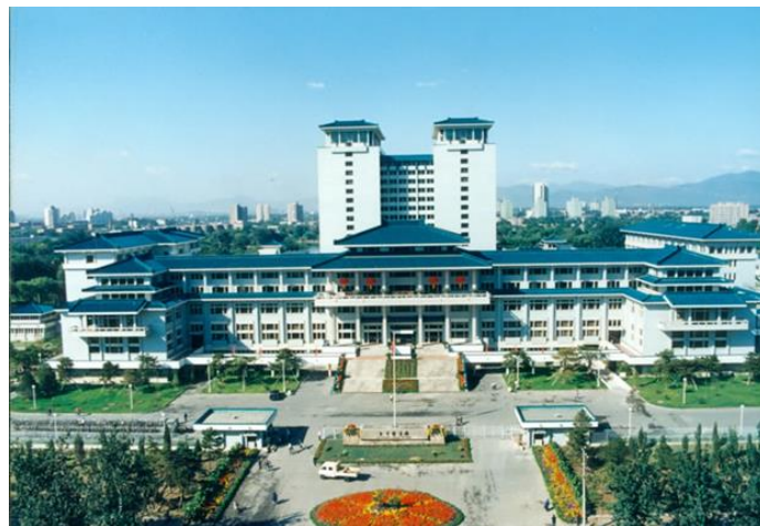
Slika 3. Južna zgrada (dio) knjižnice NLC-a, kraj mosta Baishiqiao (NLC Archives Office, n.d.).

knjižnica je završila pod vodstvom Ministarstva kulture, a 27. rujna 1949. godine ime je promijenjeno u Pekinška nacionalna knjižnica (National Library of China, n.d.). Zatim je 6. ožujka 1950. godine preimenovana u Nacionalnu knjižnicu Pekinga. Iduće godine, 12. lipnja preimenovana je u Pekinšku knjižnicu (National Library of China: an Introduction, n.d.). Knjižnica je u lipnju 1958. godine prebačena u pekinšku vlast, a vraćena Ministarstvu u studenom 1960. godine. Knjižnica se ubrzano razvijala sve do 1966. godine, kada je nastupila Kulturna revolucija čime je došlo do ponovnog premještaja knjižnice, a krajem 1968. godine skoro su svi ogranci knjižnice bili zatvoreni što dovodi do stagnacije. Ponovno dolazi i do premještaja osoblja 1969., sve do 1971. godine kada se napokon otvara i knjižnica. Nakon Kulturne revolucije, knjižnica se ponovno ubrzano razvija (National Library of China, n.d.). 13. siječnja 1981. usvojila je naziv Kineska nacionalna knjižnica za svoje međunarodne aktivnosti (Lin, 1998). Kako bi zadovoljio brzo rastuće društvene potrebe, premijer Zhou Enlai predložio je i ujedno odobrio izgradnju nove zgrade knjižnice u južnom dijelu koja se danas nalazi pokraj mosta Baishiqiao . Nova zgrada otvorena je za javnost 1987. godine, a prikazana je na slici 3 (National Library of China: an Introduction, n.d.).