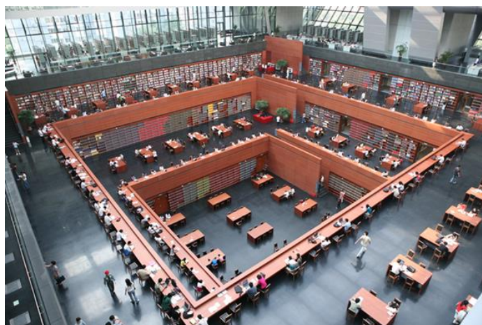
Slika 5. Velika čitaonica u glavnoj zgradi knjižnice (NLC Centennial Events Office, n.d.).

Dizajn Kineske nacionalne knjižnice uključuje tradicionalne kineske arhitektonske elemente. Temelji zgrade, raspored stupova i lebdeći strop stilski su elementi korišteni u kineskoj arhitekturi, koji su u pravilu bili rezervirani za najznačajnije, uglavnom javne objekte (World-architects, n.d.).