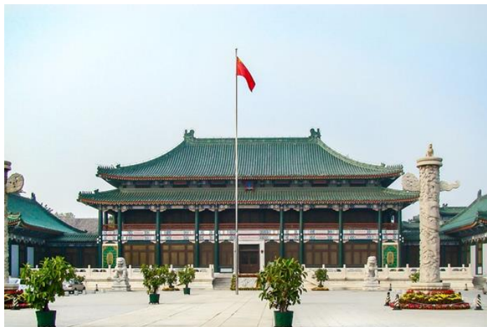
Slika 2. Zgrada Knjižnice drevnih knjiga u ulici Wenjin (Lemi, n.d.).

Imala je jednim dijelom funkciju nacionalne knjižnice jer je 1916. godine počela dobivati legalne kopije kineskih publikacija, a 1917. godine premještena je u ulicu Fangjiahutong (National Library of China: an Introduction, n.d.). Kako je knjižnica bila u izoliranoj lokaciji, Ministarstvo obrazovanja je privremeno obustavilo knjižnične usluge javnosti kako bi pronašlo prikladniju lokaciju, te je tako 1913. godine u lipnju otvoren novi ogranak knjižnice koji je 1929. godine predan u nadležnost Pekinga. Ogranak knjižnice promijenio je ime u Prva gradska knjižnica Pekinga, a kasnije je postala „Glavna knjižnica“. U međuvremenu se Metropolitanska knjižnica ponovno otvorila 26. siječnja 1917. godine, a zbirka joj je bila znatno veća. Nadalje, 1926. godine Kineska zaklada za promicanje obrazovanja i kulture osnovala je Pekinšku knjižnicu, koja je naknadno promijenila ime u Pekinšku Beihai knjižnicu (Lin, 1998). U srpnju 1928. godine Metropolitanska knjižnica je preimenovana u Nacionalnu knjižnicu Pekinga te premještena u Juren Hall u tadašnjem carskom vrtnom kompleksu Zhongnanhai . U kolovozu 1929. godine knjižnica je spojena s Pekinškom Beihai knjižnicom preuzimajući ime prve knjižnice. 1931. godine izgrađeni su novi prostori za knjižnicu u ulici Wenjin , koji danas čini knjižnični ogranak Kineske nacionalne knjižnice, odnosno Knjižnicu drevnih knjiga, a prikazana je na slici 2 (National Library of China: an Introduction, n.d.).