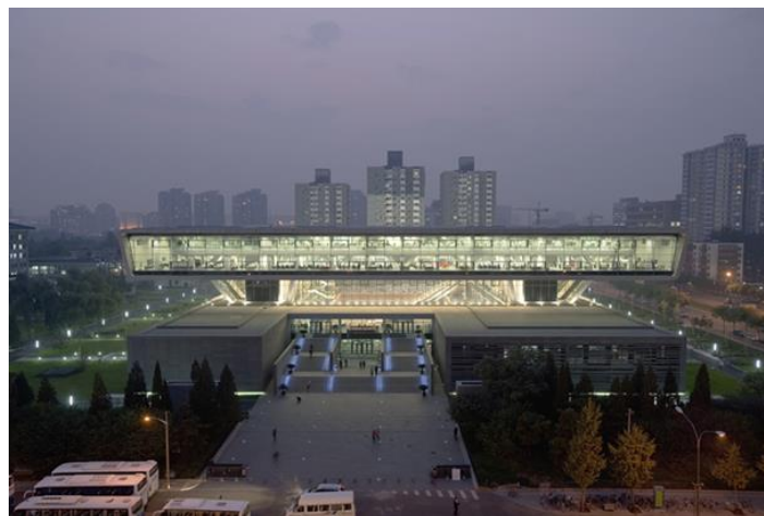
Slika 4. Glavna (sjeverna) zgrada knjižnice NLC-a s trodijelnim dizajnom (China Railway Construction Engineering Group, n.d.).

Pobjednička prijava na globalnom natječaju za gradnju nove zgrade Kineske nacionalne knjižnice bio je dizajn KSP Jürgen Engel Architekten . Knjižnica ima trodijelni dizajn koji se sastoji od čvrstih temelja, staklenog središnjeg dijela koji okružuje strukturalne jezgre s površinom na vrhu obloženog čelikom, a sam dizajn predstavlja prošlost, sadašnjost i budućnost. Kameni temelji zgrade gdje se nalaze knjige i dokumenti predstavljaju bogatu kinesku tradiciju. Prikaz glavne zgrade knjižnice može se vidjeti na slici 4 (Wong, 2016).