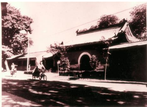
Slika 1. Metropolitanska knjižnica u hramu Guanghua (NLC Archives Office, n.d.).

Zahvaljujući utjecaju reformi i zapadnjačkog učenja koje se širilo na istok, početkom 20. stoljeća pojedini su znanstvenici predložili caru Qing dinastije da osnuje knjižnice i sveučilišta s nadom da će poticati nacionalnu kulturu i uvesti najsuvremeniju znanost i tehnologiju u Kinu. Car Xuantong je prihvatio taj prijedlog te je 9. rujna 1909. godine Metropolitanska knjižnica odobrena za izgradnju u hramu Guanghua u Peking, a Miao Quansun imenovan je carskim knjižničarem. Knjižnicu je nakon Revolucije iz 1911. godine preuzelo Ministarstvo obrazovanja, ali je tek 27. kolovoza 1912. godine otvorena javnosti. Prikaz knjižnice može se vidjeti na slici 1 (National Library of China: an Introduction, n.d.).