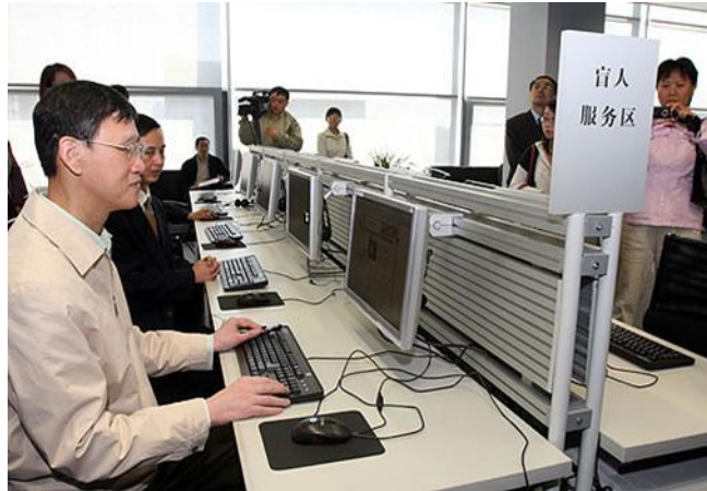
Slika 8. Osoba koristi usluge nacionalne digitalne knjižnice za osobe s oštećenjem vida (China.org.cn, n.d.).

NLC aktivno provodi Projekt promicanja digitalne knjižnice, a time su narodne knjižnice diljem zemlje sve više povezane jedna s drugom te se u cijeloj zemlji uspostavlja mreža usluga digitalnih knjižnica. NLC aktivno sudjeluje u zajedničkoj izgradnji digitalnih izvora, dijeli te izvore s narodnim knjižnicama na raznim razinama diljem zemlje i zajednički razvija digitalne knjižnice s PLA vojnom regijom Shenyang , PLA Drugim topničkim korpusom, Odjelom opće logistike PLA-a i naftnim poljem Tarim (National Library of China, n.d.).