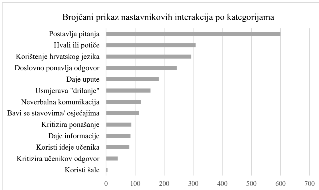
Slika 1. Brojčani prikaz nastavnikovih interakcija po kategorijama

Nakon kategorija neizravnog utjecaja slijede dvije kategorije izravnog utjecaja, davanje uputa i usmjeravanje „drillanja“, koje se pojavljuju ukupno 15% tijekom nastavnog sata. Kako bi se podaci prikazali što zornije, u nastavku slijedi graf koji prikazuje brojčanu raspodjelu nastavnikovih interaktivnih poteza po svim kategorijama.