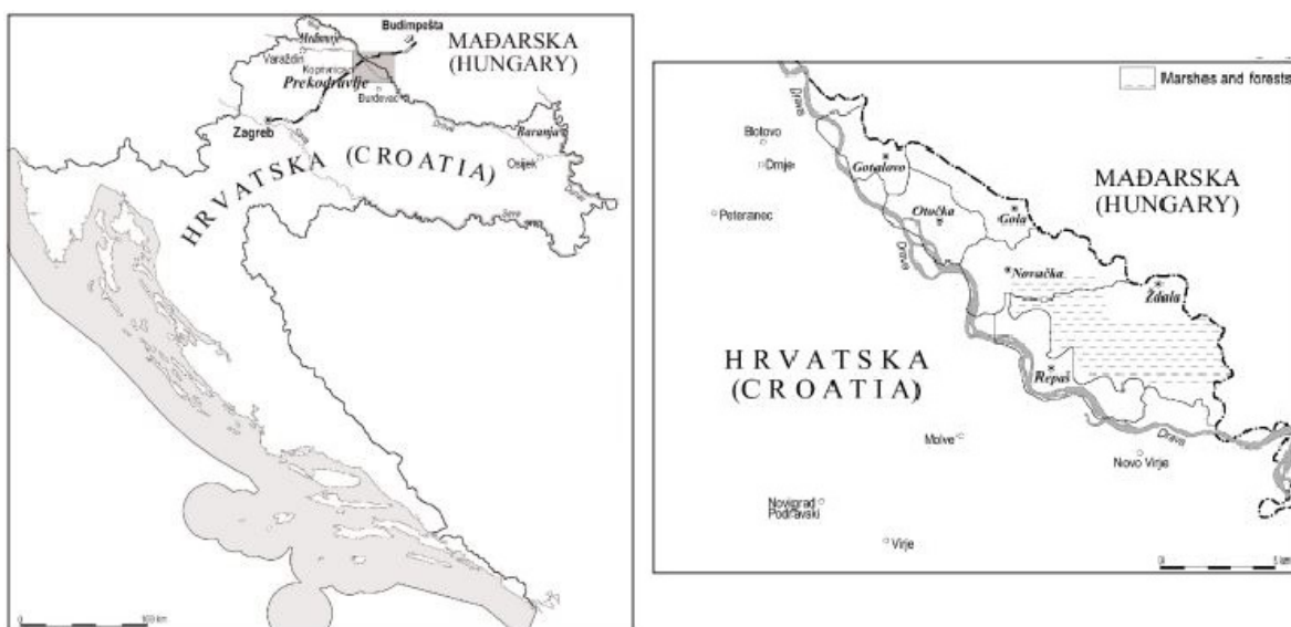
Slika 1. Prekodravlje, preuzeto iz Prekodravlje – Repaš: Razvoj naselja i stanovništva (Crkvenčić, 2003)

„Prekodravlje je pitom prostor Lijepa Naše, smješten između rijeke Drave i njezine lijeve pritoke Ždalice i Republike Mađarske. U tom, izrazito nizinskom prostoru dravske aluvijalne ravnice, nalaze se idilična sela Gola, Gotalovo, Novačka, Otočka, Repaš i Ždala“ (Zabjan, 2016:49).