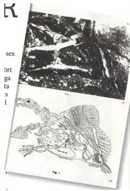
Okamuras fossila fågel Archaeoanas japonica och tillhörande rekonstruktion med tolkningar (från Okamuras originalpublikation från 1977).

Med tanke på de omfattande rapporterna som publicerades från Okamura Fossil Laboratory i Nagoya, Japan, så verkar åtminstone Okamura ha visat ett brinnande intresse för och var förmodligen djupt stimulerad av sina studier. Och vikten av det ska sannerligen inte underskattas. Som kurios (som om inte hela den här krönikan vore kurios) kan även nämnas att Okamura 1996 tilldelades IG Nobel-priset i kategorin biodiversitet för sitt arbete.