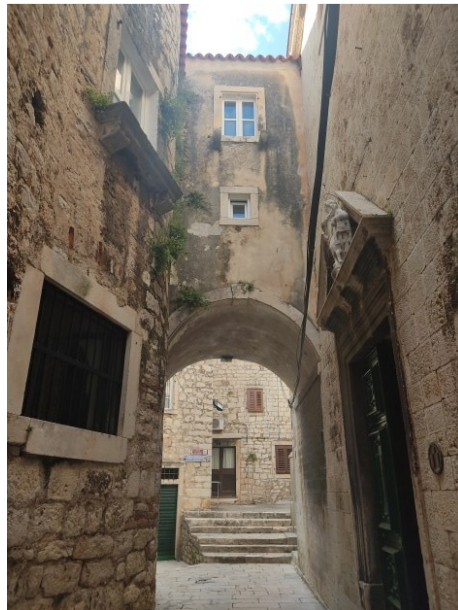
Slike 10 i 11: Pogled na luk s kojim je crkva povezana sa samostanom