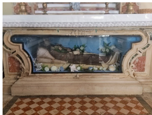
Slika 30: Stipes oltara sv. Antuna