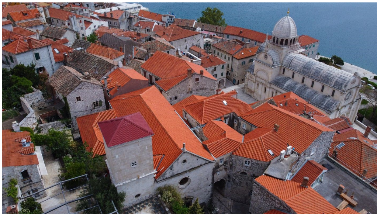
Slika 13: Pogled na crkvu iz zraka