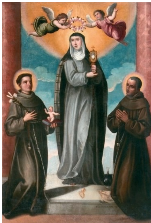
Slika 42: Baldassare D'Anna, Sveta Klara, sveti Antun Padovanski i sveti Didak

U okomito postavljenoj pravokutnoj slici prikazana su tri uspravljena svetačka lika. Središnji dio slike zauzima sv. Klara koju cvjetnom krunom krune dva malena anđela, jedan odjeven u zelenu haljinicu, a drugi u crvenu. Stoji na kamenom postamentu, a s njene lijeve strane je sv. Didak, dok je s desne prikazan sv. Antun Padovanski. Sv. Klara odjevena je u sivu haljinu preko koje je prebačen crni veo što je karakteristično za njezin prikaz. U lijevoj ruci drži piksidu s hostijom koju u donjem djelu pridržava desnom rukom. U pozadini je plavo nebo s oblacima te s ostrim brdima, a svece flankiraju dva mramorna stupa na rubovima slike.