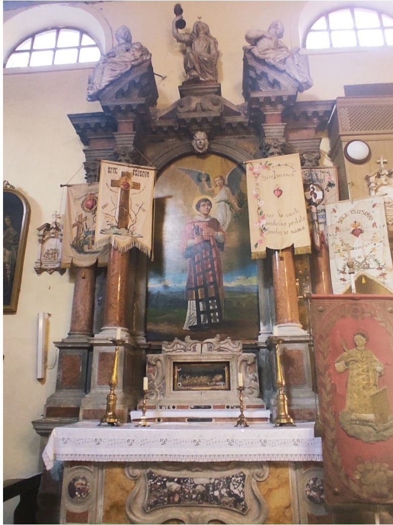
Slika 23: Prikaz cijelog oltara