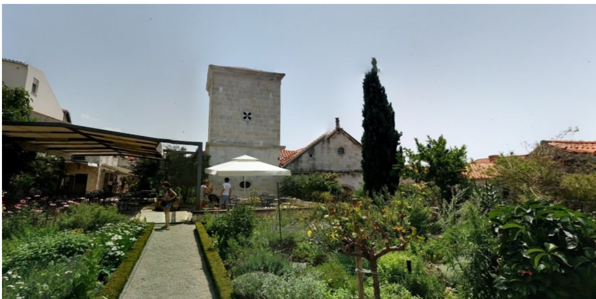
Slika 16: Današnji izgled zvonika

S južne strane crkva je povezana sa samostanom pomoću luka koji se proteže preko ulice iznad samostanskih vrata. Kroz taj luk ulazi se u kor za pjevače koji je bio sagrađen u XVIII. stoljeću. Kor je veoma malen jer je velik dio prostora gdje se on nalazi zauzima ormar za orgulje.