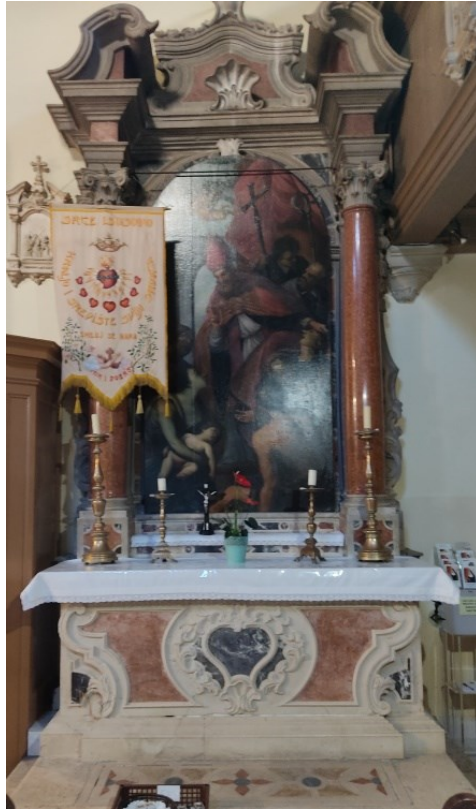
Slika 25: Prikaz cijelog oltara

Oltar sv. Blaža koji se nalazi na južnoj strani crkve imao je sve do kraja XIX. stoljeća titulare sv. Šimuna i sv. Franje. Njegova tipologija i kvaliteta izrade identična je oltaru sv. Nikole Tavelića. Radi se o oltaru podignutim na dvije stube, jednostavna izgleda i skromnog ukrasa s trodijelnom podjelom (stipes, retabl, zabat) na kojoj se izlaže slika. Stipes ponavlja identičan izgleda sa zaobljenim gornjim rubovima, te baroknom reljefnom kartušom ovalnog oblika čije je središte ispunjeno plavim, prošaranim mramorom. U središtu oltara postavljena je pala s prikazom Čuda svetog Blaža , flankirana s vitkim, crvenim, mramornim stupovima koji nose prekinuto gređe. U tjemenu lučnog otvora nalazi se motiv povijenog lista. Okvir slike dodatno ukrašavaju inkrustacije od raznobojnog mramora. Zabat je nepravilnog oblika, a profilirani odsječci segmentnog zabata izdižu se iznad prekinutog gređa koje podržavaju dva mramorna stupa. Na središtu zabata nalazi se motiv školjke, iznad tjemena lučnog otvora.