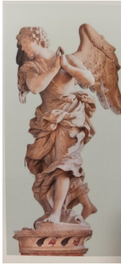
Slika 36: Kip Gabrijela, glavni oltar