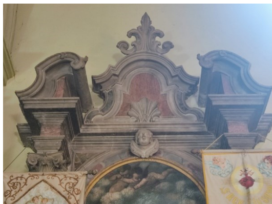
Slika 29: Zabat oltara sv. Antuna

prigradskim sredinama kombinirali su kamen i mramor. 94 Na njihovim oltarima je skulptura uvijek u podređenom položaju, a retabl je oblikovan prvenstveno kao okvir za sliku što možemo vidjeti i u ovom slučaju.