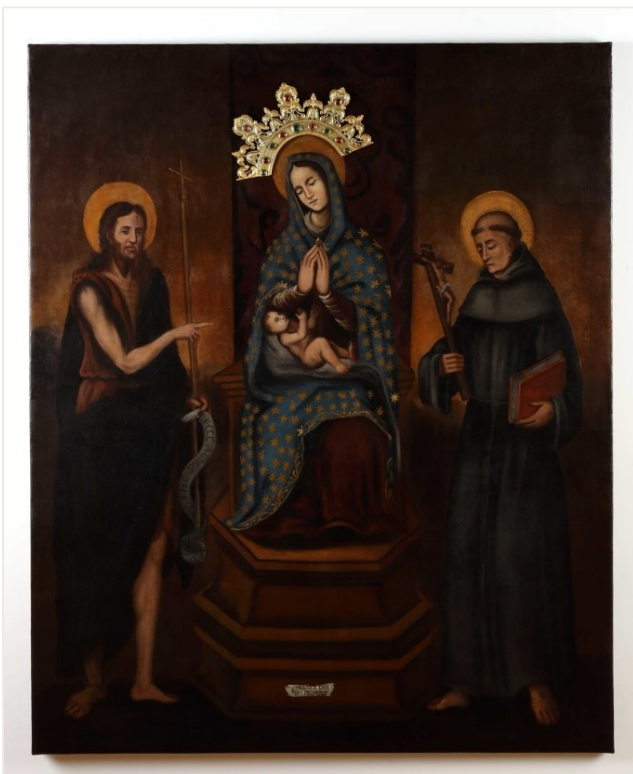
Slika 40 : Nepoznati autor, Sveti razgovor sa sv. Ivanom Krstiteljem i sv. Franjom Asiškim , 1679. godina, Visovac, oltar Gospe Visovačke