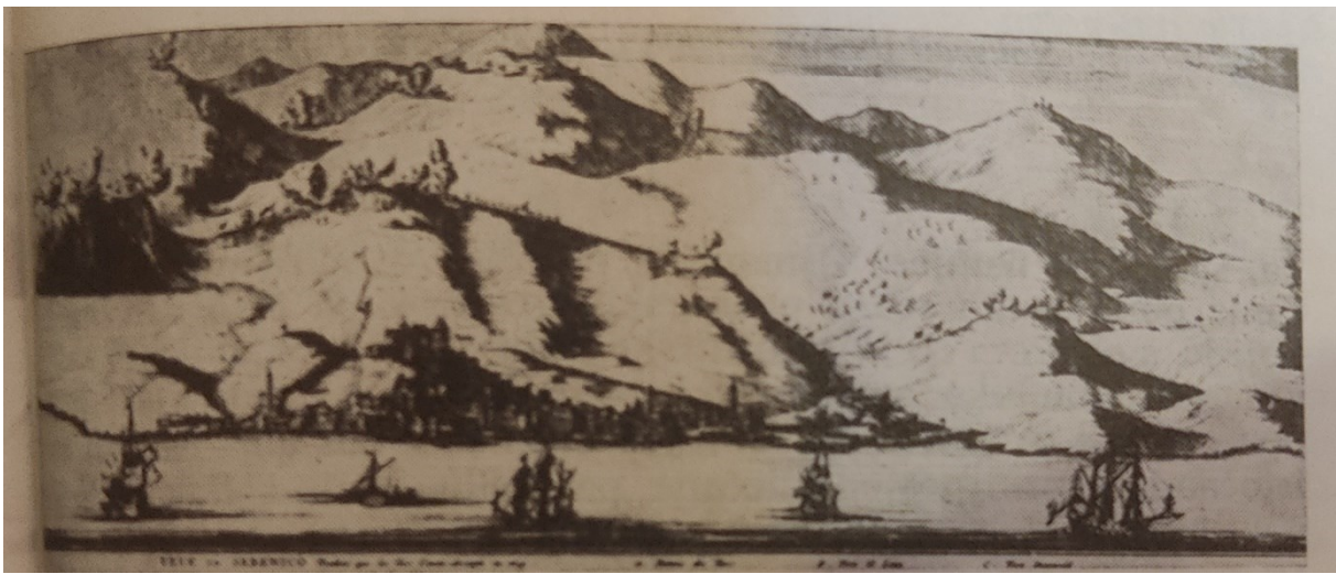
Slika 5: Borbe Šibenika protiv Turaka u prvim godinama kandijskog rata, knjižna ilustracija (bakrorez) iz djela Nouveau theatre d'Italie , Joaua Blaeua, objavljenog u Amsterdamu 1704. godine

Tekeli-paša je 8 rujna 1647. godine ponovno pokušao osvojiti samu tvrđavu no komandant obrane Šibenika general Kristof Martin Degenfeld spremno je dočekao novi turski napad. Tog dana započela je jedna od najžešćih i najkrvavijih bitaka u povijesti Šibenika do tada. Povlačenje Turaka započelo je 11. rujna kada je u šibensku luku uplovio providur Leonardo Foscolo. Opsada grada tako je prekinuta 16. rujna 1647. godine kada je Tekeli-paša skupio preostalu vojsku i krenuo natrag prema Drnišu.