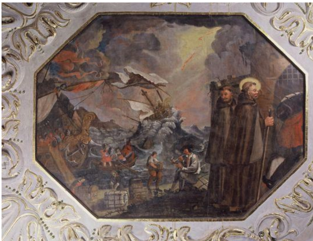
Slika 1: Bernardo Bobić (?), Sveti Franjo Asiški se iskrcava na hrvatskoj obali , 1683., zidna slika, Zagreb, Kaptol, franjevački samostan sv. Franje, kapelica sv. Franje

Tako je u Bosni 1339.-1340. godine Bosansku vikariju osnovao Fra Geraldo Odonis. 7 Ubrzo je počelo i njihovo širenje izvan granica bosanske države, prema krajevima Hrvatske, Bugarske i Transilvanije. Bosanska vikarija imala je u XIV. stoljeću 34 samostana, a već polovicom XV. stoljeća taj je broj narastao na 60.