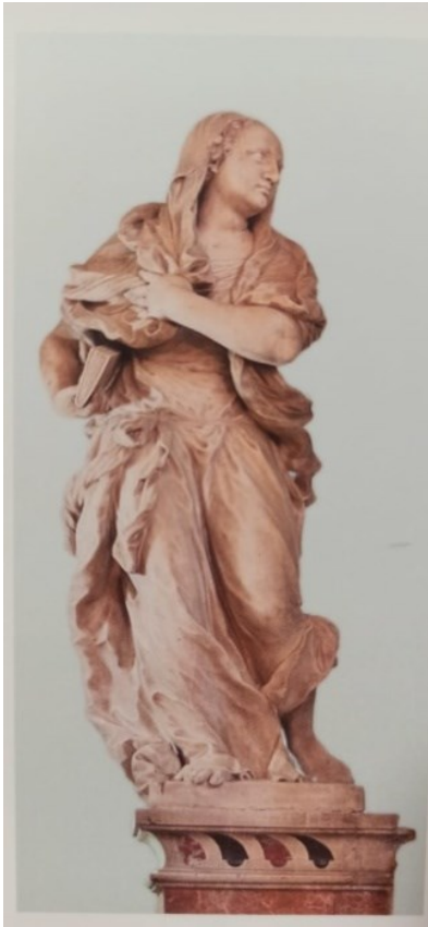
Slika 35: Kip Marije, glavni oltar