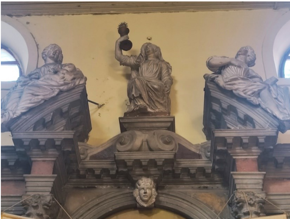
Slika 22: Zabat oltara

U oltarnoj niši izvorno se nalazila slika s prikazom Mučeništva svetog Lovre čiji je autor bio Antonio Bellucci. Pala je uništena u požaru 1965. godine, a njezin izgled danas znamo zahvaljujući crno-bijeloj fotografiji. Umjesto nje danas se na tom mjestu nalazi suvremena slika koja također prikazuje svetog Lovru u đakonskoj odjeći koji u desnoj ruci drži žar na kojem je bio pogubljen, kao simbol svoga mučeništva, dok je iznad njega anđeo.