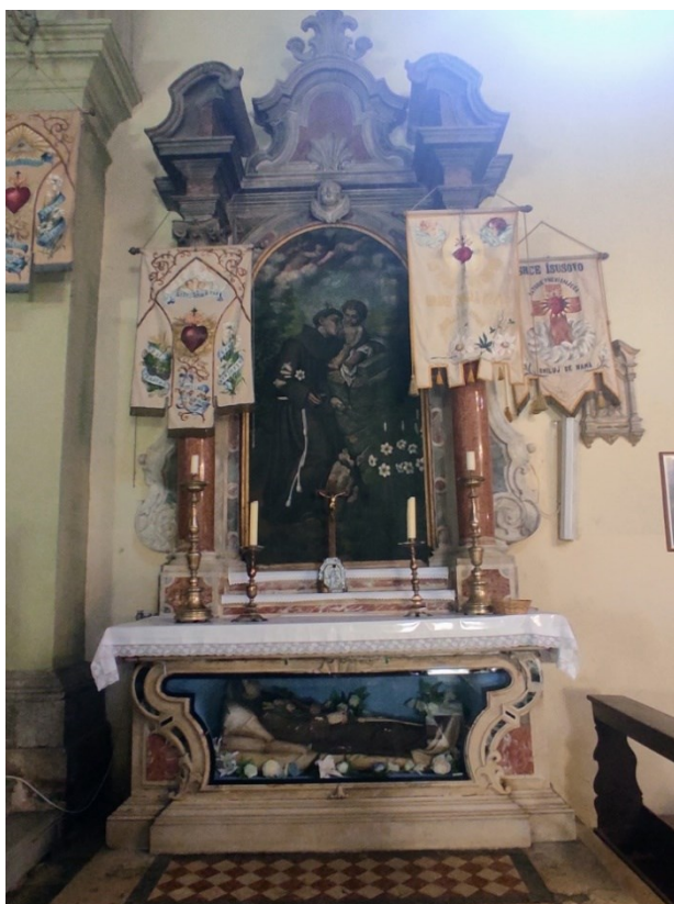
Slika 28: Prikaz cijelog oltara

Za izradu ovog oltara zaslužni su braća Pio i Vicko dell'Acqua, altaristi koji su doselili iz Chioggie, a čija je djelatnost bila razgranata diljem Dalmacije. Tako njihova djela, koja uključuju brojne oltare koji imaju ujednačenu tipologiju i izvedbenu kvalitetu, pronalazimo u Šibeniku, Murteru, Zlarinu, Zatonu, Kaštelima, Sinju, Klisu itd, a u Šibeniku se, gdje su najvjerojatnije imali i radionicu, prvi put spominju 30. siječnja 1772. godine kada im franjevci s otoka Krapnja daju u najam kuću koja se nalazila uz zvonik katedrale sv. Jakova u Šibeniku i to za iznos od 200 lira godišnje. 92 Prema ugovoru sklopljenom s franjevcima crkve sv. Lovre trebali su napraviti dva bočna oltara, ovaj posvećen sv. Antunu Padovanskom i nasuprotni oltar posvećen sv. Paškalu, a kao što je i navedeno već, oltari su trebali oblikom i kvalitetom slijediti bočne oltare koji su postavljeni ispod kora crkve. Novac za izradu ovog oltara veoma jednostavne tipologije i skromnog ukrasa, kao i za onog posvećenog sv. Paškalu oporučno je ostavio 1767. godine Šibenčanin Josip Giaguzzi. 93