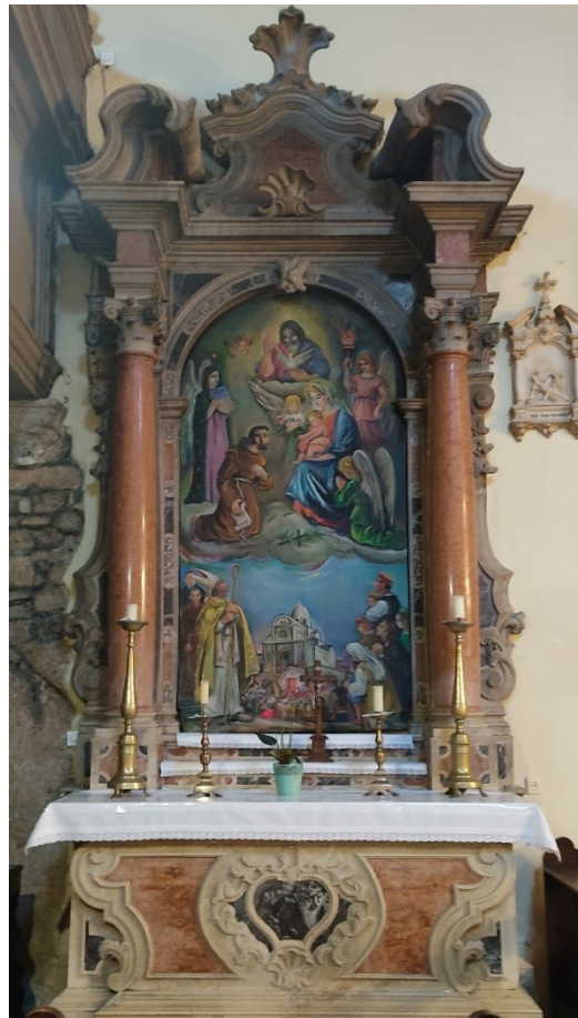
Slika 27: Prikaz cijelog oltara

Oltar je zajedno sa sučeljenim oltarom sv. Blaža poslužio kao uzor za oltar sv. Antuna Padovanskog i oltar sv. Paškala koji su izradila braća dell'Acqua.