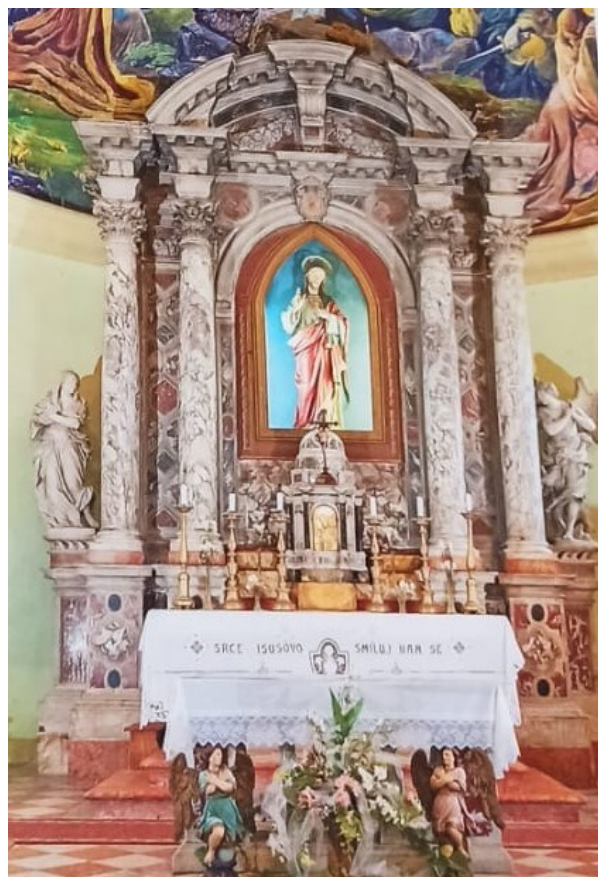
Slika 34: Glavni oltar

Prema sačuvanom inventaru iz 1711. godine znamo da je prvotni oltar bio drven, no on je uklonjen i zamijenio ga je ovaj današnji. Također sačuvan je i ugovor koji su franjevci sklopili 26. svibnja 1773. godine s braćom Piom i Vickom dell'Acqua. Prema tom ugovoru braća su trebala podignuti donji dio oltara za 120 cekina i to prema nacrtu Tome Petrića. 105 Prema ugovoru stuba su trebale biti od crvenog veroneškog mramora koji su fratri morali sami nabaviti, dok su baze stupova, postolja za kipove i menza bili predviđeni od bijeloga bračkog kamena koji je trebao doći Sumartina, a predviđeni su bili i umeci od »francuskog« bijeloga i crvenog mramora. 106 Za isti oltar braća su potpisali još jedan ugovor 1779. godine prema kojem su morali izgraditi prema vlastitom nacrtu svetohranište koje je trebalo biti od crvenog i zelenog mramora s umecima od kararskog mramora. 107