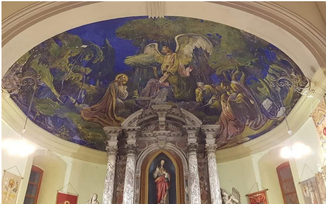
Slika 17: Pogled na apsidu s prikazom Krista u Getsemanskom vrtu