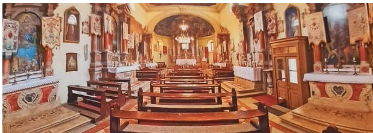
Slika 14. Unutrašnjost crkve