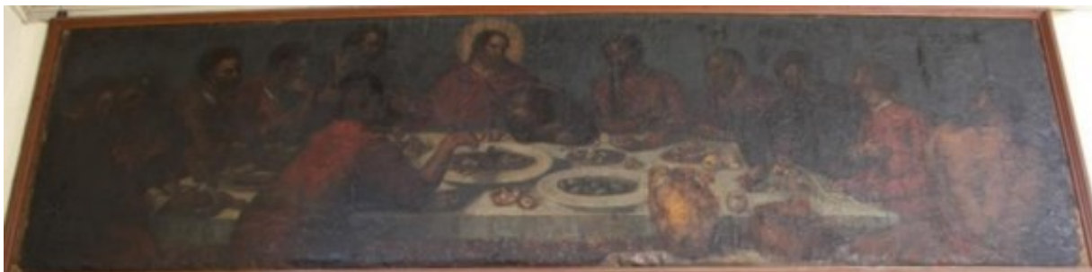
Slika 45: Nepoznati slikar, Posljednja večera , kor crkve svetog Lovre

Na slici vodoravno izduljenog pravokutnog formata, smještenoj u koru crkve sv. Lovre prikazana je scena Posljednje večere. Svi likovi prikazani su kako sjede te su raspoređeni oko stola i tvore ovalnu kompoziciju. U središtu slike dominira lik Krista koji se ističe sa zlatnom aureolom oko glave. Ima dugu smeđu kosu i bradu. Odjeven je u crvenu haljinu, a pogled mu je usmjeren prema apostolu Ivanu koji sjedi s njegove lijeve strane naslonjen rukama na stol. Likovi su prikazani u međusobnoj komunikaciji što je postignuto pokretima tijela, mimikama i gestama. Na stolu se nalaze tanjuri s hranom, a u desnom kutu slike možemo vidjeti vrč za vino te posudu s voćem. Pozadina slike je veoma tamna pa do izražaja dolazi dugi, bijeli stolnjak. O samom stilu i vremenu nastanka slike teško je govoriti budući da je jako oštećena, no prema kompoziciji, načinu prikaza odjeće likova ali i izrazito naglašenim tenebroznim tendencijama, sliku bi mogli datirati u kraj XVII. stoljeća.