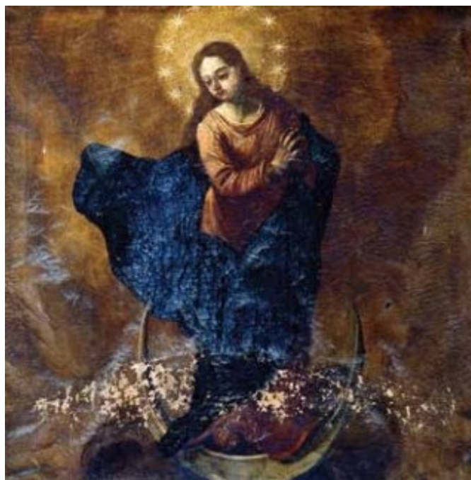
Slika 44: Giovanni Francesco Fedrigazzi (?), Bezgrešno začće , kor pjevališta crkve

Djela su mu sačuvana u brojnim crkvama u Istri u Dalmaciji, ali i u samostanskim i privatnim zbirkama.