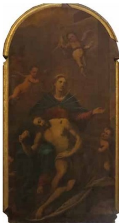
Slika 41: Josip Marcatti, Oplakivanje Krista

Oltarna pala maloga, uzdužnoga formata prikazuje Oplakivanje Krista. Tijelo mu je golo i prekriveno je perizomom oko bokova. Mrtvo tijelo položeno mu je na bijelu plahtu, a nad njegovim uzglavljem nalazi se Bogorodica odjevena u crvenu haljinu i plavi maforion. S Bogorodičine lijeve strane nalazi se mali anđeo, dok još dva anđela lete u vrhu slike. Jedan od anđela u rukama nosi svitak na kojem je natpis „Cuius Animo Gemente, Contristat. Et Dolentem Pertransiuit Gladius“, a radi se o strofi iz pjesme Stabat mater dolorosa .