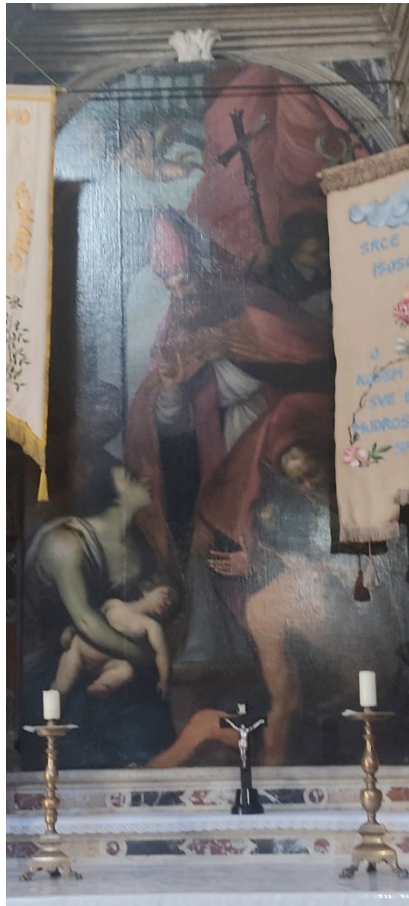
Slika 26: Antonio Carneio , Čudo svetog Blaža

Sv. Blaž nalazi se u središtu pale kao dominantan lik, a odjeven je u biskupsku odjeću. Njegova desna ruka podignuta je u snažnoj i teatralnoj gesti koja upućuje na majku koja se nalazi na lijevoj strani kompozicije s djetetom u rukama. Majka je odjevena u plavu haljinu, a preko glave ima prebačenu sivu maramu. Pogled joj je uplašen i upućen prema sv. Blažu kojeg moli za pomoć za svog sina koji već ima ovješeno tijelo i mrtvački pogled. Iza majke nalazi se nagi, mladenački lik s rukama sklopljenima u molitvi. Na desnoj strani kompozicije u prvom planu prikazan je muškarac okrenutih leđa, s naboranim vratom i razbarušene kose. Prema njemu je nagnut lik starice, izborana lica i ruku te sijede kose, koja se muškarcu obraća u dramatičnom nagibu. Iza starice nalazi se dječak kojemu se vidi samo glava i kojeg sv. Blaž drži lijevom rukom za kosu u jednoj prilično dramatičnoj gesti. S desne strane, iza leđa sveca prikazana su dva lika od kojih je jedan starac koji pridržava biskupski štap, a drugi je mladić s biskupskih križem. Na vrhu kompozicije ispod baldahina na svijetloplavom nebu lete dva naga anđela. Autor slike je Antonio Carneio koji je prikazao upravo vrhunac samog događaja s golemim likovima sa snažnim gestama. Kolorit je prozračan i svijetao zahvaljujući čemu kompozicija ne djeluje zagušeno unatoč brojnim likovima.