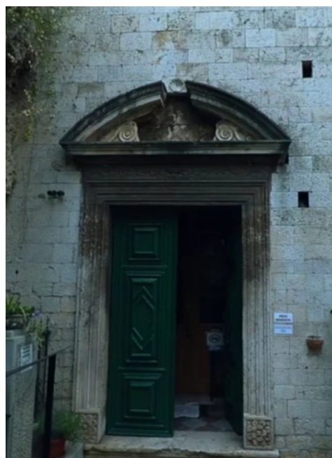
Slika 9: Glavni portal crkve

Na južnoj strani crkve bočna su vrata s jednostavnim dovratnicima i nadvratnikom. Timpanon je kao i na glavnom portalu otvoren, a u njegovoj unutrašnjosti postavljen je lijepi barokni kip sv. Lovre na čijem je podnožju natpis: D. L. T. MDCCXX, moguće inicijali Lovre Tette. 57 Južni zid crkve rastvoren je s polukružnim prozorima.