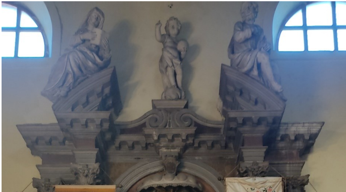
Slika 20: Zabat oltara