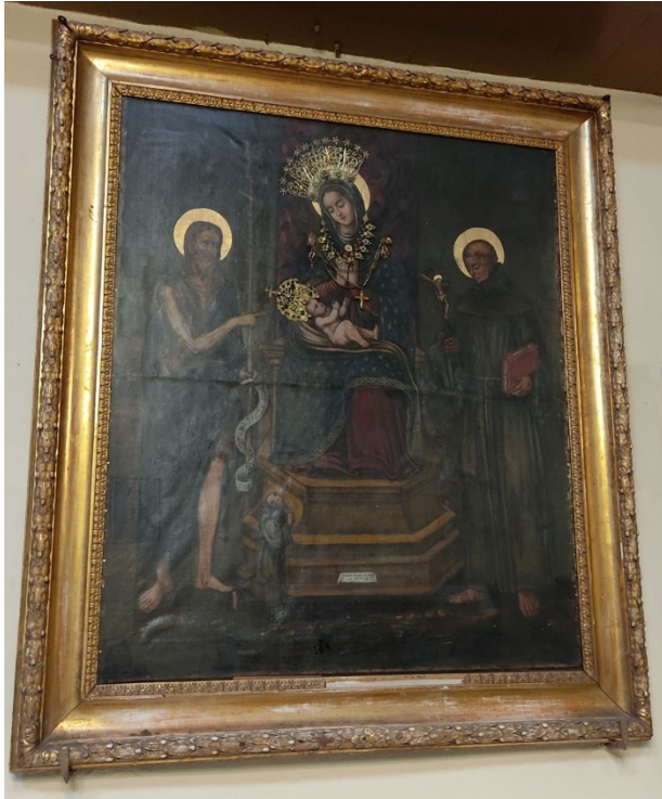
Slika 39: Nepoznati autor, Sveti razgovor sa sv. Ivanom Krstiteljem i sv. Franjom Asiškim , crkva svetog Lovre sjeverni zid crkve sv. Lovre, oko 1670. godine