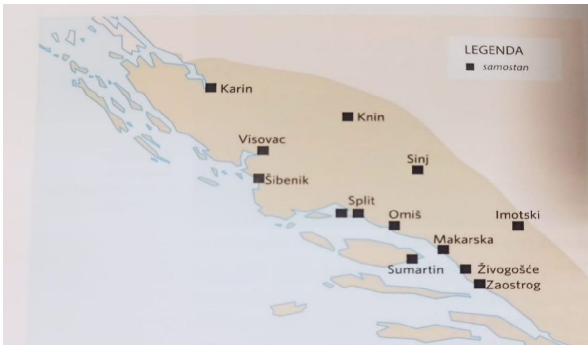
Slika 3: Zemljovid područja Franjevačke provincije Presvetoga Otkupitelja, sredinom XVIII. stoljeća