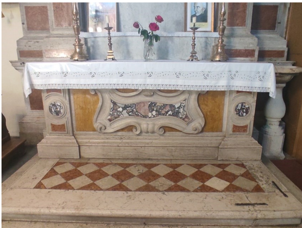
Slika 18: Stipes oltara Gospe od Milosti