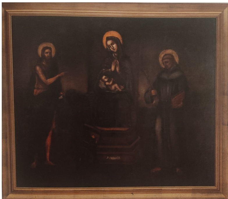
Slika 38: nepoznati slikar, Sveti razgovor sa sv. Ivanom Krstiteljem i sv. Franjom Asiškim , 1576., Visovac, muzejska zbirka franjevačkog samostana

Slika Sveti razgovor s Ivanom Krstiteljem i sv. Franjom Asiškim , uokvirena raskošnim izrezbarenim pozlaćenim okvirom koji je nastao zajedno sa slikom, stajala je na glavnom drvenom polikromiranom oltaru iznad izrezbarenog tabernakula. Sedamdesetih godina XVIII. stoljeća počelo se razmišljati o zamjeni drvenih oltara s novim raskošnijim mramornim, pa je 1773. godine sklopljen ugovor s altaristima braćom Pijom i Vickom dell'Acqua za izgradnju donjeg dijela oltara, a 1779. godine dovršili su mramorni tabernakul nad kojim je postavljena ova slika. 114 Ovaj oltar skinut je 1832. godine te je napravljen novi za istu sliku. Danas se slika nalazi na sjevernom bočnom zidu između oltara sv. Paškala i oltara sv. Lovre.