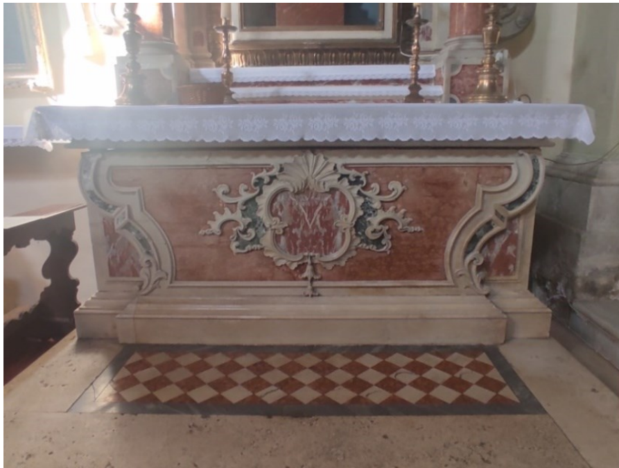
Slika 32: Stipes oltara