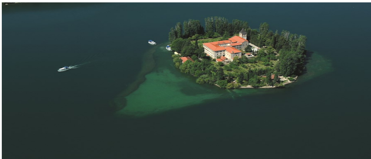
Slika 4: Otok Visovac sa samostanom Majke od Milosti i crkvom Gospe Visovačke

Dio franjevacu bježeći iz Bosne došao je u Dalmaciju oko 1445. godine i zaustavio se na malenom otoku Visovcu kojeg su pustog ostavili augustinici radi straha od turskih provala, nalik onoj 1415. godine. 11 Dolaskom na otok franjevci provincije Bosne Srebrene obnovili su ruševan samostan te izgradili novu crkvu. Crkva je sagrađena u gotičko-renesansnom obliku s dvjema nadsvedenim dubokim kapelama na sjeveroistoku koje imaju ulogu apside jedinstvenih arhitektonskih karakteristika u Provinciji Presvetog Otkupitelja. 12 Po običaju nastavili su plaćati Turcima porez i tako sve do 1645. godine. Spomenute godine turskom invazijom na otok Kretu (Kandiju) započeo je rat kojim je okončano razdoblje od 70 godina mira između Venecije i Turske. Bez obzira na zaštitu i mogućnost pastoralnog djelovanja te slobodu vjeroispovijesti („ahdnama iz 1463.“) koju im je dao sultan Mehmed II. što ju je isposlovao fra Anđelo Zvijezdović (Zvizdović), bosanski franjevci su bili često zlostavljani, ubijeni i proganjani. 13 Zbog svih tih razloga braća koja su nastanila samostan sv. Marije na Visovcu odlučili su napustiti otok i spasiti život bijegom u Šibenik.