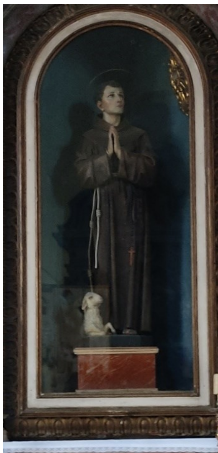
Slika 33: Kip sv. Paškala

„Devetnicu u njegovu čast sastavio je i izdao u 18. stoljeću nepoznati franjevac. U samostanskom arhivu sačuvana je knjiga Libro di S. Pasquale , nedovoljno vođena, u kojoj se opisuje što se pod vodstvom J. Župana obavila 1780. g. Kroz devetnicu bilo je na oltaru zapaljeno 64 svijeća od libre i po još 4 torca.“ 102