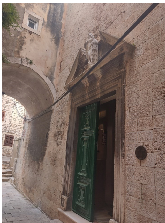
Slika 12: Južni portal crkve