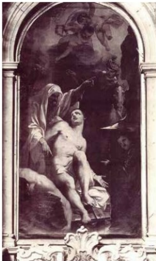
Slika 24: Antonio Bellucci, Mučeništvo svetog Lovre

NARUČITELJ ILI DONATOR: Lorenzo Fondra (1664.-1709)