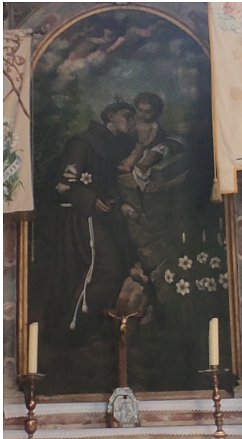
Slika 31: Nepoznati slikar, Sveti Antun Padovanski , oltar svetog Antuna

Sv. Antun Padovanski bio je svetac iz Lisabona koji je živio u XIII. stoljeću čijim se govorničkim darom oduševio sveti Franjo Asiški te mu je povjerio odgojni rad u franjevačkom redu. 95 Najčešće je prikazan kao golobradi mladić odjeven u franjevački habit, a u rukama drži svetačke oznake koje mu pripadaju, kao što je ljiljan, koji pronalazimo i na ovoj oltarnoj pali, plamen, knjiga, riba i procvjetali križ. Poznat je po mnogobrojnim legendama među kojima je možda najpoznatija ona o krivovjercu iz Toulousa koji nije želio vjerovati u to da je Krist prisutan u euharistiji ako njegov magarac ne ode iz staje i ne klekne pred svetim sakramentom, što se naposljetku i desilo nakon nekoliko dana kada je sveti Antun nosio euharistiju umirućem. 96 Upravo radi toga često je prikazan s magarcem koji kleči. Od vremena renesanse često ga je prikazan kako drži malog Isusa u rukama. 97 Takav djelomičan prikaz vidimo i na ovoj slici gdje Isus nije u rukama već ga Antun pridržava lijevom rukom dok dijete sjedi. Autor slike nije nam poznat kao ni njena datacija no uzevši u obzir da je ovo izvorna oltarna pala pretpostavka je da je nastala krajem XVIII. stoljeća.