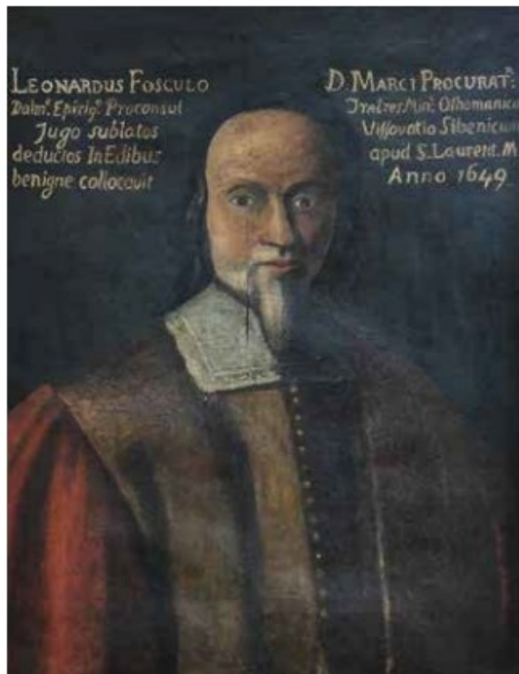
Slika 6: Nepoznati slikar, Portret Leonarda Foscola , Šibenik, samostan sv. Lovre

1654. godine i odustali od gradnje samostana kod crkve sv. Nikole, a kupnjom okolnih kuća i darovnicama polako su se proširili i postali važno religiozno središte grada Šibenika. Tako je osnovan samostan sv. Lovre koji će se sve do polovice XIX. stoljeća nazivati monasterio dei padri zoccolati bosnesi del monasterio di Visovac , odnosno Visovački samostan . 38