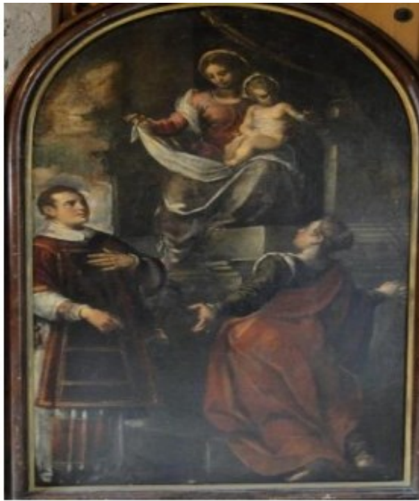
Slika 43: Gospa sa sv. Margaretom i sv. Lovrom mučenikom

Na slici je prikazana Gospa koja sjedi na visokom prijestolju s malenim djetetom u rukama. Ispod nje prikazana su dva svetačka lika koja zajedno s Gospom tvore piramidalnu kompoziciju. Gospa nosi crvenu haljinu te ima sivi plašt omotan oko struka i nogu. Glava joj se spušta, a pogled usmjeren prema bijelom veu kojeg pridržava desnom rukom, a kojim je ujedno omotano i dijete. Maleno dijete sjedi na njezinom lijevom bedru s glavom okrenutom u svoju lijevu stranu. S lijeve strane nalazi se sveti Lovre u tročetvrtinskom profilu, zaokrenut prema Gospi te zamišljenog pogleda i lijeve ruke položene na prsima. Odjeven je u tipičnu đakonsku odjeću koju čine bijela haljina i bijela dalmatika. Na desnoj strani prikazana je sv. Margareta odjevena u haljinu ljubičaste boje preko koje je prebačen crveni plašt. Okrenuta je promatraču leđima te joj je vidljiv samo dio lica. Prikazana je u dramatičnom zanosu s raširenima rukama i tijelom izbočenim prema naprijed.