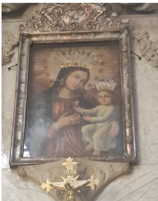
Slika 21: Nepoznati slikar, Gospa od Milosti , oltar Gospe od Milosti

Slika Gospe od Milosti formata je uspravljeno postavljeno pravokutnika. 67 Smještena je u srebrni okvir, a nekada se nalazila na oltaru sv. Blaža. Danas je smještena na oltar posvećen upravo njoj koji je izvorno nosio titular sv. Petra Alkantarskog. Na slici je prikazana Bogorodica okrunjena s trostrukom zlatnom krunom, simbolom Crkve. U lijevoj ruci pridržava umiljato Dijete, a desna ruka joj je položena na prsa. Glavu je blago nagnula prema Djetetu. Odjevena je u crvenu haljinu i plavi maforion koji pokriva i glavu. Maleno Dijete odjeveno je u svijetlu haljinicu, te mu je kao i Bogorodici okrunjena glava. Pogled mu je uperen prema promatraču, a na prstiću svoje desne ruke nosi češljugar koji predstavlja najužu povezanost utjelovljenja i otkupljenja budući da se on smatra simbolom Kristove muke. 68