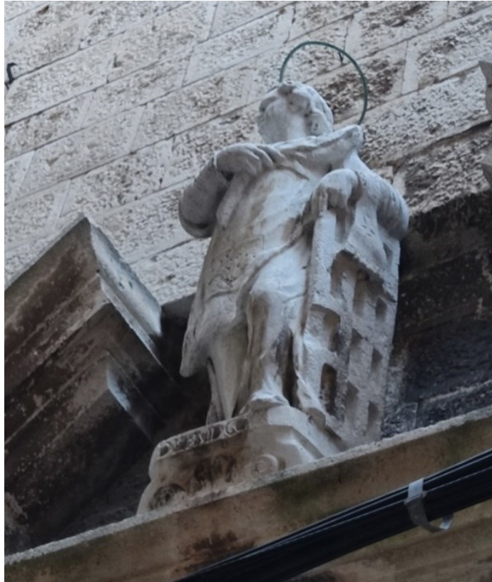
Slika 46: kip svetog Lovre, timpanon južnog portala