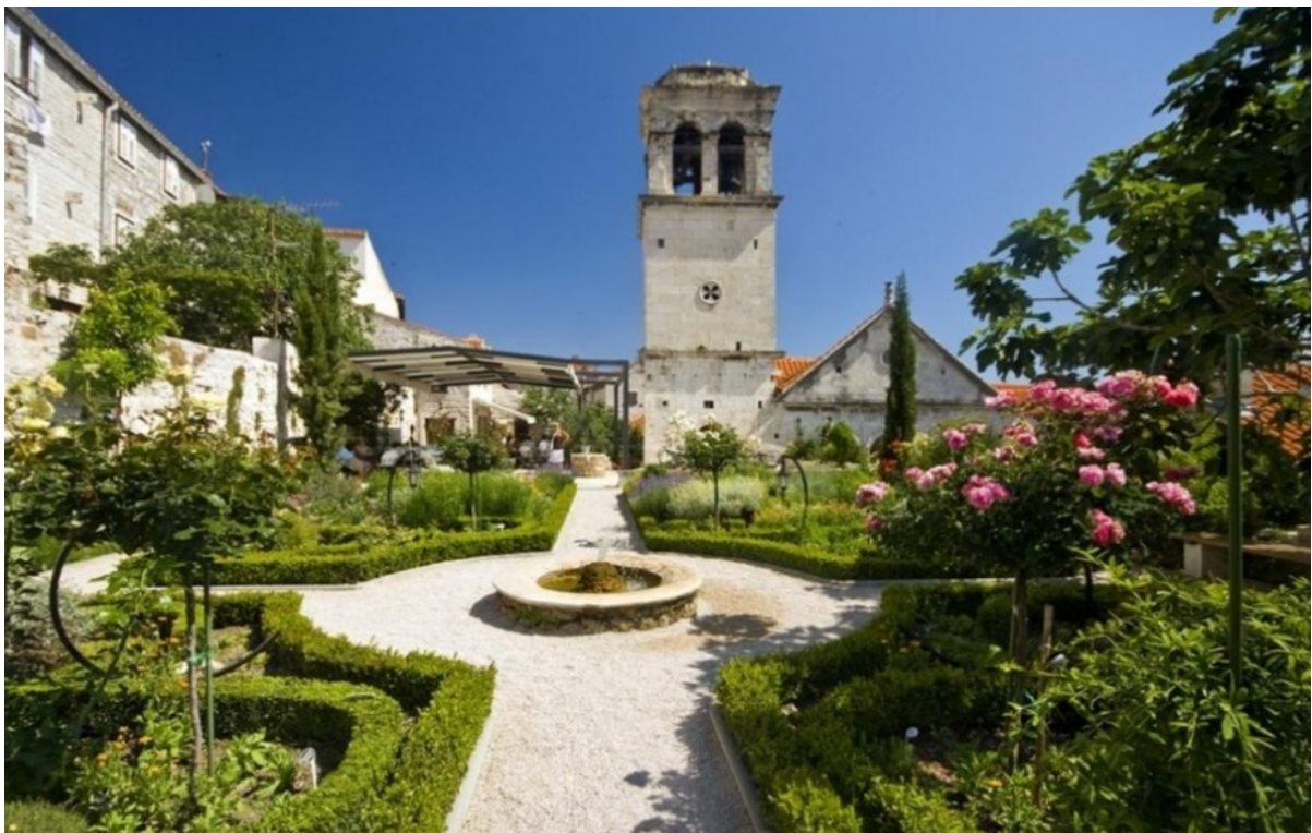
Slika 15: Izgled zvonika prije obnove

Sa sjeverne strane crkve nalazi se zvonik čija je točna godina izgradnje nepoznata. Njegovo prvo uređenje bilo je 1785. godine kada je donesena odluka da se učvrsti i prepravi te da mu se da završni oblik. Za te radove nacrt je napravio član ugledne trogirске obitelji graditelja i kipara, Frano Macanović, te je potpisao ugovor prema kojem je uređenje zvonika trebalo biti gotovo do listopada 1785. godine. 58 Zvonik je tako dobio tri etaže odvojene razdjelnim vijencem. Prva i druga etaža su vrlo jednostavne samo s malim okruglim otvorom po sredini, dok su na gornjem dijelu zvonika bila smještena zvona, a zvonik je imao i baroknu kupolu s istaknutim rebrima i vitkim završetkom. Prema inventaru iz 1711. godine u zvoniku su se nalazilo jedno veliko i dva veoma mala zvona. 59 Za vrijeme bombardiranja Šibenika u Drugom svjetskom ratu zvonik je bio jako oštećen, naročito kupola u obliku lukovice koja je bila cijela uništena, no radovi poslije rata bili su jako površni. Nedavno se radilo na obnovi zvonika, a prilikom tih radova zvonik je ostao bez gornjeg dijela u kojem su bila smještena zvona.