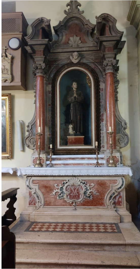
Slika 31: Prikaz cijelog oltara

Na oltaru možemo prepoznati tipične odlike koje pripadaju opusu dalmatinske radionice Pia i Vicka dell' Acque: jednostavna tipologija, arhitektura retabla kao dominantna komponenta kojoj su podređene ukrasne pojedinosti, visoki i vitki bočni stupovi od crvenkastog, prošaranog mramora koji završavaju s kompozitnim kapitelima, stipes od višebojnog mramora ukrašen lišćem, anđeoske glavice u tjemenu lučnog otvora te ukrasne pojedinosti koje pridonose što većoj dekorativnosti.