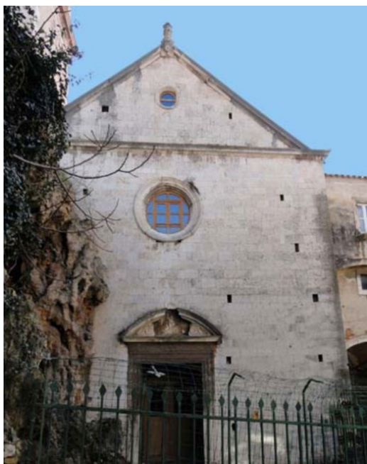
Slika 8: Pročelje crkve

profilirani portal sa skromnim ali lijepim baroknim nadvratnikom. Na donjem dijelu dovratnika izrezbaren je motiv cvijeta. U kutevima otvorenog timpanona nalaze se volute, a na samom vrhu u tjemenu luka nalazi se motiv školjke, dok ostalog ukrasa nema.