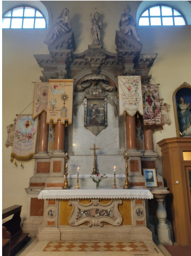
Slika 19: Prikaz cijelog oltara