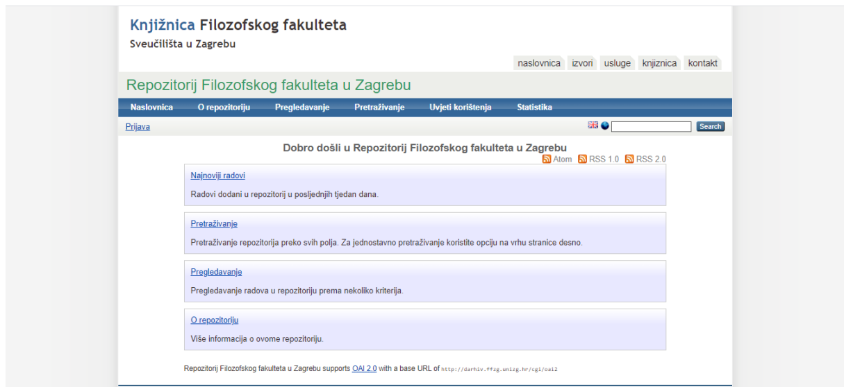
Slika 3. Prikaz sučelja stare stranice repozitorija Filozofskog fakulteta.

Repozitorij Filozofskog fakulteta se u listopadu 2019. godine priključio platformi Dabra, no sama institucija, točnije knjižnica Filozofskog fakulteta, osnovala je repozitorij još 2006. godine te je ta stranica još uvijek aktualna sa starijim radovima ( http://darhiv.ffzg.unizg.hr/ ). Predviđeno je, međutim, da se svi radovi prebace u novi repozitorij.