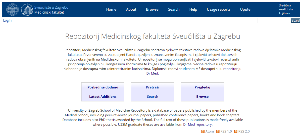
Slika 5. Prikaz sučelja Repozirotorija Medicinskog fakulteta Sveučilišta u Zagrebu

radovi u Dabru, a ostali znanstveni radovi članova Medicinskog fakulteta dostupni su u prvotnoj bazi.