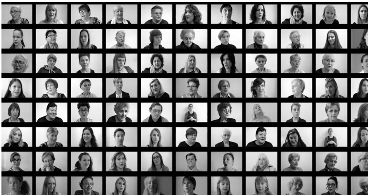
Slika 1. Od 5 do 95. Izrezano iz videa: https://www.youtube.com/watch?v=XwNb8n3Pq7Y&t=953s

Motivacija projekta je poticanje međugeneracijskog dijaloga. Autorice tu potrebu sažimaju u sljedećoj konstataciji: „U konzervativnom društvu kakvo je hrvatsko o nekim se imanentno ženskim iskustvima uopće ne govori, a neke se vrijedne životne lekcije prenose isključivo usmenom predajom s koljena na koljeno“ 5 . Ovaj projekt usmjerio mi je pažnju na postojanje ženske usmene predaje koja za svrhu ima odgoj druge žene. Osvijestila sam i da je odnos sa majkom, sestrama i prijateljicama definirajući za kasnije doživljavanje ženske komunikacije i solidarnosti.