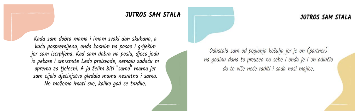
Slike 6 i 7. Ispovijedi pod #JutrosSamStala.

Uz ova istraživanja dodala bih i čestu sintagmu, koju koriste muškarci i žene: „Pomaganje muža ženi oko kućanskih poslova“. Smatram da ona zorno dokazuje kako je vezanost žena za privatnu sferu života i dalje činjenica. Koliko to onemogućava žene u posvećivanju profesionalnom životu, pomaže nam predočiti i kalkulator 16 , koji je izradila organizacija UN Women. Pomoću njega možete izračunati koliko ćete vremena provesti radeći neplaćene kućanske poslove tijekom života. Prema tim izračunima žene u prosjeku provedu 10 godina obavljajući takve poslove dok muškarci provedu četiri godine. Iz ovih istraživanja vidljivo je kako se o kućanskim poslovima može govoriti kao o vrsti kontrole ženskoga vremena čime se onemogućava njihovo ostvarivanje u javnoj sferi života. Ovdje držim važnim spomenuti i akciju Mreže „4. smjena – nevidljivi rad“ koja je 01. rujna 2021. pokrenula kampanju na društvenim mrežama putem #JutrosSamStala. Kampanja ima za cilj osvijestiti javnost o neplaćenom kućanskom radu koji uglavnom obavljaju žene, kao što je i dokazano prethodno iznesenim istraživanjima. Cilj kampanje je prikupiti priče o neplaćenom kućanskom radu putem društvenih mreža Instagram, Facebook, Twitter ili putem e-maila. Nakon čega se priče na istim društvenim mrežama i objavljuju.