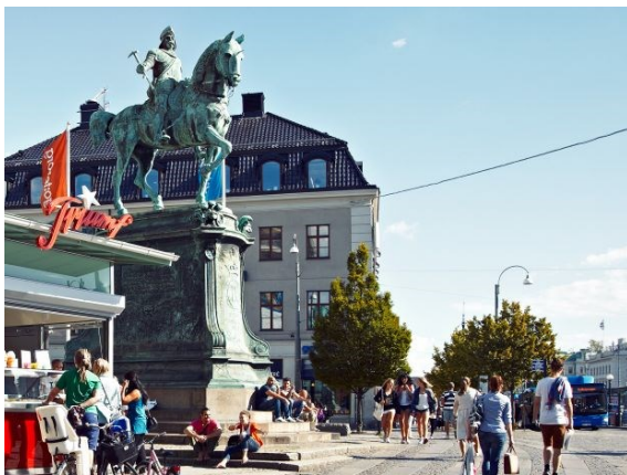
Karl IX på sin kopparmärta - en klassisk mötesplats för göteborgarna.

Göteborg grundades år 1621 av Gustaf II Adolf men det var inte den första staden vid Göta älvs mynning. På slutet av 1400-talet anlades Nya Lödöse som var en viktig handelsstad för Sverige. Nya Lödöse låg på den plats där Gamlestaden ligger idag. Efter att Göteborg tagit över allt mer som västkustens storstad minskade dock Nya Lödöses betydelse och blev i folkmun den ”gamle staden”. Idag pågår en stor arkeologisk utgrävning som ska lära oss mer om Nya Lödöse .