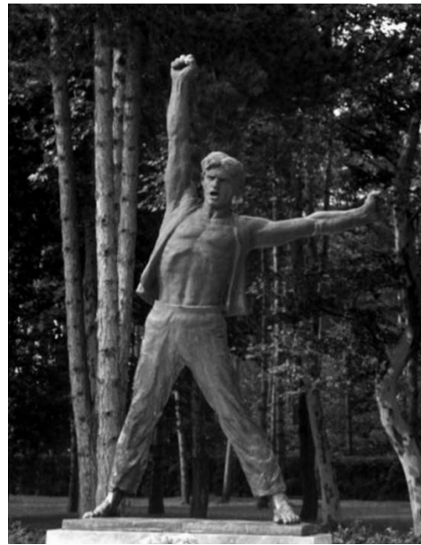
Slika 2. Vojin Bakić, Poziv na ustanak (1946.-1947.)