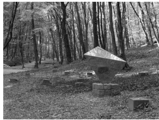
Slika 6. i 7. Kristalni oblici, Dolina grobova u Dotrščini, Zagreb