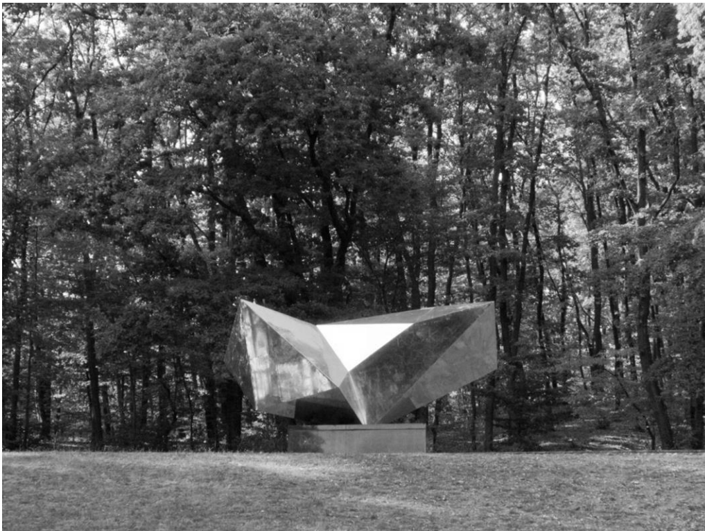
Slika 8. Vojin Bakić, Spomen-obilježje u Dotrščini (1964.-1968.)

njegovo trenutno stanje i status govore o nedovoljnoj osviještenosti šire zajednice o simboličkoj, povijesnoj i umjetničkoj vrijednosti mjesta koje se nalazi u njihovom susjedstvu. Briga o Dotrščini spala je na pojedince i volontere koji ulažu napore kako bi park bio održavan i čist. Prepuštena je propadanju, mladenačkom, ali i usmjerenom vandalizmu pojedinaca koji grafitima, natpisima i drugim destruktivnim akcijama svakodnevno nagrđuju i dodatno narušavaju opstale spomenike. 120