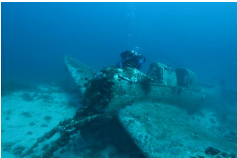
Slika 12. Zrakoplov tipa JU-87 pokraj Žirja

Ju 87 talijanske vojske izvela napad na mornaricu Kraljevine Jugoslavije i da su dva zrakoplova oborena, pri čemu je jedan od njih sletio na more, što je definitivno pronađeni primjerak.