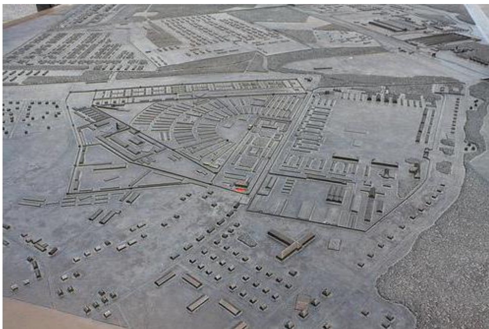
Slika 9. Tlocrt koncentracijskog logora Sachsenhausen

Sovjetskog logora. Nije bilo moguće izvesti klasično iskopavanje te su jame ispražnjene pomoću bagera. Nakon pražnjenja nalazi iz jama bili su podijeljeni u nekoliko kategorija: gradnja, odjeća, higijenske potrepštine, kućni predmeti, militarija, novac i ostalo. Dataciju za pojedine predmete vrlo je lako provesti zbog predmeta koji su lako prepoznatljivi po natpisima drugih jezičnih skupina ili godina. Tijekom smještanja predmeta u navedene kategorije arheolozi su došli do zaključka da se predmeti mogu podijeliti u dvije glavne skupine, po sjećanju na osobe. Pod sjećanjem na osobe smatra se da je moguće spojiti kvalitetu i namjenu korištenja predmeta sa statusom i značenjem osobe. Predmeti koji su bili vrlo jednostavni, poput običnih žlica niske kvalitete, rukotvorina zatvorenika i dječjih igračaka mogu se povezati s nemoći, ugnjetavanjem i poniženjem nastradalih osoba, dok se predmeti poput kaciga, raskošno ukrašenih noževa i militarije mogu povezati s nadmoći počinitelja.