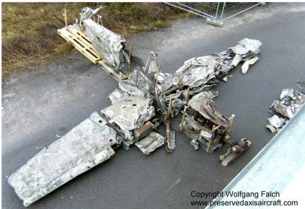
Slika 5. BF 109 E-3 nakon otkupa i sastavljanja

vratolomija pilota 1939. godine, a pilot je poginuo pri padu. Pri padu je olupina ostavljena ondje gdje se srušila i izvučeno je samo tijelo pilota. 43