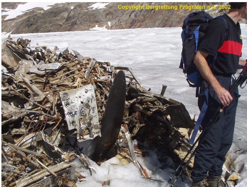
Slika 4. Stanje olupine pri istraživanju 2002. godine

kontaktirao je Sabinu Falch i Wolfganga Falcha za suradnju na istraživanju zrakoplova. Sabina Falch je pomoću iskaza svjedoka koji su se sjećali spašavanja posade i arhivskog istraživanja došla do pilota koji su spasili originalnu posadu i fotografirali mjesto pada 1941. godine. Ostatak ekipe je u međuvremenu transportirao olupinu zrakoplova. Uspjeli su rekonstruirati olupinu skoro u potpunosti. Među ostacima olupine pronašli su osobne predmete posade aviona. 41