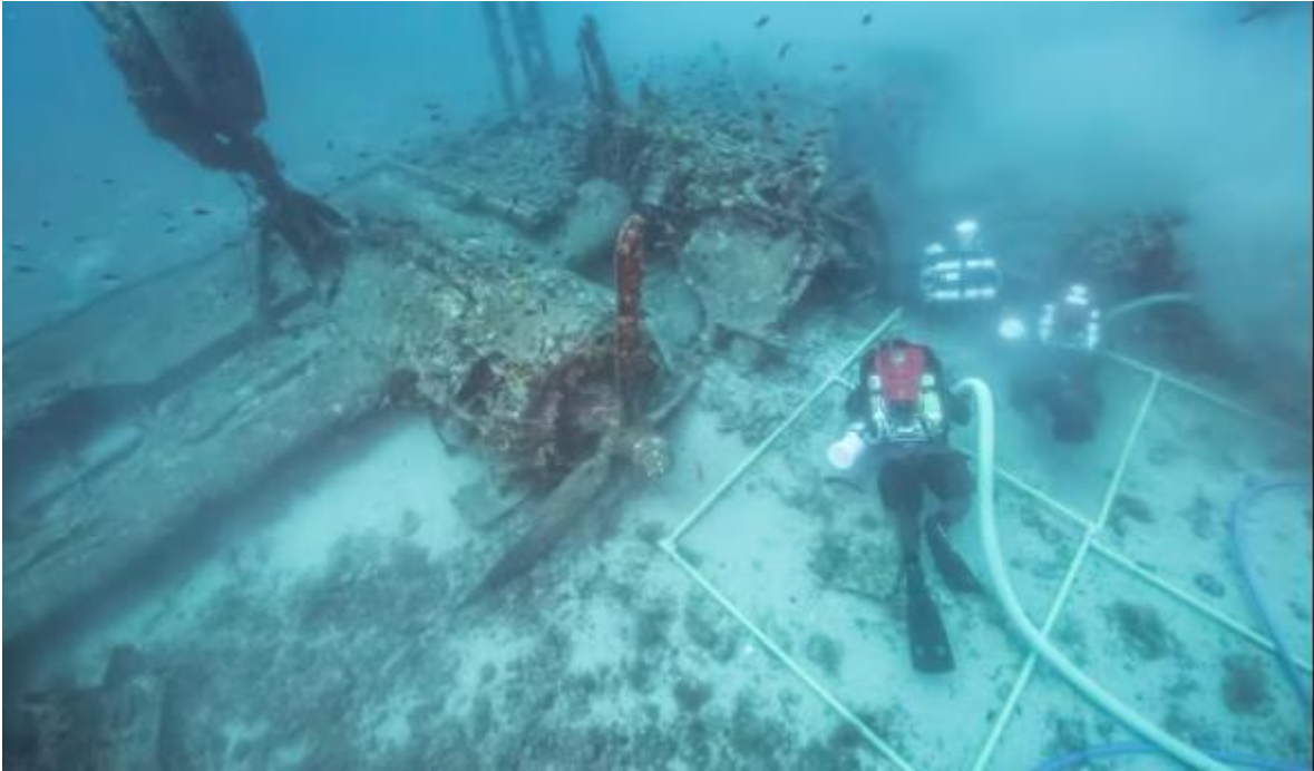
Slika 11. Potonuli B-52 bombarder tijekom istraživanja kod Visa

nisu bili u stanju za uspješno slijetanje, pa bi završili u obližnjem moru. U blizini Visa tako se može pronaći nekoliko olupina američkih bombardera i zrakoplova lovaca na različitim dubinama i u različitim stanjima očuvanosti.