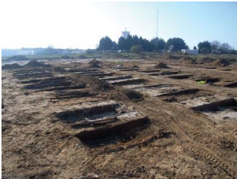
Slika 7. Logor za vojne zarobljenike La Glacerie tijekom istraživanja

Logor La Glacerie korišten je odmah nakon Drugog svjetskog rata te je ubrzo u potpunosti uništen, 1946. godine. Svi nalazi pri iskopavanju logora pronađeni su u slojevima zatrpavanja. Pri iskopavanju logora La Glacerie 46 otkriveni su skoro isključivo artefakti koji su mogli biti interpretirani kao da su zarobljenici ondje bili smješteni bez ikakvih osobnih predmeta te da su bili ubijani i zbog najmanjih sitnica. Naime, većina pronađenih materijalnih dokaza bile su čahure metaka i gumbi, tj. metalni predmetni.