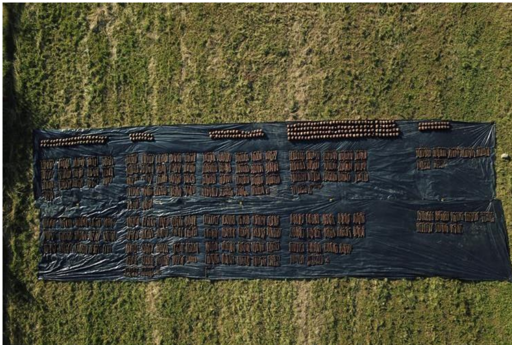
Slika 15. Ekshumirani ostatci 814 osoba tijekom istraživanja provedenih 2020. godine

je ekshumirano 814 osoba. Tijekom istraživanja 2020. godine pokušale su se utvrditi i lokacije ostalih jama, koje bi po izjavama očevidaca trebale biti u blizini, no pri iskapanju četiri probne sonde nisu pronađene nikakve naznake ostalih jama. 68