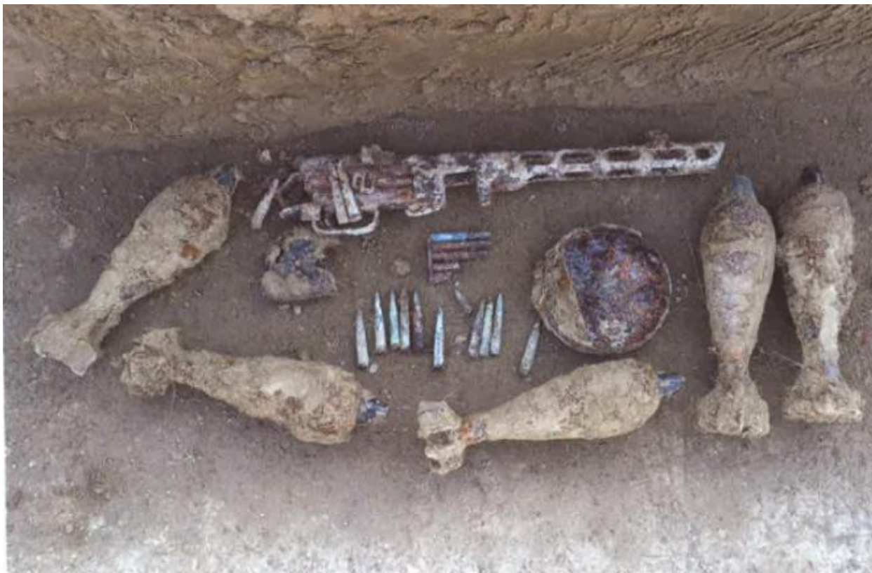
Slika 14. Dio naoružanja i streljiva pronađenog na Batini