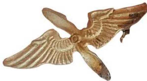
Slika 3. Dio pilotske značke koja je pripadala poručniku McGowanu