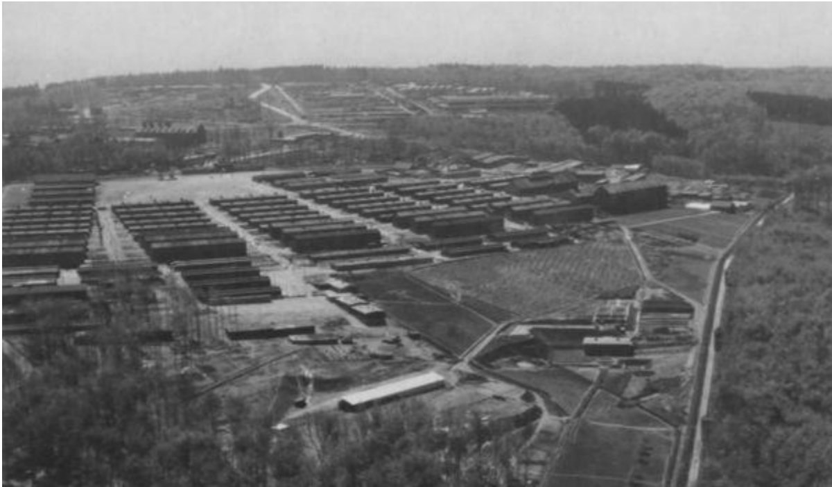
Slika 10. zračna fotografija Buchenwaldskog logora

otpada, pogotovo u kasnijim fazama njihova postojanja. Prilikom iskopavanja sonde veličine 4 x 4 metra pronađeno je preko 2,5 tisuće predmeta i preko 4 tisuće komada gumba. Arheolozi su za Buchenwald napravili podjelu predmeta na drugačije vrste od one za Sachsenhausen: logorski nalazi, internacionalni nalazi (nalazi čije je podrijetlo izvan Njemačke), lokacija nalaza te nalazi vezani uz rad, medicinu, higijenu, hranu, nakit, vjeru, razonodu, žene, djecu i kategorije poput brojeva, imena, transporta (tračnice, prijevozna sredstva) i smrti (predmeti povezani uz provođenje ubijanja i odlaganja tijela pokojnika).