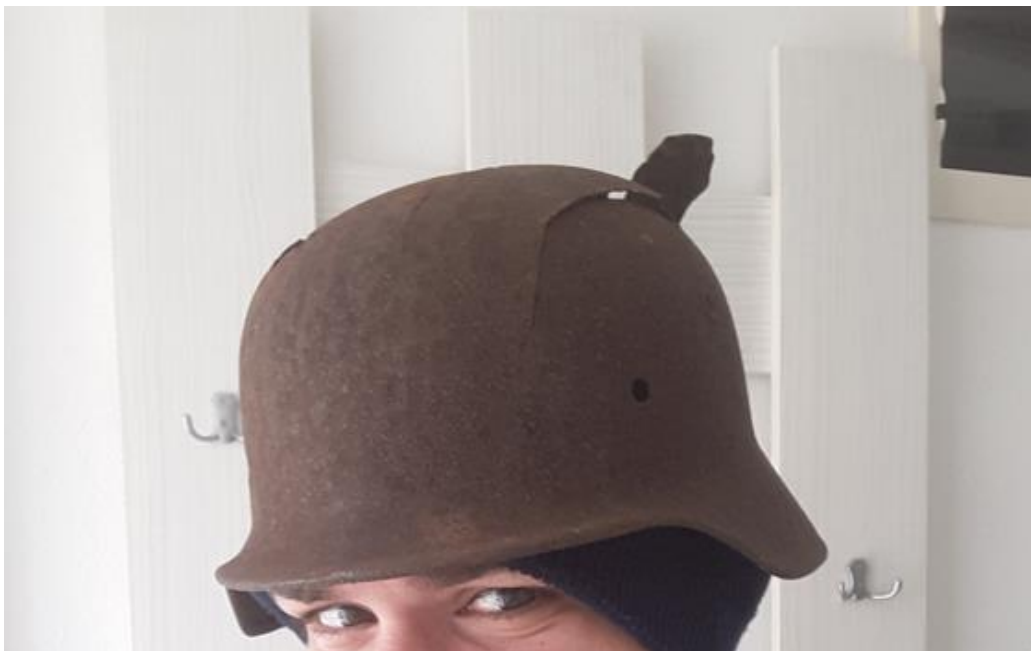
Slika 16. Kaciga tipa Stahlheim pronađena na otoku Braču u blizini mjesta Sumartin

Veliki problem kod istraživanja nedavnih pojedinačnih grobova i masovnih grobova je velika politizacija događaja vezanih uz Drugi svjetski rat i Domovinski rat. Navedena istraživanja objavljena su u novinama i na web-portalima. Političari i građani odmah su ušli u rasprave u vezi partizana i ustaša te događaja u Drugom svjetskom ratu. Ista reakcija dobiva se i otkrivanjem žrtava Domovinskog rata. Ne raspravlja se o obiteljima koje desetljećima traže svoje nestale članove obitelji i prijatelje. Redovito se ulazi u rasprave koje su često nacionalistički orijentirane. Zbog ovakvih se rasprava otežava provođenje istraživanja ovog tipa. Otežana je objava radova u Hrvatskoj zbog moguće negativne reakcije javnosti. Trebalo bi povući crtu između znanstvenog istraživanja i političkih reakcija koje se odražavaju na javnost.