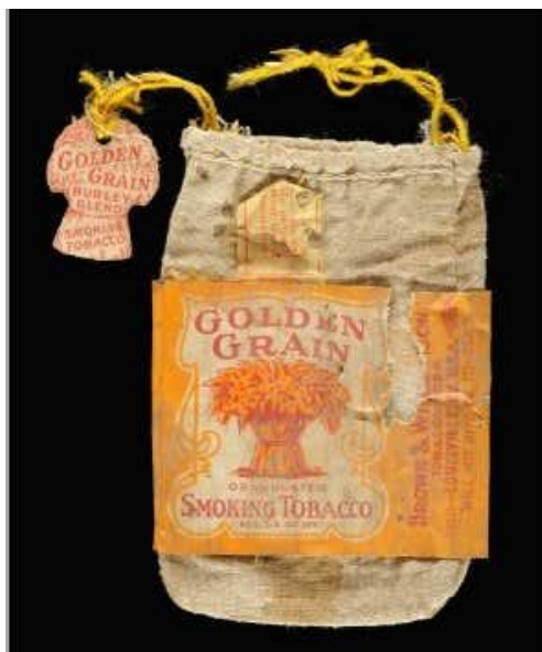
Slika 8. Vrećica duhana od tkanine pronađena u logoru Vandœuvre-lès-Nancy