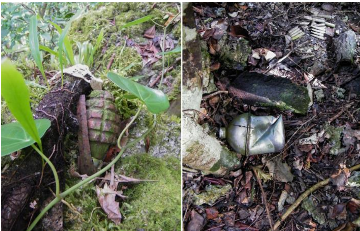
Slika 2. Površinski nalazi na Peleliu

6 tisuća tona artiljerijske municije i iz aviona je bačeno preko 800 bombi, ispućano je preko 16 milijuna metaka i baćeno preko 116 tisuća rućnih granata, 32 i to sve samo s amerićeke strane. Nakon rata lokalno je stanovništvo izbjegavalo mjesta borbi te su ona u potpunosti obrasla raslinjem. Danas se predmeti povezani s bitkom mogu pronaći u poljima, špiljama, na brežuljcima i, zapravo, na cijelom otoku. Arheološka djelatnost može se odviti uz pomoć gotovo isključivo terenskog pregleda jer se skoro svi predmeti nalaze na površini.