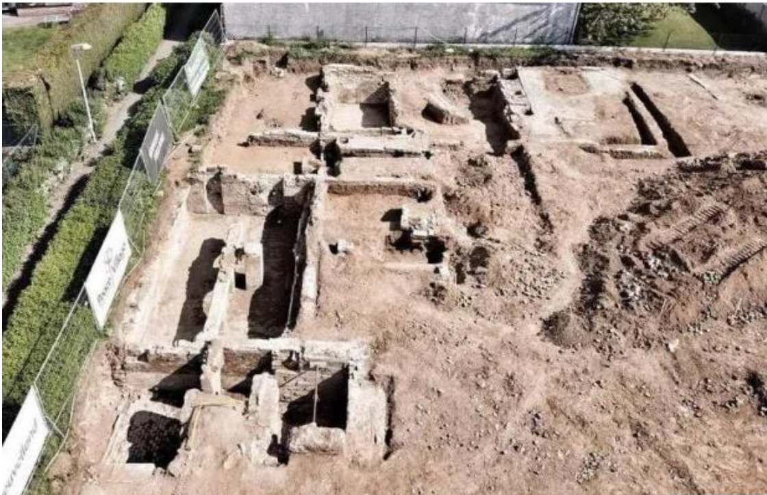
Slika 1. Dio rovova na poziciji Wijtschate

satova i hrane koju su vojnici dobivali od kuće. 28 Uz sve ovo pronađeni su i savršeno očuvani rovovi, stupovi koji su držali bodljikavu žicu te čak i cijeli njemački reflektor koji je osvjetljavao ničiju zemlju. Svaki rov, krater od bombe i topografska promjena zabilježeni su arheološki i dokumentirani su za buduće generacije. 29 No ipak, ovaj savršeni primjer iskapanja imao je i jedan problem, a to je da je jedini način za dobivanje financija bio donacijama putem crowdfunding -a. 30