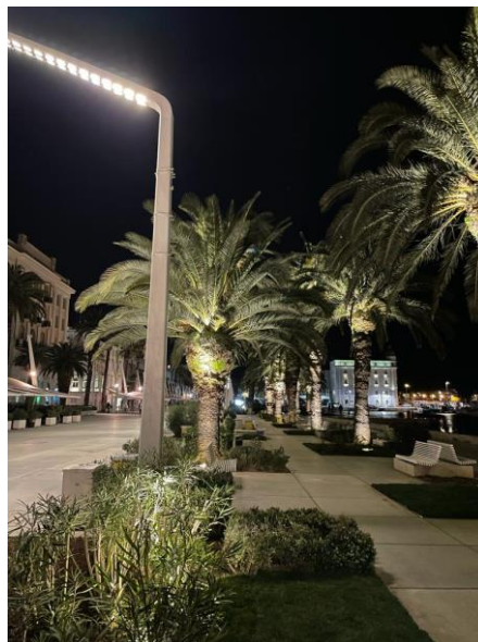
Sl. 30. Riva (zeleni dio uz more), 6. 2. 2020.