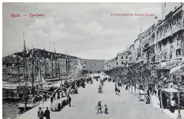
Sl. 1. Riva na početku 20. stoljeća, preuzeto s:

Kečkemet (1999) navodi da oblik rive kakvu danas poznajemo dolazi s početka 19. stoljeća dok je hrvatska bila pod francuskom vlašću, te je idejna zamisao rekonstrukcije ondašnje rive došla od strane maršala Marmonta. Prema Borčić i Mrkonjić (2014), Marmont je zaslužan najviše za nasipanje i izgradnju zapadnog dijela Rive. Na fotografijama koje su uslikane tijekom 19. i početkom 20. stoljeća se vide stare kućice (potleušice) uz južno pročelje palače koje su izgradili splitski pomorci i trgovci koje su služile kao obiteljske kuće, ali kao i trgovine npr. mrežama za ribolov. Početkom 20. stoljeća, odnosno u periodu između 1900. i 1930. godine se počinje raditi na sanaciji kućica uz zidine palače. Radilo se na obnovi pročelja palače na kojoj su kućice bile naslonjene, te su stare i trošne građevine srušene i izgrađene nove prema ideji arhitekta Kellera kako bi se uklopile bolje u ambijentalni izgled tog prostora (Borčić i Mrkonjić, 2014). Osim toga, u periodu 20ih godina 20. stoljeća splitska riva dobiva električno osvjetljenje koje je zamijenilo dotadašnje petrolejske ferale postavljene sredinom 19. stoljeća.