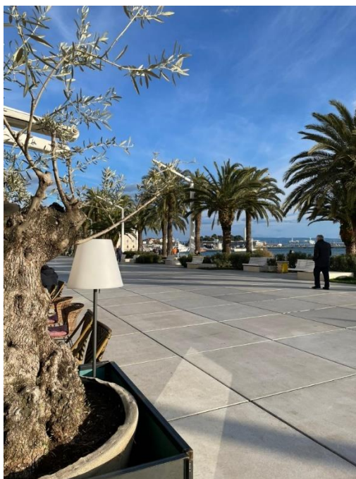
Sl. 23. Riva (6), 20. 1. 2020.