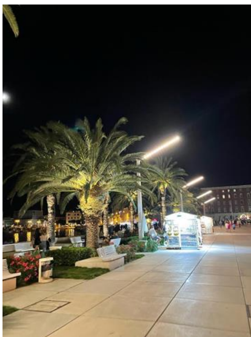
Sl. 16. Riva (zeleni dio uz more), 25. 7. 2019.