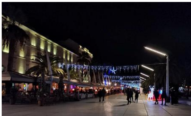
Sl. 24. Riva (zapadni vrh šetnice), 15. 12. 2019.