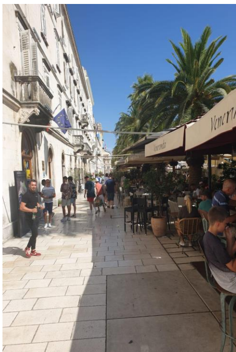
Sl. 11. Riva (5), 12. 7. 2019.