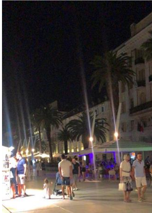
Sl. 13. Riva (12), 18. 7. 2019.