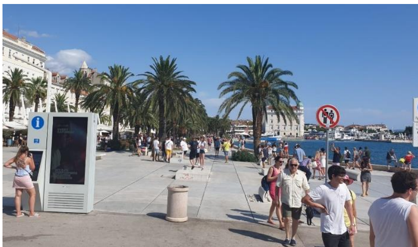
Sl. 9. Riva (zapadni vrh šetnice), 8. 7. 2019.