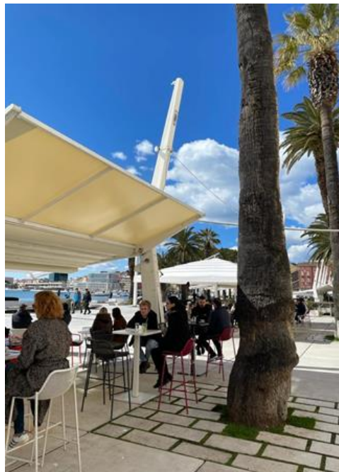
Sl. 22. Riva (12), 18. 1. 2020.