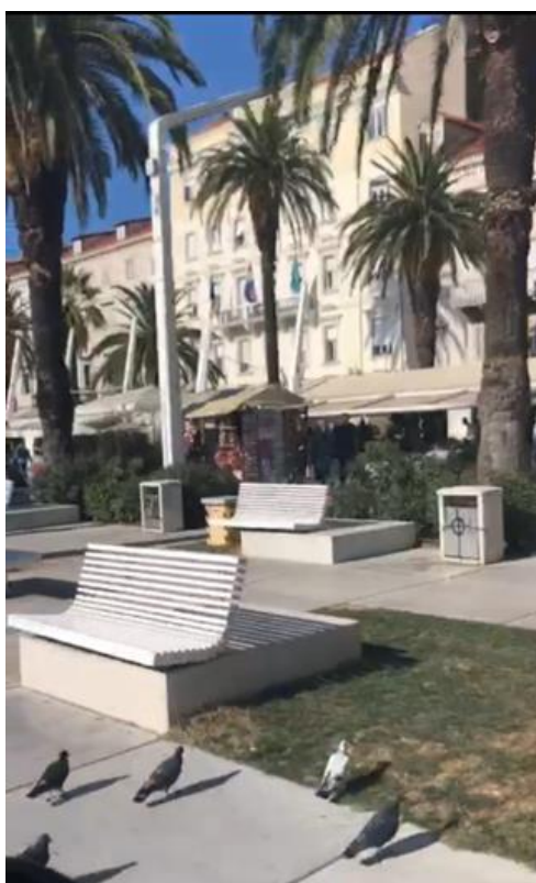
Sl. 12. Riva (zeleni dio uz more), 15. 7. 2019.