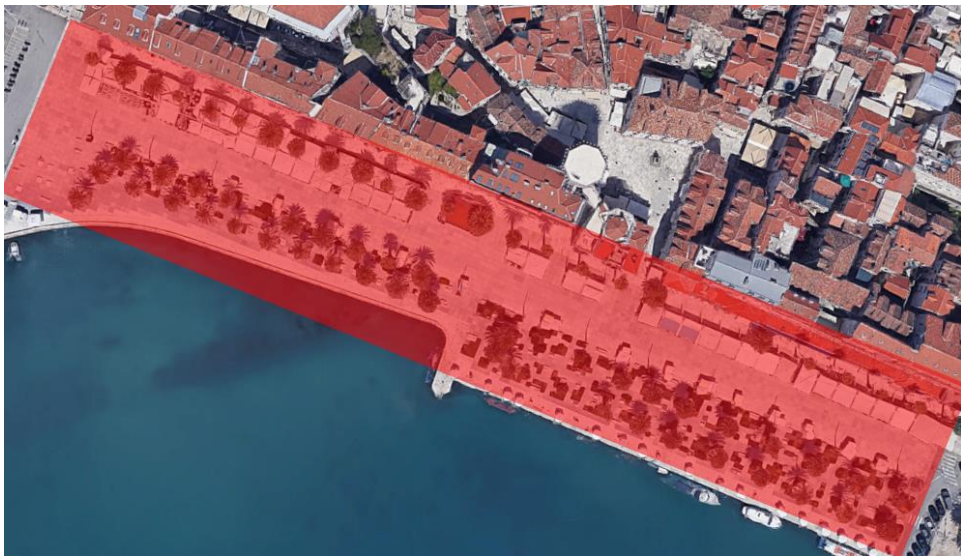
Sl. 6. Područje obuhvaćeno promatranjem označeno crvenom bojom, preuzeto s: https://goo.gl/maps/WupYm2jYNby9A14Q9

Promatranje je vršeno na prostoru splitske rive, službenog naziva Obala Hrvatskog narodnog preporoda u vremenskom periodu od lipnja, srpnja i kolovoza 2019. godine i prosinca 2019. godine, te siječnja i veljače 2020. godine. Promatranje se vršilo u ljetnom i zimskom periodu i to je omogućilo uvid u razlike između perioda turističke sezone koja obuhvaća ljeto i zime koja je najviše obilježena događanjem „Advent u Splitu“ u prosincu i siječnju i zaključno veljačom, kada nema više organiziranih događanja na prostoru Rive. Usporedba ljetnog i zimskog vremenskog perioda je omogućila uvid u razlike koje se događaju na prostoru Rive u kontekstu različitosti između aktera koji posjećuju prostor rive, njihovih aktivnosti, interakcije, prohodnosti/posjećenosti prostora i konteksta unutar kojega se navedene stavke odvijaju. Cilj ovog promatranja je bio dobiti uvid u društvene i prostorne odnose koji se odvijaju u različitim vremenskim periodima. Tablica promatranja se nalazi u prilogu zajedno s fotodokumentacijom promatranja.