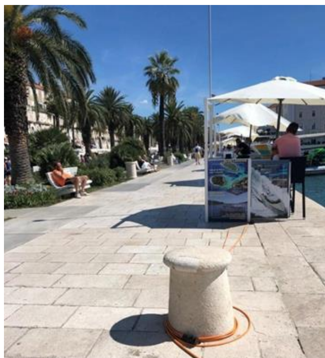
Sl. 8. Riva (zeleni dio uz more), 2. 7. 2019.