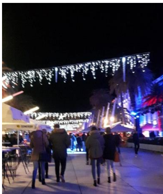
Sl. 26. Riva (12), 20. 12. 2019.