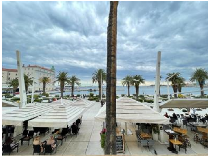
Sl. 14. Riva (20), 19. 7. 2019.