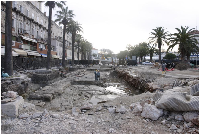
Sl. 3. Arheološka iskopavanja u vrijeme rekonstrukcije rive 2006./2007. godine, preuzeto s: https://www.mhas-split.hr/istrazivanja/arhiva-istrazivanja/artmid/934/articleid/66/arheolo%C5%A1ka-istra%C5%BEivanja-na-splitskoj-rivi-2006-%E2%80%93-2007-godine

Od te posljednje izmjene do danas nije bilo nijedne nove modifikacije izgledu Rive.