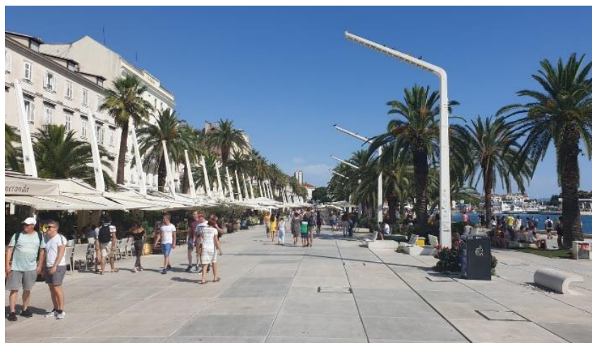
Sl. 7. Riva (pogled prema istočnoj strani), 1. 7. 2019.