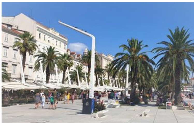
Sl. 19. Riva (zapadni vrh šetnice), 1. 8. 2019.