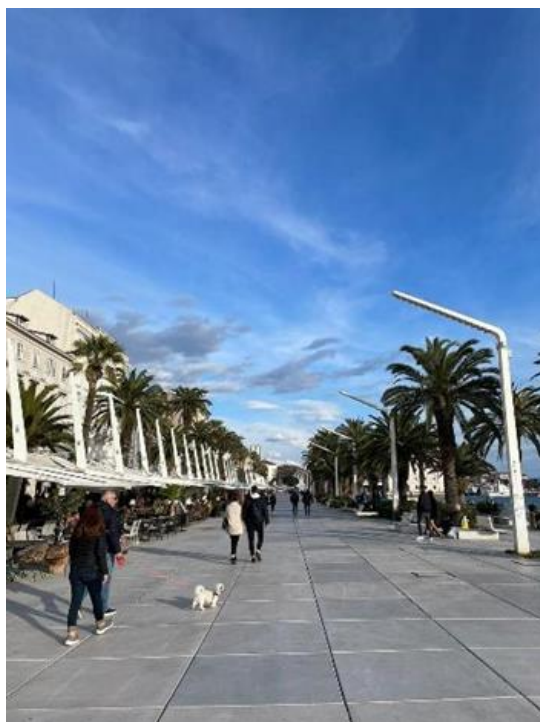
Sl. 25. Riva (zapadni vrh šetnice), 28. 1. 2020.