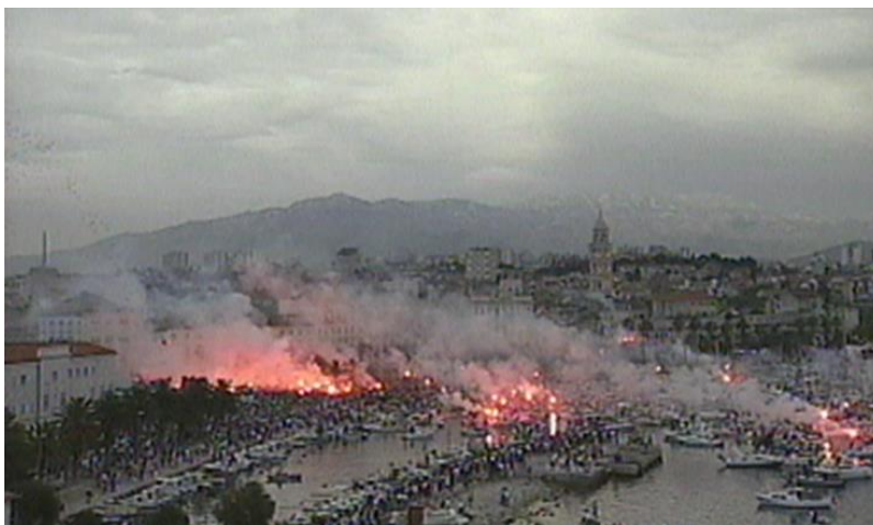
Sl. 4. Doček Gorana Ivaniševića u Split 2001. godine

procesiju preko rive povodom blagdana Svetog Duje. Takva „prirodna simbolizacija“ nekog prostora koja se razvija tijekom vremena je proces koji se odvija uz starenje grada, nagomilavanje različitih povijesnih događaja i samim time što je staro, „oduvijek tako“, dobiva poseban status važnosti u kolektivnoj memoriji korisnika tog prostora (Čaldarović i Šarinić, 2017). Kroz dinamičnu povijest obilježenu smjenama različitih vlasti i režima i posredstvom građana kao aktivnih nositelja urbanog života (Tomić-Koludrović, Tonković i Zdravković, 2014), stvarao se identitet rive koji se preslikao na identitet cijeloga grada.