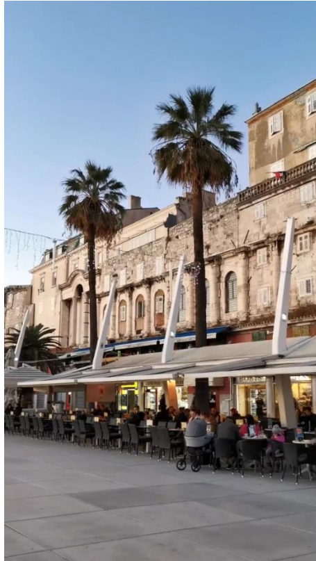
Sl. 27. Riva (6-8), 23. 12. 2019.