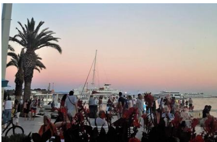
Sl. 20. Riva (zeleni dio uz more), 6. 8. 2019.