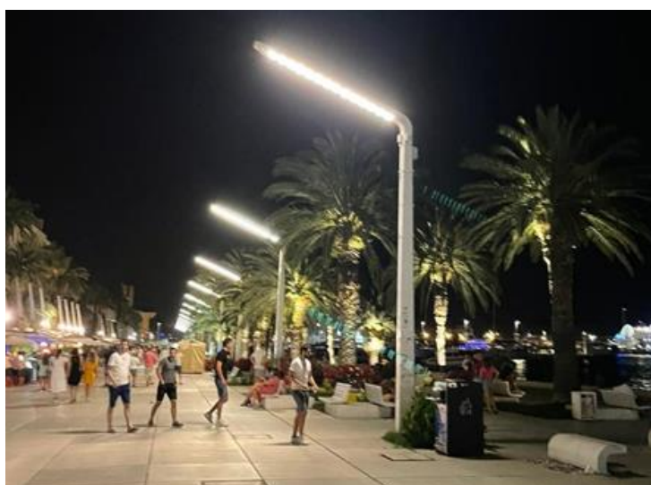
Sl. 18 Riva (zapadni vrh šetnice), 26. 7. 2019.