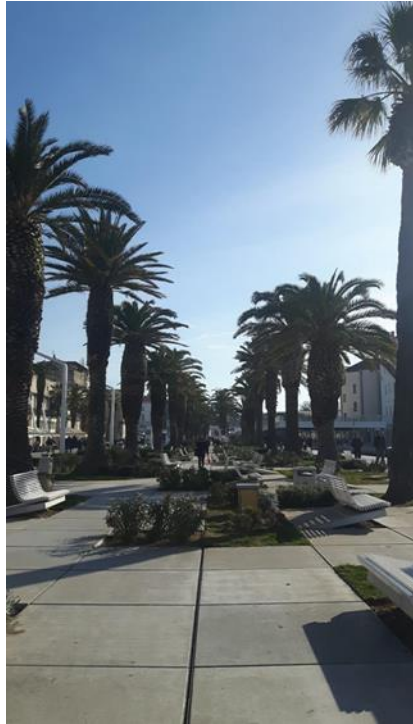
Sl. 29. Riva (zeleni dio uz more), 16. 1. 2020.