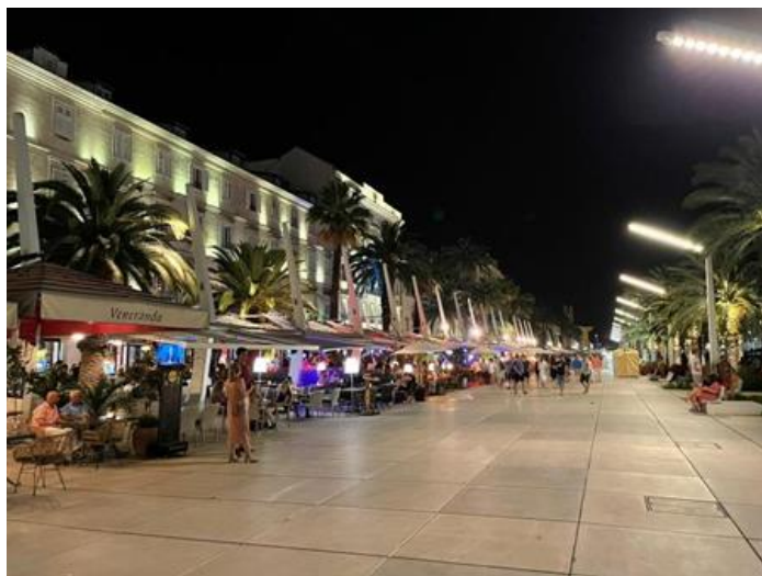
Sl. 17 Riva (zapadni vrh šetnice), 25. 7. 2019.