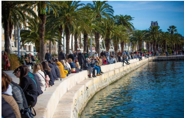
Sl. 5. Split riva 30. siječanj 2021. godine

na taj prostor kao objekt rekonstrukcije i na identitet i vezanost građana koji su tom prostoru davali prvobitno značenje. Drugim riječima, vizualno gubljenje „starog“ izgleda rive je donekle značilo i osjećaja gubljenja povezanosti s osjećajima vezanosti za taj prostor koji su se gradili tijekom stoljeća. Ipak, s vremenom se i „nova“ splitska riva uklopila u kulturnu memoriju i identitet grada zajedno s iskustvom i sjećanjima vezanosti sa starom rivom, te se i danas građani okupljaju na prostoru rive, bilo u kavanama, zbog šetnje ili bivanja u parkovnom dijelu uz more.