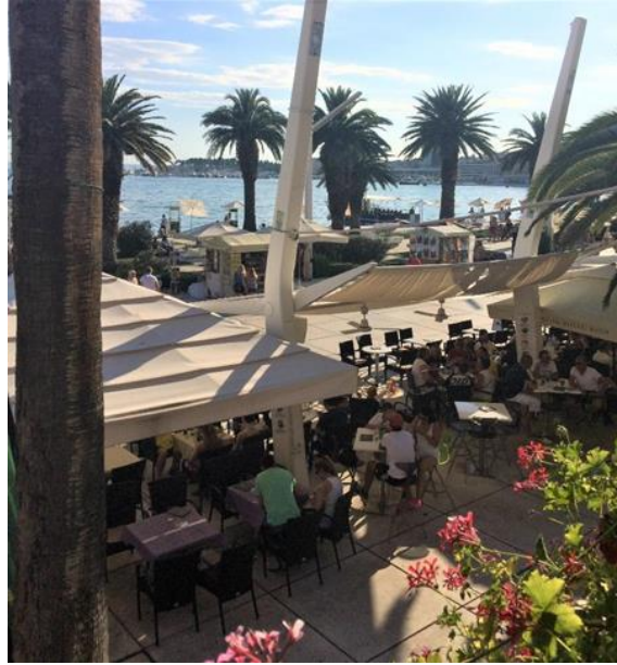
Sl. 21. Riva (1), 10. 8. 2019.