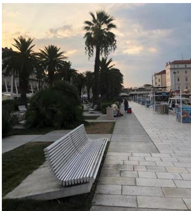
Sl. 10. Riva (zeleni dio uz more), 10. 7. 2019.