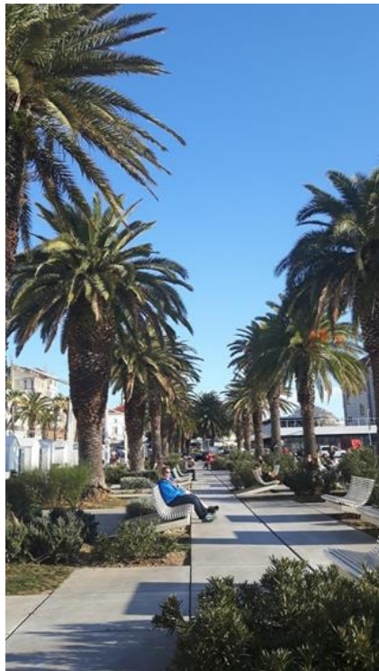
Sl. 28. Riva (zeleni dio uz more), 27. 12. 2019.