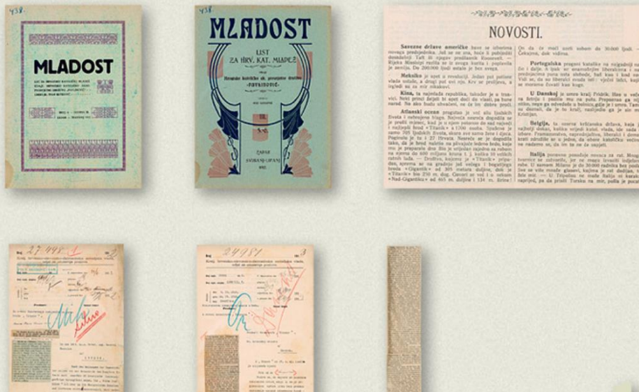
Slika 2: Mrežna stranica izložbe „Hrvati na Titaniku“ Hrvatskog državnog arhiva

Vijest o nesreći Titanica prenijele su sve svjetske novinske agencije, kao i naše novine. Potonuće „nepotopivog“ broda bilo je toliko nevjerojatno da je njemačka novinska agencija Reuter u prvom trenutku javila da je brod nakon sudara sa santom leda nastavio ploviti, te da su ga odvuclili u luku Montreal!