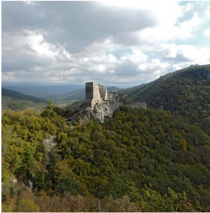
Slika 3: Pogled na utvrdu Petrapilosa kod Buzeta

ekspozicija muzeja kao i pogledi na objekte koji su dio izložbe. Primjer je Slika 3 koja prikazuje pogled na utvrdu Petrapilosa kod Buzeta.