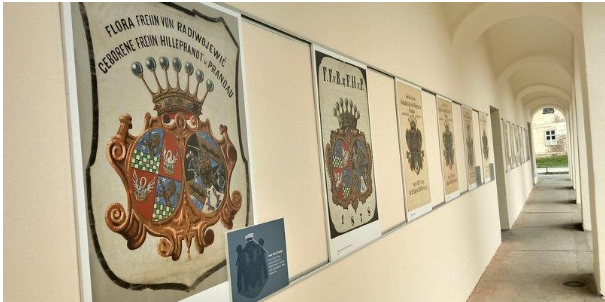
Slika 1: Dio izložbe “Valpovački vlastelini Prandau-Normann“ pod arkadama Državnog arhiva u Osijeku

Ova izložba, nastala u suradnji s Muzejom likovnih umjetnosti, Muzejom Slavonije i Muzejom Valpovštine, prikazuje gospodarstvenu stranu života vlastelina Prandau-Normann putem izlaganja gradiva vodeći se primjerima iz muzeja. Slika 1 prikazuje dio postave izložbe koja je postavljena pod arkadama Državnog arhiva.