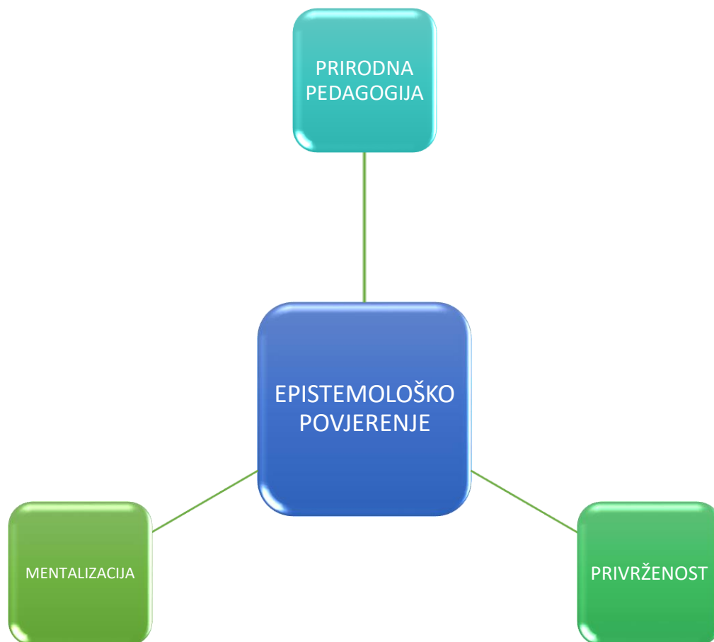
Slika 3: Suodnosi epistemološkog povjerenja

Želja je autorice ovoga rada proširiti pedagojsku teoriju o pedagoškom odnosu koristeći se psihoanalitičkom teorijom epistemološkog povjerenja. Međutim, kako bismo objasnili značaj teorije epistemološkog povjerenja, a onda ga tek doveli u suodnos s pedagoškim odnosom, moramo prije svega objasniti temelje na kojim ta teorija počiva, a to su prije svega, teorija prirodne pedagogije Csibre i Gergelyja , teorija mentalizacije autora Fonagyja i suradnika te Bowlbyjeva teorija privrženosti .