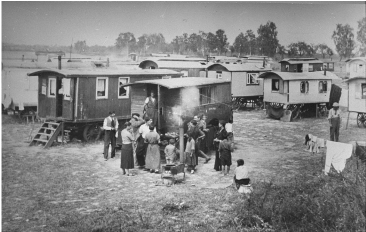
Marzahn, prvi internacijski logor za Rome i Sinte u Trećem Reichu. Njemačka, datum nepoznat (preuzeto s: https://encyclopedia.ushmm.org/content/en/article/documentation-on-the-persecution-of-roma 6. 7. 2021.)

i Sinti internirani na bivše igralište okruženo bodljikavom žicom, nije se smjelo izlaziti nikamo osim na posao, a slično je bilo i u frankfurtskom logoru Dieselstrasse u koji je internirano mnogo Roma i Sinta iz susjednih gradova Darmstadta, Mainza i Wormsa pa je broj porastao i na 200 do 300 ljudi (Ibid: 42, 43). Svaki je logor imao obično po dva policijska službenika koji su nadzirali zatvorenike, i to tako da su ujutro i navečer provodili prozivke za vrijeme kojih se svaki član obitelji morao pojaviti, reći svoje ime i broj članova obitelji te salutirati Heil Hitler , a neposluh se naplaćivao premlaćivanjem, katkad i bičevanjem (Ibid.).