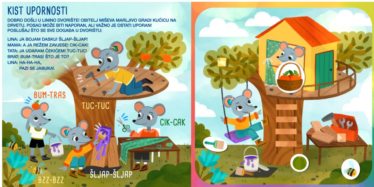
Slika 6. Kist upornosti - prikaz nakon pomicanja interaktivnih sastavnica

Roditelj potiče dijete na traženje i zamišljanje mogućih zvukova na ilustraciji. Osim traženja zvukova, roditelj ohrabruje dijete na imitiranje istih uz popratno korištenje mimike i geste.