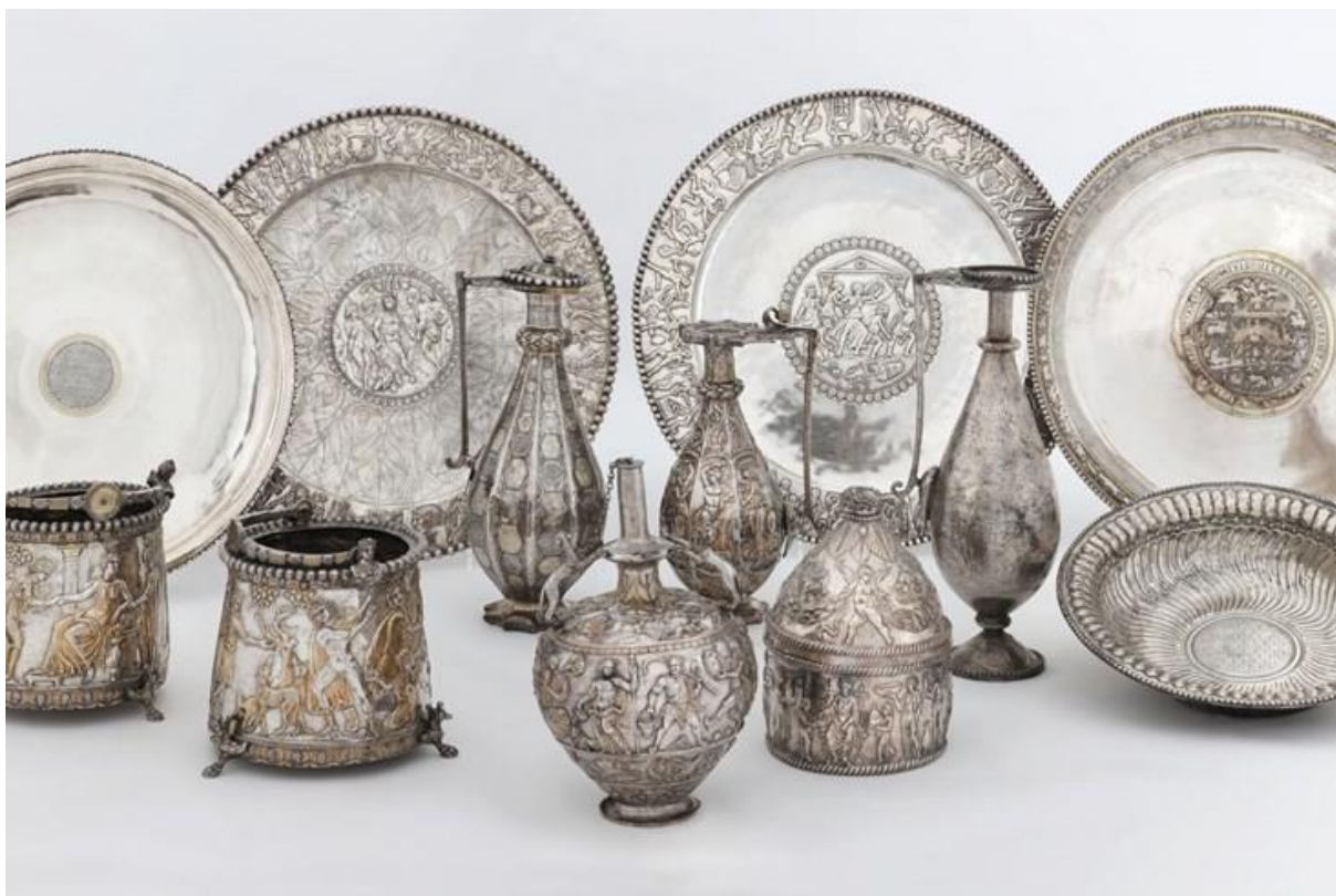
Slika 3 Seusovo blago ( https://www.glasistre.hr/pula/-578212 )

antikviteta 1987. te je naknadno prodano jednom od članova upravnog odbora samog konzorcija. Predmet je bio u posjedu Markiza od Northamptona koji ga je kupio od konzorcija za 9 milijuna britanskih funti. Godine 1990. ih je ponudio na aukciji u New Yorku s libanonskom dokumentacijom, a procijenjena vrijednost je bila 40 miliona dolara, no Llibanonska vlada je rekla kako se radi o krivotvorenim dokumentima te da oni nemaju nikakve veze sa Seusovim blagom. Hrvatska i Mađarska su svojatale blago kao dio svoga kulturnog naslijeđa, ali sud u New Yorku nije priznao vlasništvo niti jednoj državi te je blago vraćeno Markizu od Northamptona. 84 Mađarska vlada je 2014. otkupila 7 od 14 srebrenih posuda, a plaćene su 14 miliona €. 85