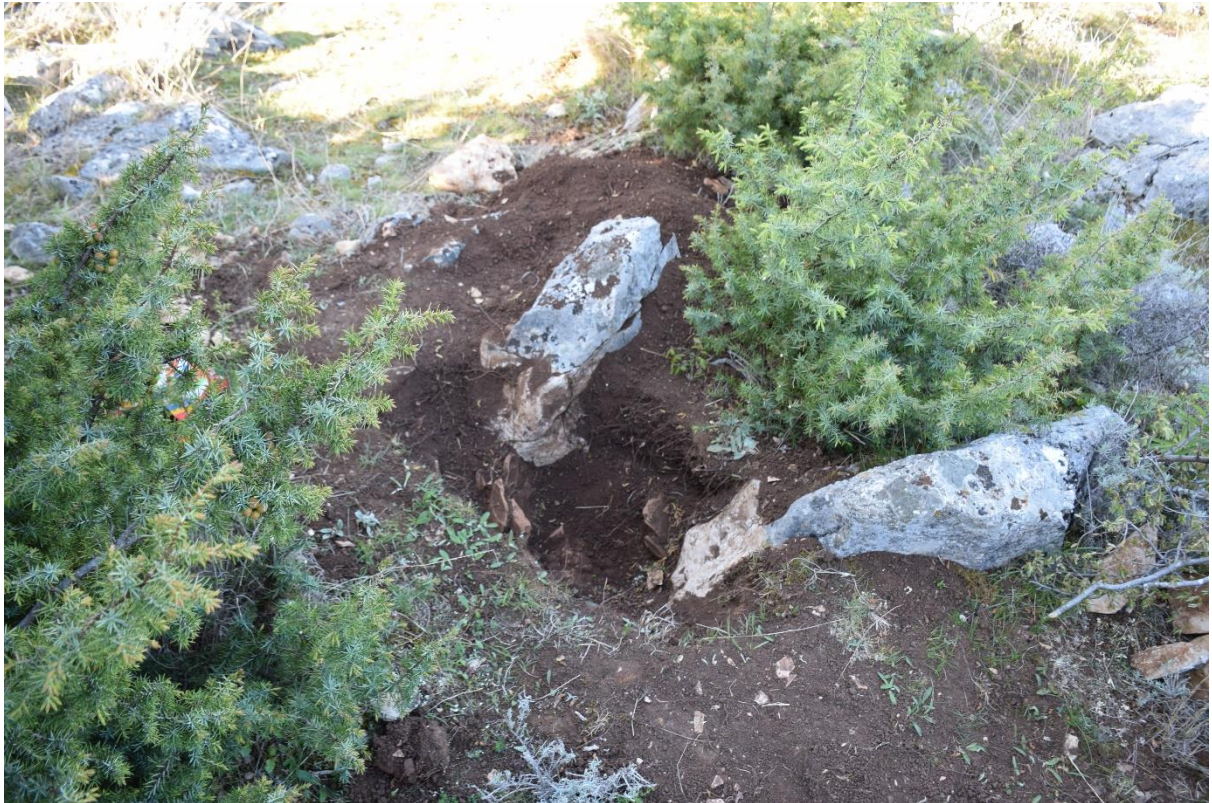
Slika 2 Devastacija arheološkog lokaliteta Cvijina gradina od strane ne stručnih osoba koje koriste detektor metala

Ministarstvo kulture i medija je dalo priopćenje u kojem navode da je na područjima koja su upisana u Registar kulturnih dobara RH strogo zabranjeno ikakvo iskapanje bez odobrenja Ministarstva, ali sukladno navedenom, na područjima koja nisu zaštićena kao kulturna dobra, svi predmeti koji se nađu, a pretpostavlja se da su kulturno dobro, nebitno jesu li pronađeni u zemlji, moru ili vodi, vlasništvo su Republike Hrvatske te se moraju prijaviti Ministarstvu kulture i medija. 57