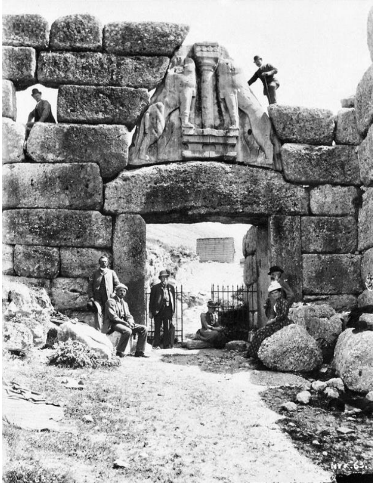
Slika 1 Heinrich Schliemann-ova u Miken

U razdoblju od 18. do 20. st. kulturna baština je bila u rukama onoga tko ju je iskopao. Tako su tadašnji arheolozi koji su vršili istraživanja obično predmete prodavali bogatim pojedincima ili ih poklanjali mecenama koji su ih financirali. 14