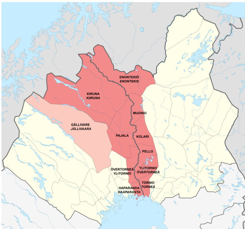
Figur 3 - Tornedalen

Tornedalen, (Meänmaa på meänkieli – ”vårt land”), är ett område i norra Sverige som omger Torne älv. Torne älv utgör också ungefär 190 km av gränsen med Finland från Lappea till Bottenviken. Förutom de två rikena delade 1809 Torne älven det finskspråkiga Tornedalen i en svensk och en finsk del när Sverige avträdde Finland till Ryssland. (Hyltenstam, 1999: 98)