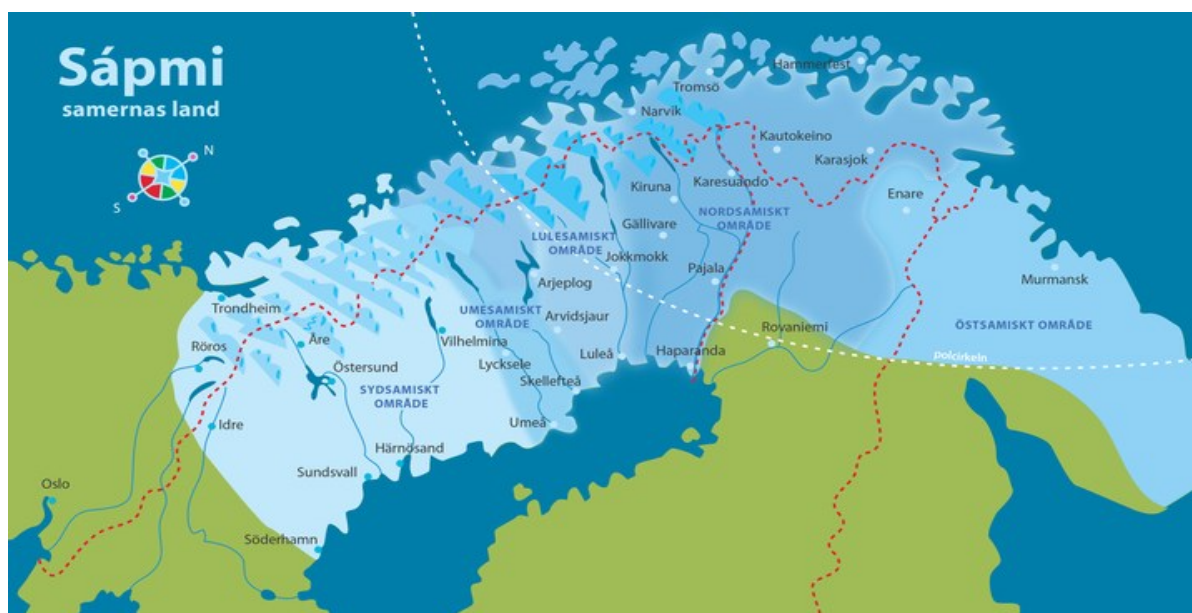
Figur 2 - Sápmi

Norra Skandinavien och den ryska Kolahalvön – området som heter Sápmi på samiska – har varit hem till samerna i åtminstone 2 500 år. Därför räknas samerna som Skandinaviens ursprungsbefolkning. Under 1500-talet började samerna syssla med det de är mest kända för – renskötsel.