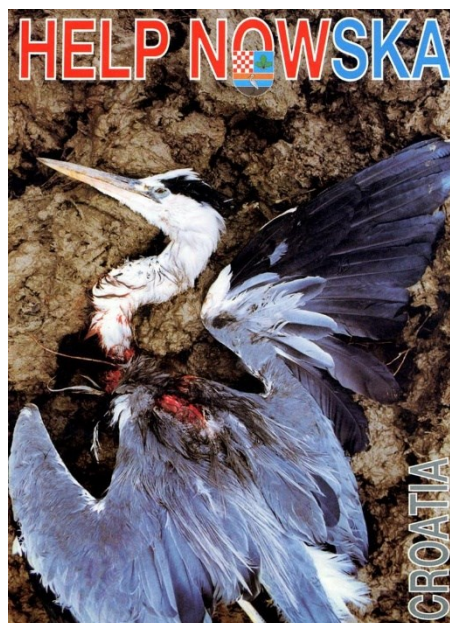
Slika 2.1. Antiradni plakat „Help Novska“ 334