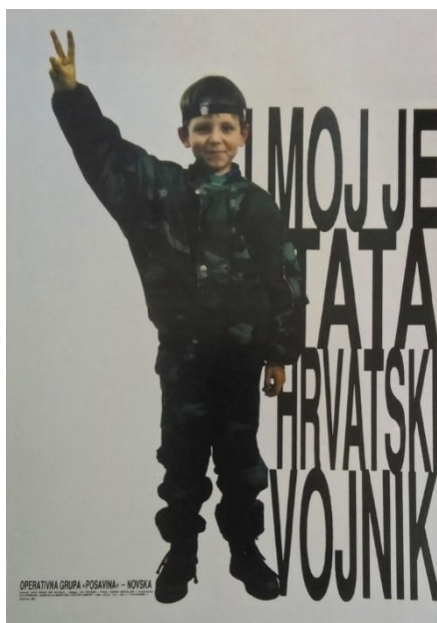
Slika 2. Antiradni plakat „I moj tata je hrvatski vojnik“ 333