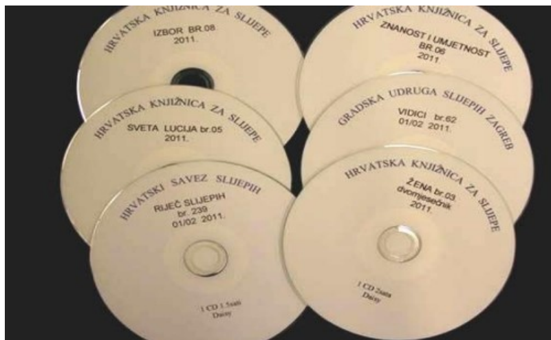
Slika 7. Časopisi na CD-u u Hrvatskoj knjižnici za slijepe

snimanja, od 2000. zvučne knjige su na novim medijima – CD-ovima. 66 Poslovi koji se obavljaju na odjelu su prvenstveno snimanje, ali i kopiranje knjiga na CD-ovima u Daisy formatu. Knjige koje se snimaju su većinom s područja znanstveno popularne ili stručne literature. Prema izvješću iz 2014. godine 67 , do tada je knjižnica sveukupno imala 116 snimljenih naslova to jest 1530 sati snimke. Još neki od poslova za koje je zadužen odjel za proizvodnju zvučnih izdanja su: „Izrada digitalne arhive zvučnih knjiga, prebacivanje originala zvučnih knjiga sa magnetofonskih vrpca u digitalni format, te izrada digitalnih zvučnih kopija u Daisy formatu i snimanje, kopiranje i distribucija bespovratnih kopija zvučnih časopisa čiji je izdavač Hrvatska knjižnica za slijepe.“ 68 U Daisy formatu na CD-ovima mogu se pronaći i mnogi časopisi kao što su primjerice časopis Izbor, časopis Sveta Lucija koji je religioznog karaktera te časopisi kao što su Znanost i umjetnost i Žena (Slika 7).