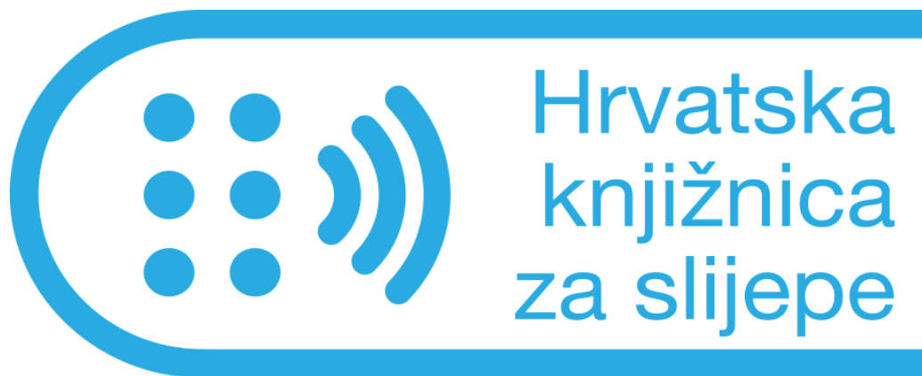
Slika 1. Logo Hrvatske knjižnice za slijepe