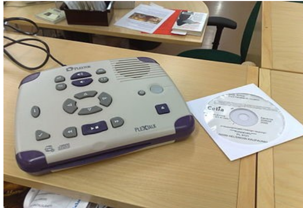
Slika 5. DAISY player i zvučna knjiga

Kada je riječ o distribuiranju knjiga u Daisy formatu, ono se odvija putem interneta, putem USB-a, ali i putem CD/DVD-a. Od 2006. godine snimanje knjiga u Daisy formatu je prihvaćeno kao standardno snimanje. Snimanje knjiga to jest novih naslova u Daisy formatu, u Hrvatskoj knjižnici za slijepe, započelo je početkom 2010. godine te su to većinom bili naslovi iz područja znanosti i lijepe književnosti. „Od 2010. zvučne knjige se snimaju isključivo u DAISY formatu koji će omogućiti korisnicima knjižnice navigaciju po tekstu po broju stranica, poglavljima, naslovima, ovisno o načinu na koji je knjiga snimljena.“ 44 Hrvatska knjižnica za slijepe je i članica Daisy konzorcija, a prva knjiga koja je snimljena u Daisy formatu u Hrvatskoj knjižnici za slijepe je Tkanje života, a autorica tog djela je Mirjana Krizmanić (Slika 6).