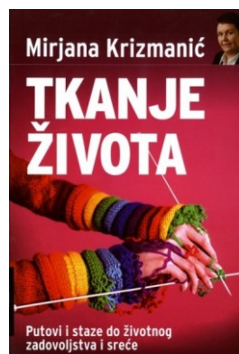
Slika 6. Prva knjiga snimljena u Daisy formatu

Kada je riječ o distribuiranju knjiga u Daisy formatu, ono se odvija putem interneta, putem USB-a, ali i putem CD/DVD-a. Od 2006. godine snimanje knjiga u Daisy formatu je prihvaćeno kao standardno snimanje. Snimanje knjiga to jest novih naslova u Daisy formatu, u Hrvatskoj knjižnici za slijepe, započelo je početkom 2010. godine te su to većinom bili naslovi iz područja znanosti i lijepe književnosti. „Od 2010. zvučne knjige se snimaju isključivo u DAISY formatu koji će omogućiti korisnicima knjižnice navigaciju po tekstu po broju stranica, poglavljima, naslovima, ovisno o načinu na koji je knjiga snimljena.“ 44 Hrvatska knjižnica za slijepe je i članica Daisy konzorcija, a prva knjiga koja je snimljena u Daisy formatu u Hrvatskoj knjižnici za slijepe je Tkanje života, a autorica tog djela je Mirjana Krizmanić (Slika 6).