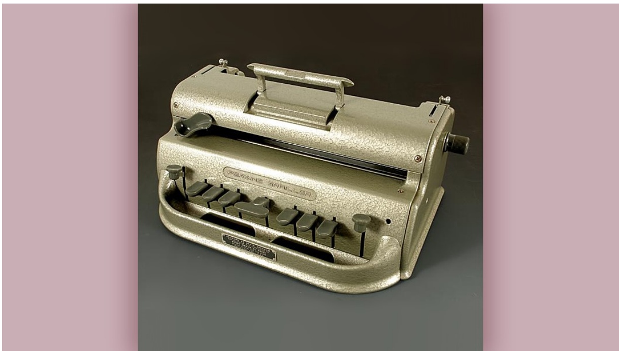
Slika 4. Pisaci stroj Perkins

Dakle proces izrade brajice uz pomoć tablica i šila se odvijao mnogo prije samog razvoja računala i tehnologije. „Tablica se sastoji od dva preklopna dijela između kojih se stavlja papir za pisanje. Na gornjem dijelu tablice nalaze se otvori kroz koje se šilom utiskuju slova u udubljenja na donjoj podlozi. Svaki otvor na tablici predviđen je za jednu šestotočku. Piše se utiskivanjem šilom, s desna na lijevo, slovo po slovo. Kada je tekst napisan, papir se vadi iz tablice, kojeg je najprije potrebno okrenuti tako da se slova mogla reljefno očitati prstima. Tekst se zatim čita s lijeva na desno.“ 33