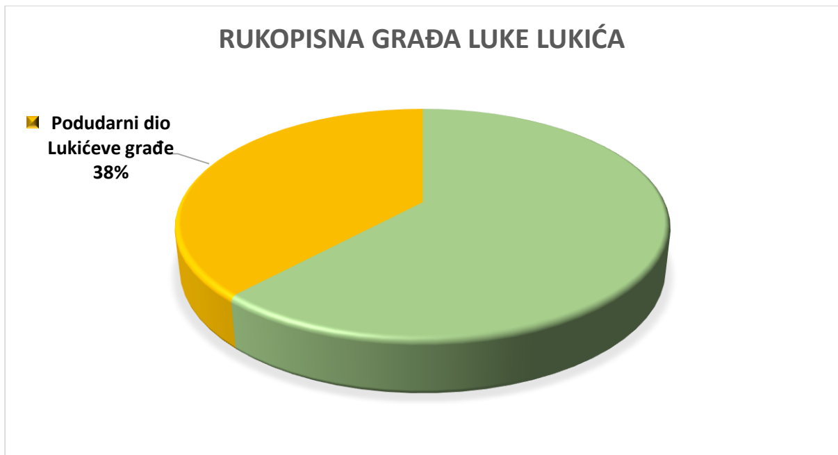
Slika 3. Podudarni dio Lukićeve građe

Gledajući sveukupni broj podudarnih Lukićevih stihova u Jankovićevim zbirkama u odnosu na one u Lukićevoj rukopisnoj građi pjesama, statističkom analizom utvrdilo se 7,83% podudarnih stihova šokačkih napjeva što pokazuje drugi graf (Slika 2). Podatak se ne čini nevjerojatnim sve dok se ne uzme u obzir sveukupna rukopisna Lukićeva građa pjesama prikazana na trećem grafu (Slika 3) iz kojeg zaključujemo kako je gotovo polovica tih stihova podudarna s Jankovićevim zapisima.