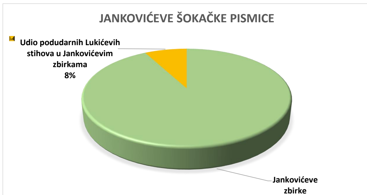
Slika 2. Udio podudarnih Lukićevih stihova u Jankovićevim zbirkama

Iz grafa (Slika 1) može se iščitati da je u prvoj Jankovićevoj zbirci broj podudarnih Lukićevih stihova 6,60% (132 podudaranja), u drugoj 8,43% (188 podudaranja), a u trećoj 8,41% ili 160 podudarnih stihova.