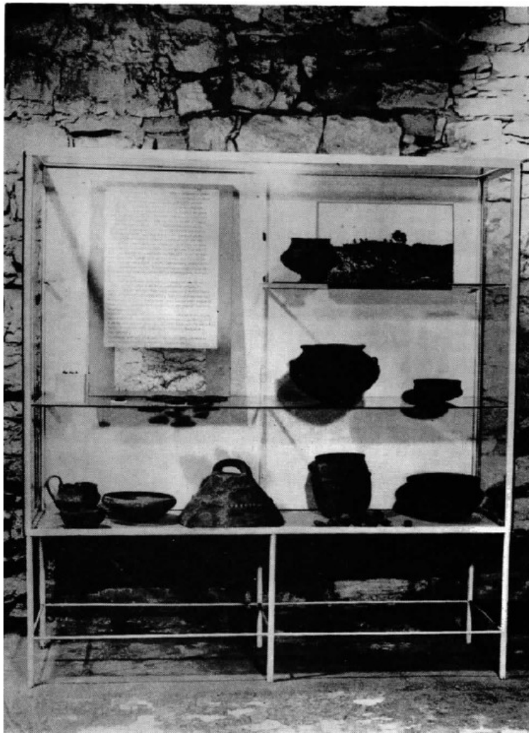
Slika 5 Detalj iz stalnog postava Arheološkog odjela smještenog u podrumu Staroga grada (Tomičić, 1985.b, 12)

Jedanaest godina kasnije, kao respektabilan istraživač i u ono vrijeme najbolji poznavatelj strukture terena i terenskog rada u varaždinskoj okolini, postaje prvim kustosom Prehistorijskog odjela, čime slijedno dolazi do uvođenja prvog stalnog postava arheološke građe u prizemlju palače Sermage ( Arheološki odjel , pristupano 03.04.2021.). U ulozi kustosa pretežno je posvećen terensko-istraživačkom radu, ali obavlja i post-terensku obradu materijala sa različitih lokaliteta, dopune arheološke topografije te paralelno kompletira muzejsku dokumentaciju arheološke i paleontološke građe uz ulogu odgovornosti prema stalnom postavu (ibid). Postav potom 1975. godine seli u podrumске prostorije tvrđave (slika 5), a nakon potresom uzrokovanih oštećenja 1982. godine, Gradski muzej Varaždin ostaje bez arheoloških, stalno eksponiranih predmeta (Tomičić, 1985.b, 10).