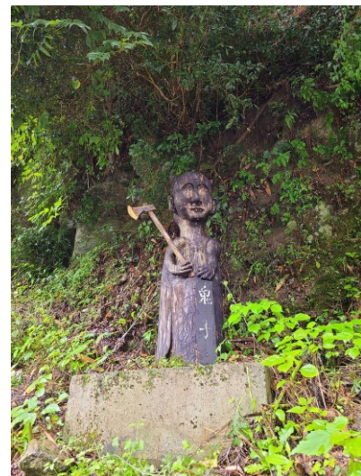
slika 7 – Oni-go

Oni-go se prevodi kao demonsko dijete, a njegova priča je novijeg datuma u ovom kraju, vjerojatno nastala krajem 19. stoljeća. Dijete se je rodilo sa svim zubima, rogovima i očima na potiljku te je odmah prohodalo. Kako je odrastalo tako je radilo loše stvari kao što je uništavanje ceremonijalnog užeta za Novu godinu nakon čega bi otišlo i nestalo u planini. Ovo se dogodilo tadašnjem upravitelju sela i negativnog je konteksta pa je postala yōkai priča. Priče o demonskoj djeci se mogu pronaći po cijelom Japanu. Naime, roditelji su znali djecu s nekim vidljivim invaliditetom odvesti negdje nakon rođenja pa su ovakve priče bile opravdanje djetetovog nestanka (Shoichi Shimooka, 5. 7. 2020.).