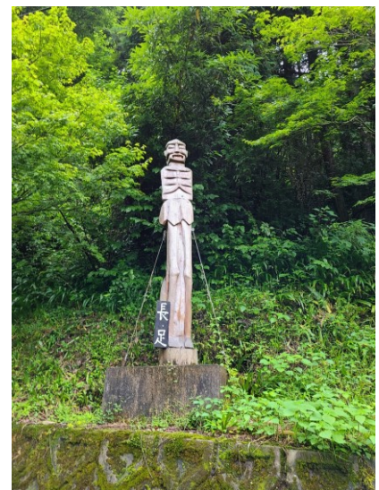
slika 19 – Naga-ashi

Ovaj yōkai lovi ljude koji ostanu dugo na planini i ne krenu se vraćati doma na vrijeme pa dočekaju noć. On može svakoga uloviti jer ima dovoljno velik korak da može prekoračiti planinu i jako je brz jer ima govedska kopita. Iako kip nema ruke, ili nisu uočljive, Naga-ashi ima ruke.