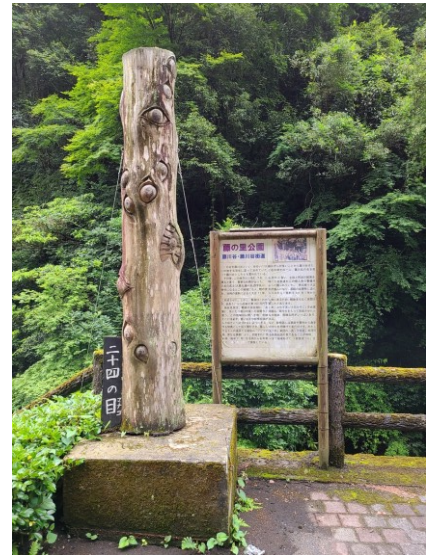
slika 18 – Nijūyon-no-Manako

Priča ovog yōkaija se ne nalazi u Yōkai Yashikiju ili u knjizi Otoshiya (Shimooka, 2017) jer su ovog yōkaija izmislila djeca. Razlog zašto ima 12 pari očiju je zato što je u to vrijeme školu završilo 12 učenika, a svaki učenik je dodao 1 par očiju (Shoichi Shimooka, 5. 7. 2020.). Natpis iza kipa govori o tome kroz što je prošla regija nakon Prvog svjetskog rata pa sve do rasta popularnosti zahvaljujući mangi Gegege no Kitarō. Nadalje govori o osnutku festivala i tome kako je to napravljeno za djecu i starije iz regije. Ovaj park je važna stanica na festivalu, a kip je primjer svjesnog stvaranja yōkaija.