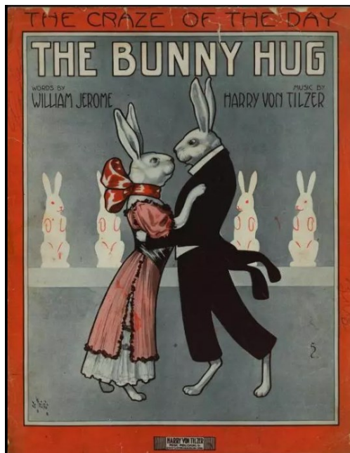
Bild 5. Bunny Hug Musikblatt, 1912.

Ursprünglich wurde der Jive 1934 der Öffentlichkeit vorgestellt von Cab Calloway, einem amerikanischen Jazzsänger (Blank und Golovach, 2019). Er könnte auch als eine lebhafte und ungehemmte Variante des Jitterbug 11 , einer Form des Swing-Tanzes, betrachtet werden. Glenn Miller führte 1938 seinen eigenen Jive-Tanz mit dem Lied Doin' the Jive ein, der sich jedoch nie durchsetzen konnte (ebd.). Der Jive wurde auch durch den Boogie, Rock & Roll, African American Swing und Lindy Hop beeinflusst. Amerikanische Soldaten brachten den Lindy Hop um 1942 nach Europa, wo dieser Tanz schnell eine Anhängerschaft unter der Jugend fand (ebd.). In Großbritannien unterschied man Variationen in der Technik zu Stilen wie dem Boogie-Woogie und dem Swing Boogie, wobei sich Jive allmählich als Oberbegriff durchgesetzt hat.