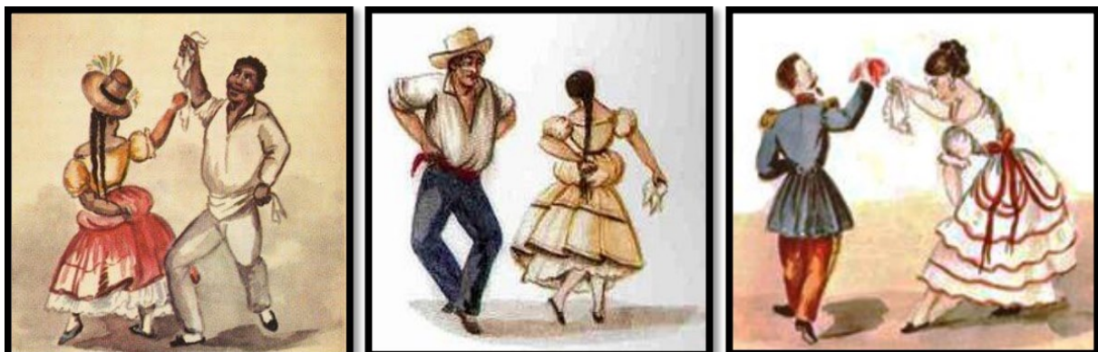
Bild 4. Sammlung der Aquarellgemälden von Pancho Fierro. Darstellungen von Tänzern bei der Aufführung von Zamacueca um 1840.