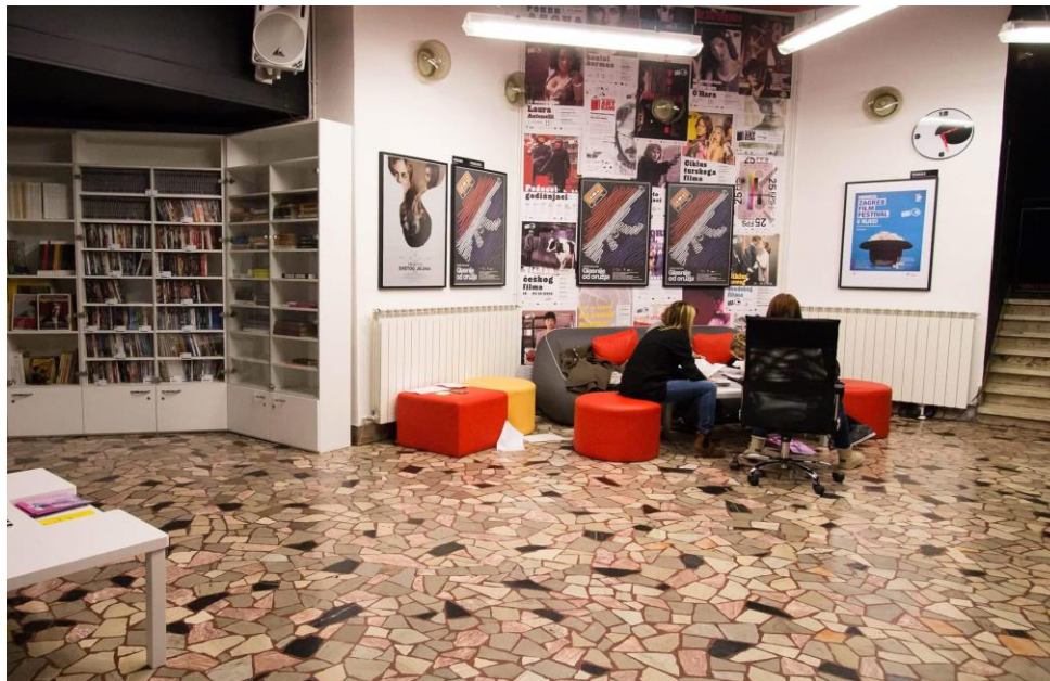
Fotografija 5. Čitaonica i prostor za opuštanje