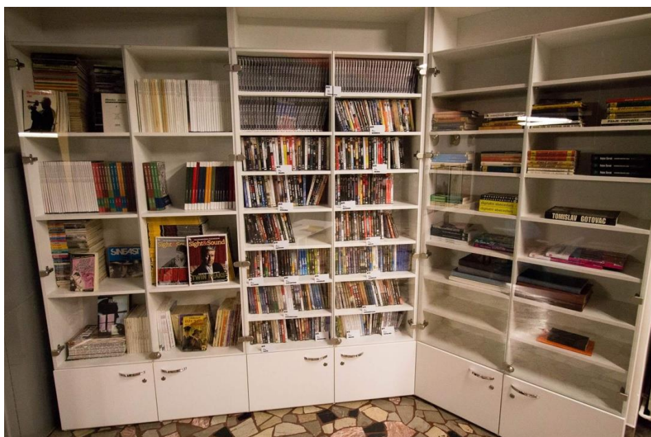
Fotografija 4. Periodika i Audiovizualna zbirka