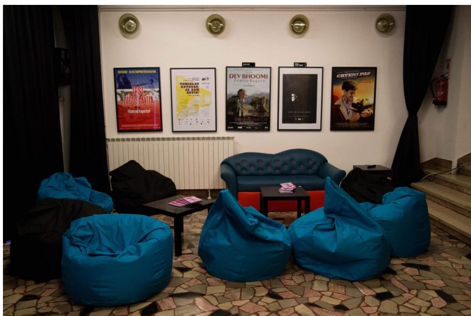
Fotografija 6: Prostor za radionice, panele, promocije i sl.