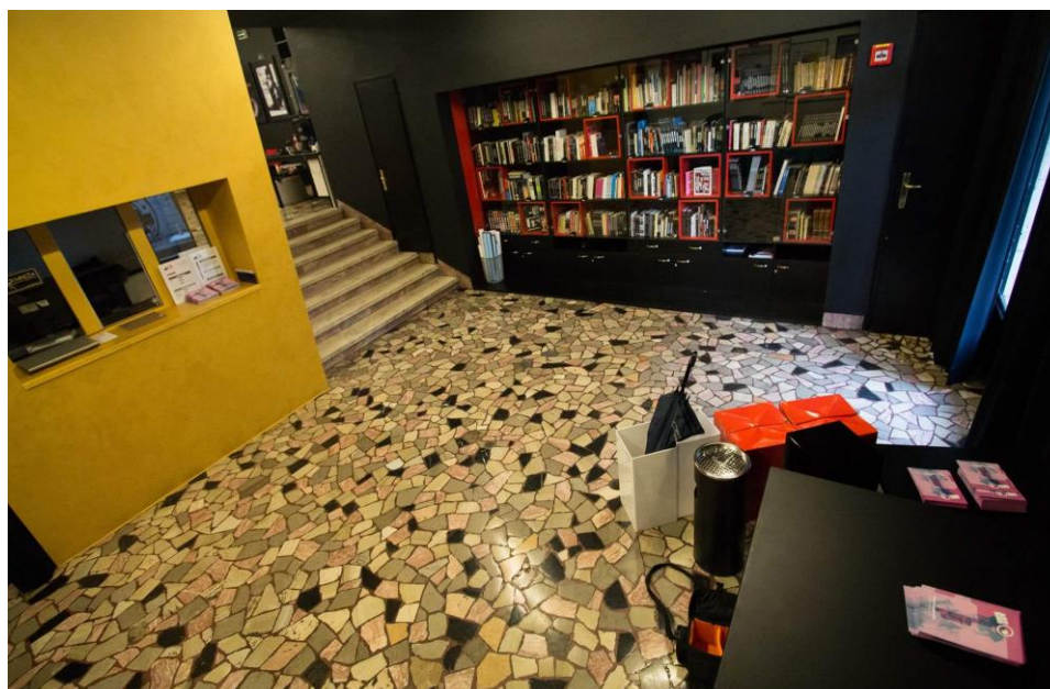
Fotografija 2: Atrij Kina - unutrašnjost Knjižnice