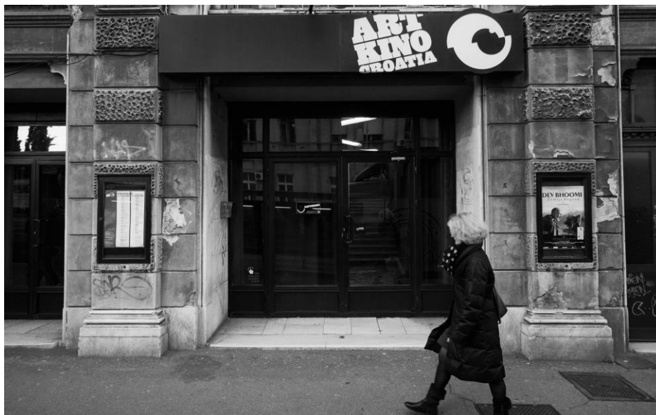
Fotografija 1. Art-kino Croatia izvana u čijem se atriju nalazi Knjižnica Art-kino