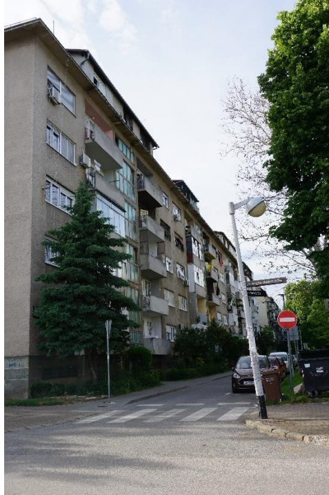
Slika 25 - Jurić - Zagreb, stambeno naselje Vrbik-Poljane, jugoistočna strana zgrade (2021.)