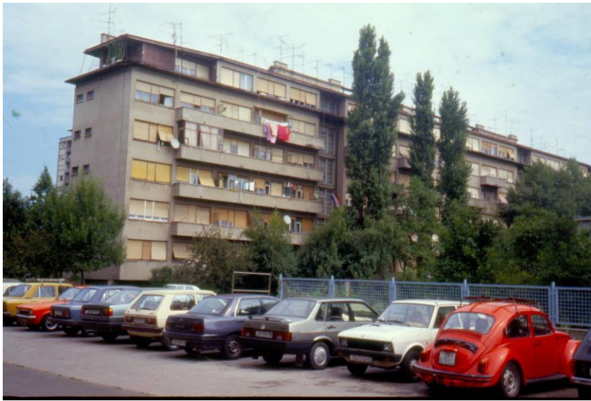
Slika 14 - Maroević - Zagreb, Vukovarska 238, stambena zgrada (Geršić, 1950-2), južno pročelje sa zapada

Stambena arhitektura s povezanim balkonima i jednostavnim prozorima te, opet, potpuno prozorima otvorenim stubištem, ne ostavljaju dojam istog objekta. Pomalo neuredna stambena zgrada, koja u trenutku fotografije u zbirci (koja je datirana u 1995.godinu) već nosi sva obilježja “života ljudi u objektu“. Dio promijenjenih prozora, zatvorenih balkona i postavljanja sušila za rublje ne odaju dojmom zaštićenog kulturnog dobra. Na ovim dijapozitivima su, također vidljive bočne strane koje nose samo male prozore i potpunu zatvorenost. Zadnja etaža odvojena je istakom, a zgrada „Kruge“ izgleda potpuno drugačije sa svojeg reprezentativnog, sjevernog, “hodničkog“ i južnog “ljudskog“ pročelja.