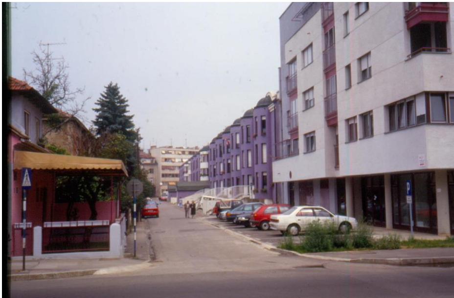
Slika 18 - Maroević - Zagreb, Cernička ulica, novogradnje