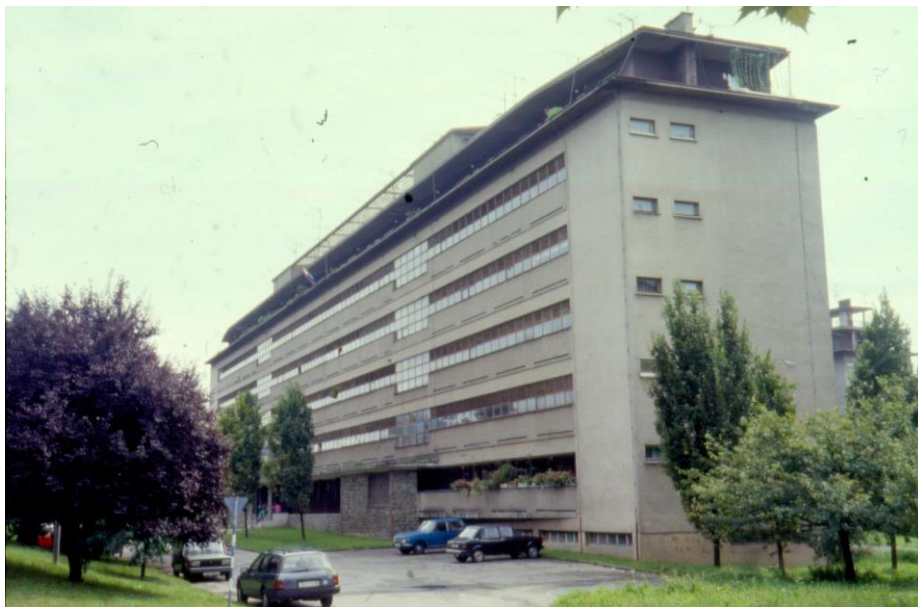
Slika 13 - Maroević Zagreb, Vukovarska 238, stambena zgrada (Geršić, 1950-2), sjeverno pročelje sa zapada

Samo nekoliko brojeva niže, na broju 238, nalazi se višestambena peterokatnica izvedena prema projektu Ive Geršića. Ona je zaštićeno kulturno dobro smješteno s južne strane Ulice grada Vukovara u blizini križanja s avenijom Marina Držića. Godina projektiranja ove zgrade je 1950., ali početak njezine izgradnje je zabilježen tek tri godine kasnije, u 1953. godini, a gradnja je završila 1956. Sa sjeverne strane koja gleda na Vukovarsku aveniju, projektiran je neprekinuti, modernistički, niz prozora koji se za područje stubišta udvostručava u svojoj veličini da bi stubište bilo osvijetljeno. Taj cijeli red prozora je zapravo hodnik koji je u prizemlju i na zadnjoj etaži otvoren da bi stanarima zadnjega kata dao balkone. Ovakav način gradnje, otvorene zadnje etaže vidljiv je i na drugim objektima u istoj ulici. Osim ovoga, u prizemlju kod ulaza je korišten neobrađeni kamen koji ostavlja dojam rustikalnog ulaza, a i okolica zgrade je priroda. Ta okolna priroda tj. Livada parka nije izravnata već je zgrada prilagođena njezinim visinskim razlikama. Ovo je razlog zašto je zgrada za gotovo metar dublja na svojim krajevima nego kod ulaza.