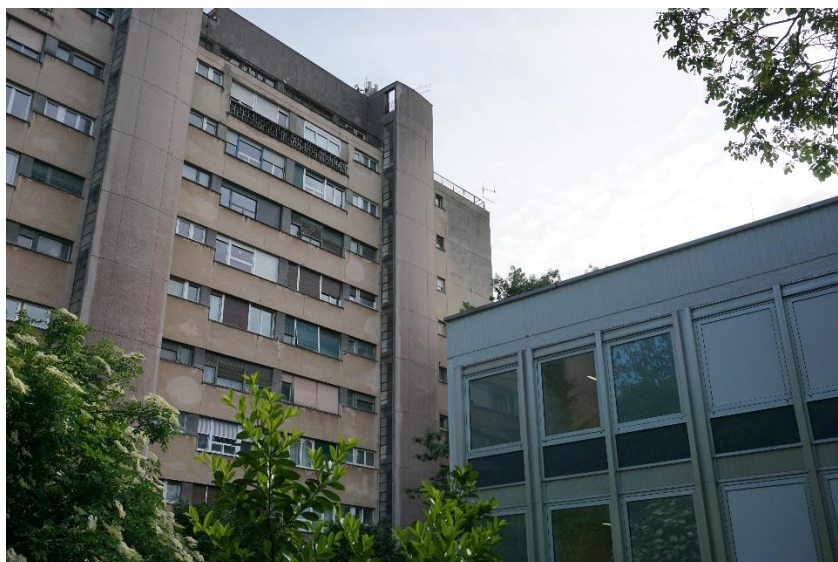
Slika 10 - Jurić, Ulica grada Vukovara 62 - 62a, B. Rašica (2021.)

Arhitekt Božidar Rašica, osim ova dva objekta je autor još dvije zgrade na početku Ulice grada Vukovara. Zgrada Hrvatske elektroprivrede (nekadašnja poslovna zgrada Jugonafte) na broju 37, koja je sagrađena 1955., a u obnovi 2015. godine su „svi drveni prozori na pročelju zamijenjeni su aluminijskim okvirima . A HEP je znamenitu građevinu devastirao pod okriljem zakona!“ 19 Naime, upravna zgrada HEP-a, koja je smatrana vrhunskim arhitektonskim remek-djelom 50-ih godina i „pokazuje pripadnost svjetskom internacionalnom stilu, poznatom pod nazivom kasni modernizam“ obnovljena je bez ikakvih ograničenja i obzira na urbanističku cjelinu. 20 Vidjevši ovaj primjer devastacije, građani su zasigurno bili više potaknuti očuvati objekt Jadranfilma. Zgrada HEP-a, doduše, više i nije baš vidljiva zbog novoizgrađene zgrade Raiffeisen banke.