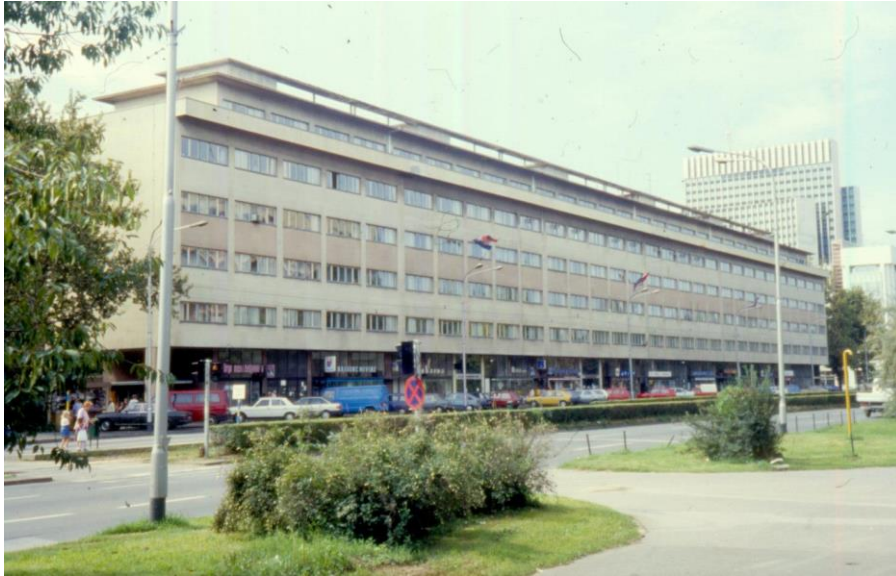
Slika 7 - Maroević - Zagreb, Vukovarska 56, općina Trnje (N. Šegvić), sjeverno pročelje s istoka (1995.)

Masivnost zgrade u pitanju vizualno je umanjena, na sjevernom pročelju koje gleda na Ulicu grada Vukovara, time što nema balkone ili druge pretjerano istaknute volumene. S ove, sjeverne strane se nalaze samo dugački redovi prozora i zidova dok su balkoni smješteni na južnoj strani. Ona umjesto na prometnicu, gleda na park smješten duž cijele južne strane zgrade. Na uglovima se nalaze veliki stupovi koji su od potresa pridržani pomoćnim pomičnim metalnim šipkama - stupovima. Na petome, i zadnjem katu, nalazi se uvučena terasa čija balkonska ograda uokviruje sam objekt poput velikog betonskog vijenca. Ritam reda prozora koji se proteže cijelom duljinom zgrade je tipično oblikovanje poslijeratne moderne arhitekture koji je vidljiv i na drugim primjerima, kako u Zagrebu tako i na Galićevoj, Fabrisovoj, ali i na još jednom Šegvićevom objektu na Vukovarskoj aveniji.