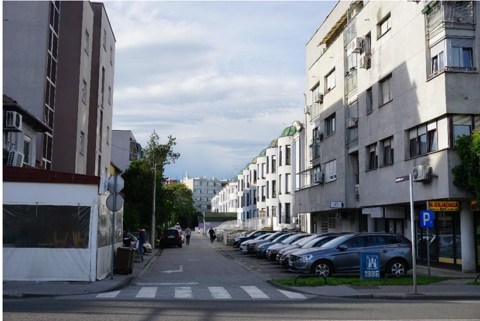
Slika 19 - Jurić - - Zagreb, Cernička ulica (2021.)

U zbirci se nalazi i treći dijapozitiv poslovno – stambene zgrade Stergarškega i Miličevića. Taj dijapozitiv prikazuje samostalno ovu zgradu s jugoistoka i obuhvaća cijeli objekt. Ovaj je dijapozitiv u samoj zbirci bio krivo zabilježen pod nazivom „Zagreb, stambena zgrada, Iločka 34/Vukovarska, pogled s jugoistoka“, dok je objekt te adrese, koji je idući naveden u ovome radu, zabilježen kao ova zgrada s jednom od njezine tri adrese: „Zagreb, stambena zgrada Gorjanska 26/Vukovarska, pogled s jugoistoka“.