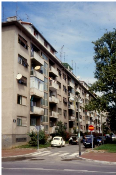
Slika 24 - Maroević - Zagreb, stambeno naselje Vrbik-Poljane, jugoistočna strana zgrade

Zadnja cjelina vezana uz Ulicu grada Vukovara koja se nalazi u Zbirci jest plansko stambeno naselje Vrbik – Poljane. Ovo naselje je u drugom planu oko Ulice grada Vukovara i nalazi se iza spomenute zgrade Nevena Šegvića na Ulici grada Vukovara na broju 58 - 60. Dijapozitivi prikazuju dvije od tri ulice stambenih zgrada u paralelno izgrađenim ulicama Gaje Alage, Frana Bošnjakovića i Ivana Stožira. Arhitekti Vladimir Potočnjak, Stjepan Gomboš i Viktor Hečimović zaslužni su za ovih „Osam višestambenih zgrada“. Izgrađene su 1946. do 1948. godine, a nose brojeve: Gaje Alage 1-8, Frana Bošnjakovića 1-8, Ivana Stožira 1-8 i Fausta Vrančića 1-8. 33