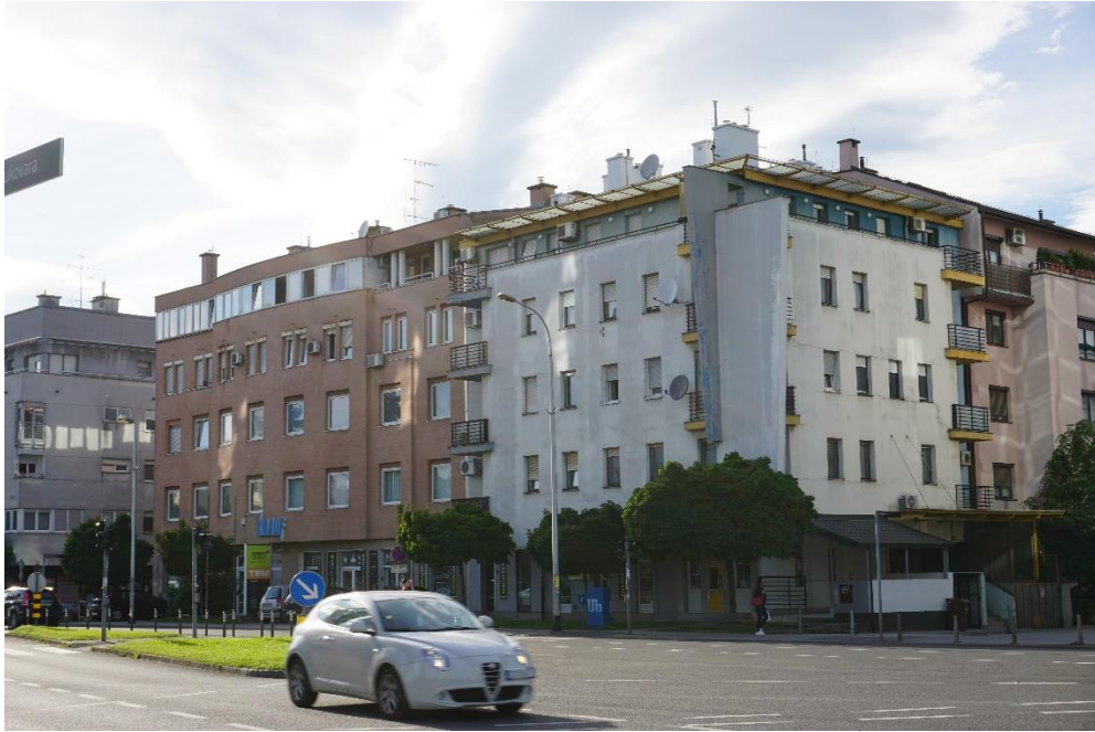
Slika 22 - Jurić - Zagreb, stambena zgrada, Iločka 34 - Ulica grada Vukovara, pogled s jugoistoka (2021.)