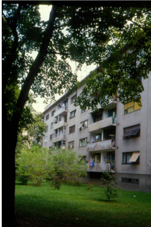
Slika 26 - Maroević - Zagreb, stambeno naselje Vrbik-Poljane, zapadna strana zgrade

Iako su same zgrade podijeljene po ulicama malo drugačije, ostavljaju jedinstven dojam. Iako su prozori od jednog do drugog stana drugačiji, neki balkoni zatvoreni, drugi ostavljeni otvoreni kao u izvornoj gradnji, a nekima su dodane nadstrešnice. Neke od zgrada su svježe obnovljene, a drugima je potrebna, barem obnova boje – one zbog istog ritma i rasporeda otvora, istog mjesta ulaza, paralelnosti te početaka i kraja zidova ostavljaju skladan i sinkroniziran dojam. Uz ovo, ove šesterokatnice su i danas zbog svoje lokacije, stabilne arhitekture, hortikulturalnog uređenja koje se nalazi između svih zgrada, parkirnih mjesta ispred samih zgrada i zavučenog položaja nepovezanog, a u neposrednoj blizini s jednom od najprometnijih ulica u Zagrebu, među najpoželjnijim objektima za život u cijelome gradu.