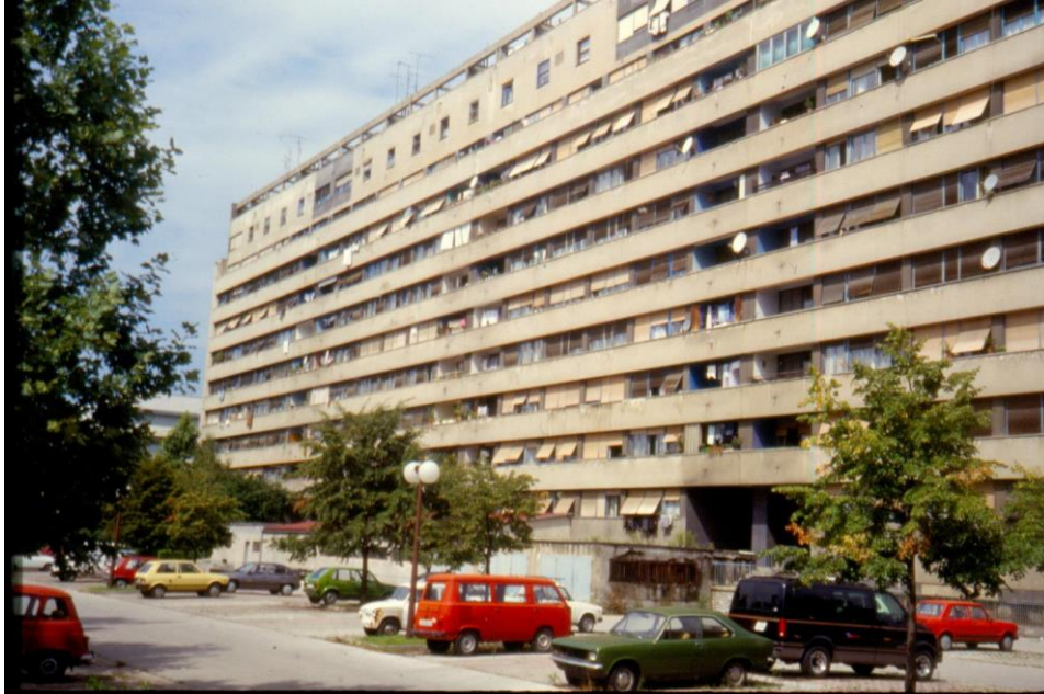
Slika 12 - Maroević - Zagreb, Vukovarska 224, stambena zgrada (N. Šegvić, 1953.), južno pročelje s istoka

smješteni su dugački balkoni koji zasigurno sa sobom nose impresivne poglede na jednu ili dvije avenije.