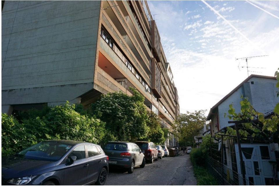
Slika 2 - Jurić - Zagreb, Ulica grada Vukovara 35 - 35a, stambena zgrada (Galić, 1953.), sjeverno pročelje s istoka (2021.)

U samoj Zbirci se, osim dijapozitiva samog objekta, nalazi i fotografija iz nepoznate literature koja prikazuje tlocrt karakterističnog dvoetažnog stana. Ovaj zabilježeni crtež ne nosi samo osnovne arhitektonske elemente poput zidova, prozora, stepenica, liftova, balkona i vrata već i neki osnovni namještaj. Namještaj poput stolova, stolica i kuhinjskih elemenata su ucrtani da bi se lakše zamijetila namjena svake prostorije te potencijalni oblik uređenja.