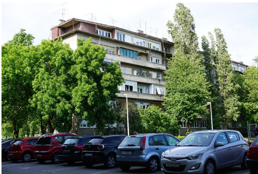
Slika 15 - Jurić - Zagreb, Vukovarska 238, stambena zgrada (Geršić 1950-2), južno pročelje sa zapada (2021.)