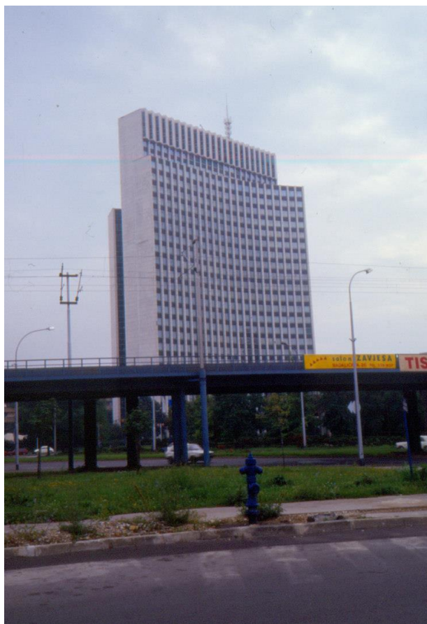
Slika 23 - Maroević - Zagreb, Savska 41, poslovna zgrada Zagrepčanka (Jelinek), sa sjeverozapada