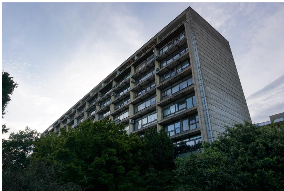
Slika 4 - Jurić - Ulica grada Vukovara 43 - 43a, D.Galić (1953.), južno pročelje s istoka (2021.)