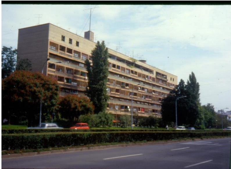
Slika 1- Maroević - Zagreb, Vukovarska 35a, stambena zgrada (Galić, 1953.), južno pročelje sa zapada (1995.)

U prizemlju Galićeve zgrade na broju 35 su između stupova dodani objekti poput restorana, knjižnice i pošte. Ovakvi ugostiteljski i poslovni objekti se nalaze i u Corbusierovoj, spomenutoj, zgradi. Obje zgrade ipak, za razliku od Le Corbusierovih, na svojih osam nadzemnih etaža sadrže 68, ali dvoetažnih stanova. 12 Zgrada i dalje izgleda suvremeno s južnog pročelja koje je obnovljeno 2010. godine dok je sjeverno pročelje generalno zapuštenije.