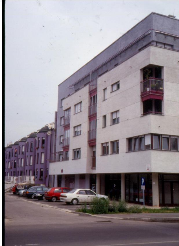
Slika 17 - Maroević - Zagreb, stambena zgrada, Cernička-Vukovarska