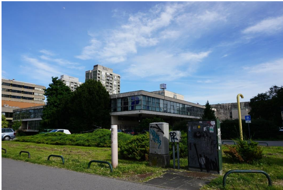
Slika 11 - Jurić - Zagreb, Ulica grada Vukovara 68, N. Kučan (1956-62), (2021.)

Sa svim ovim informacijama na umu zapravo je iznenađujuće da se Radničko sveučilište ne nalazi na dijapozitivima Zbirke „Maroević“.