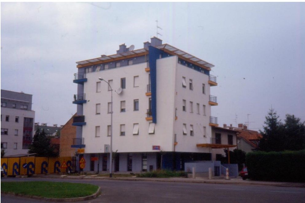
Slika 21 - Maroević - Zagreb, stambena zgrada, Iločka 34-Vukovarska, pogled s jugoistoka

Ova zgrada na uglu Ulice grada Vukovara i Iločke ulice nosi adresu Iločka 34 te je bila krivo spremljena u digitalnoj Zbirci „Maroević“. Ona se sastoji od pet etaža te ponavlja elemente zgrade koja se, u trenutku snimanja, nalazi pokraj nje. Oblici prozora su istog oblika, zadnja etaža koja sadrži dugačke balkone, a i same boje koje su korištene te na kojim dijelovima prikazuju održavanje ritma između ova dva objekta. Balkoni koji se nalaze na uglovima zgrade su također ponovljeni element, ali dio koji ju ističe jesu dijagonalni istaci na jugoistočnom kutu koji dodaju dinamici same građevine.