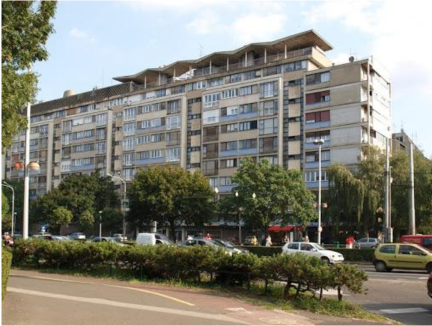
Slika 6