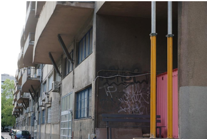
Slika 9 - Jurić - Zagreb, Ulica grada Vukovara 56, općina Trnje (N. Šegvić), južno pročelje s istoka, detalj posljedica potresa (2021.)