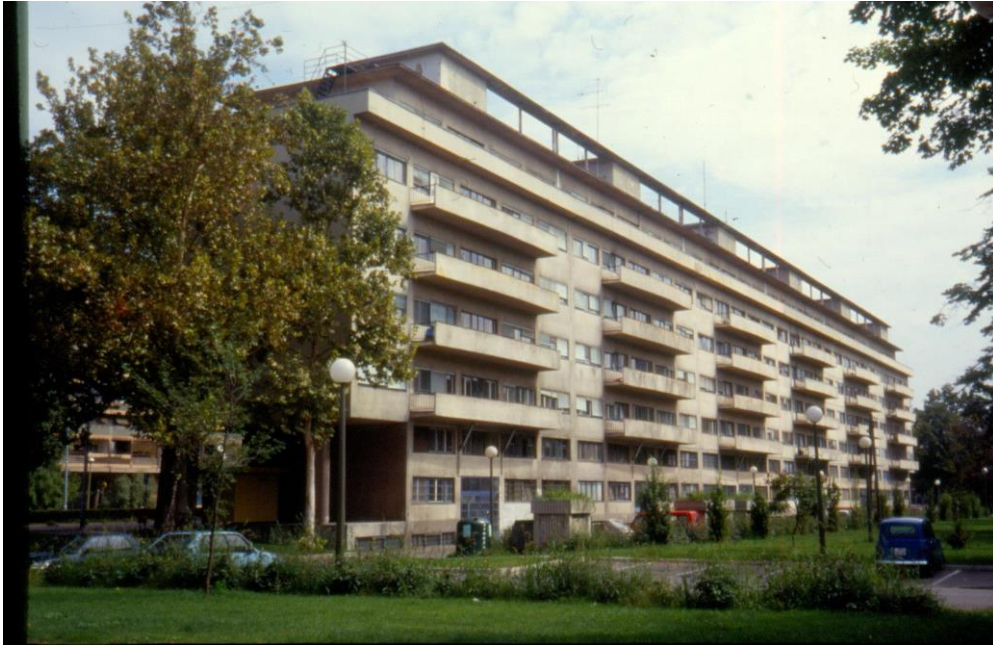
Slika 8 - Maroević - Zagreb, Vukovarska 56, općina Trnje (N. Šegvić), južno pročelje sa zapada (1995.)