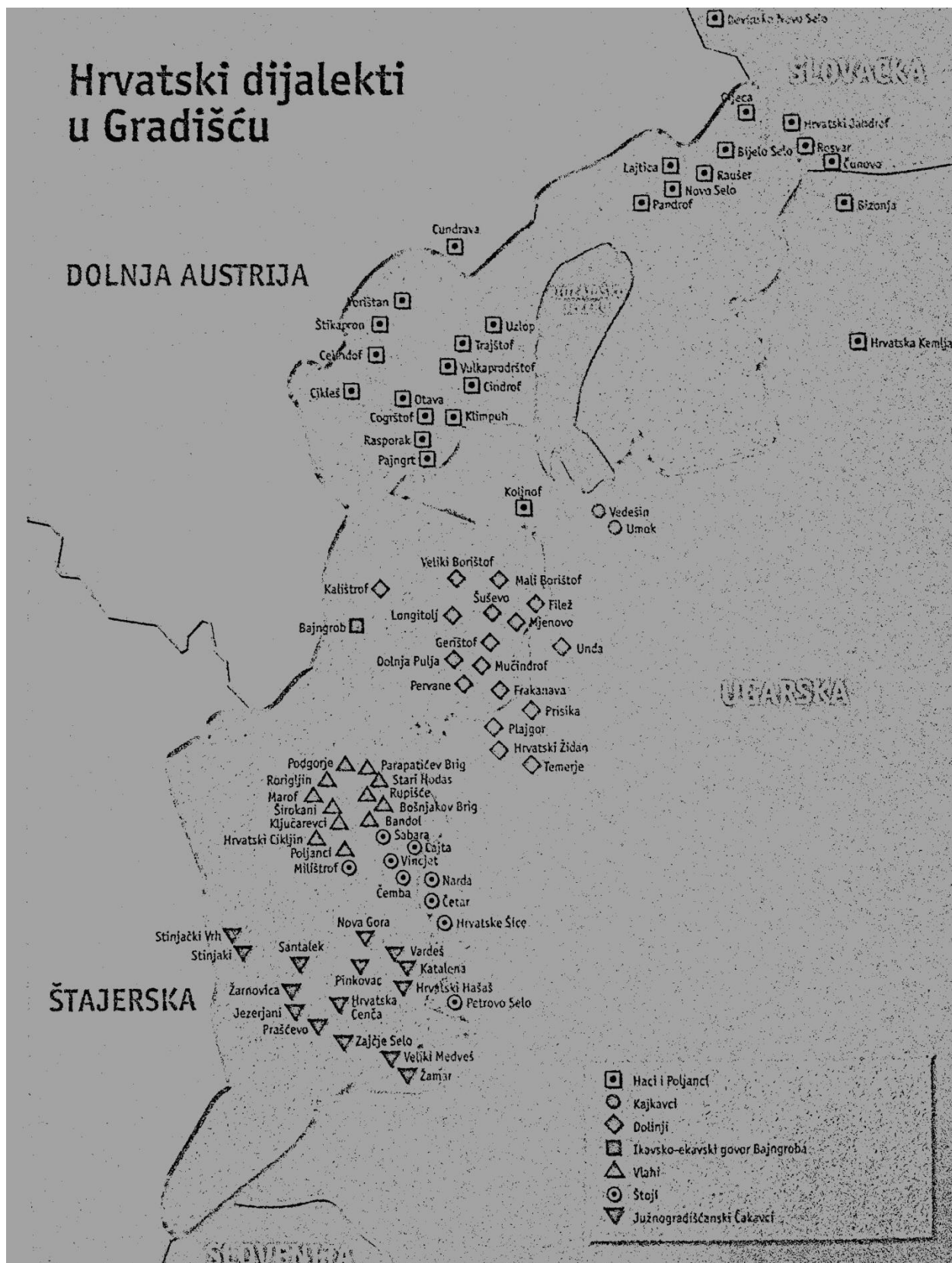
Slika 3: Prikaz rasprostranjenosti hrvatskih dijalekata u Gradišću (Karall 1998: 172)