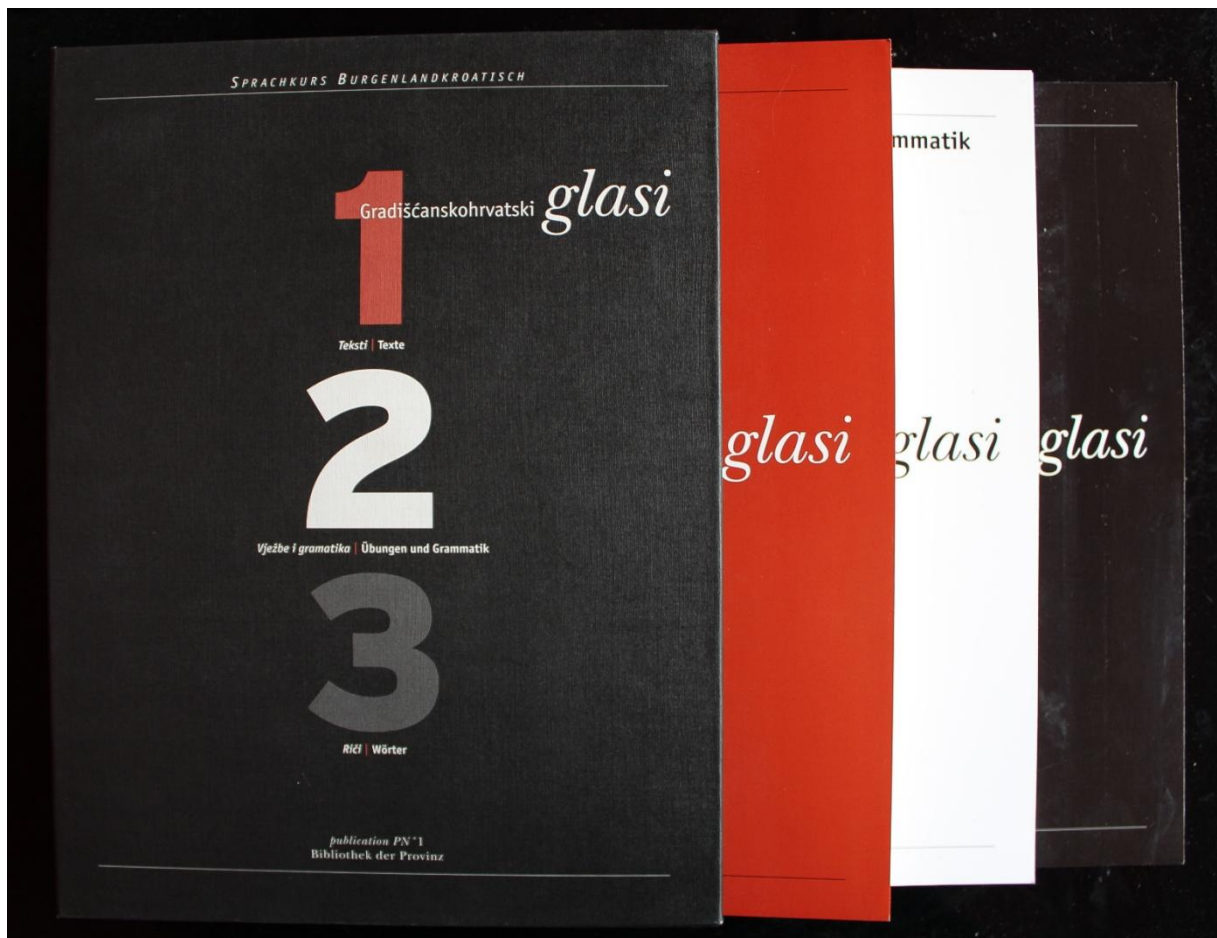
Slika 2: Prikaz udžbenika „Gradišćanskohrvatski glasi“

na standardni gradišćanskohrvatski jezik. Navedeni materijali sastoje se od knjige broj 1 Teksti/Texte u kojoj se nalaze tekstovi s temama iz svakodnevnog života na gradišćanskohrvatskom jeziku. Knjiga broj 2 Vježbe i gramatika/Übungen und Grammatik sadrži vježbe koje su usko povezane s tekstovima iz knjige broj 1 i gramatiku gradišćanskohrvatskog jezika. U trećoj knjizi Riči/Wörter nalazi se rječnik s riječima iz tekstova koji se nalaze u prvoj i drugoj knjizi.